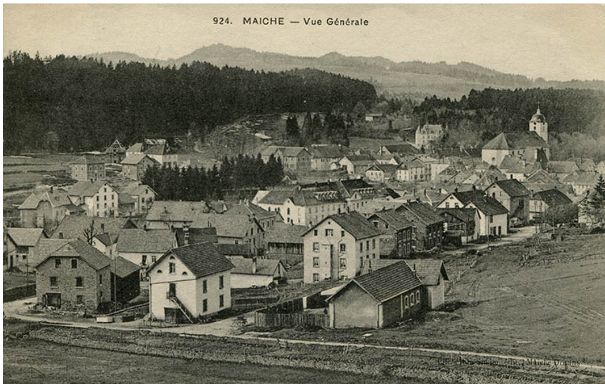
924. Maïche - Vue générale [à l'angle des rues de Goule et du Mont], vers 1911. Le bâtiment est visible à gauche. 25, Maïche, 29 rue du Mont-Miroir