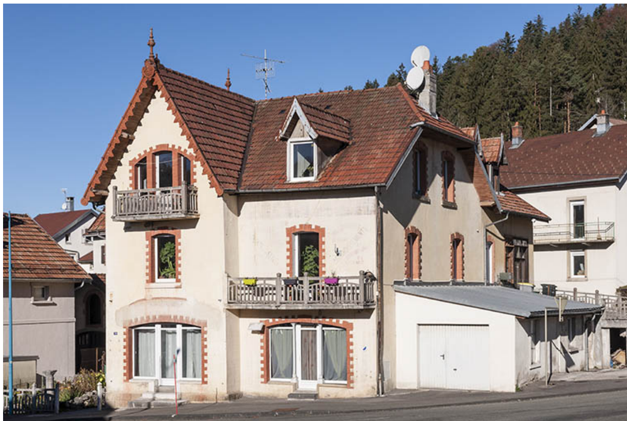
Façades antérieure et latérale droite.