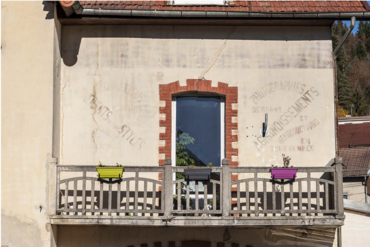
Façade antérieure : enseigne peinte.