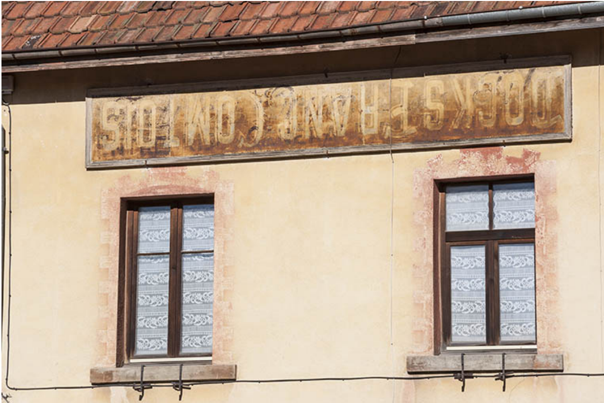
Façade antérieure : encadrements de fenêtres peints en trompe-l'oeil et enseigne réutilisée. 25, Maîche, 29 rue du Mont-Miroir