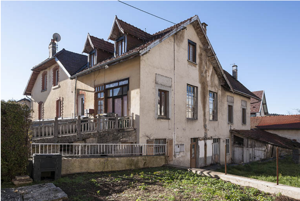
Façades postérieure et latérale droite.