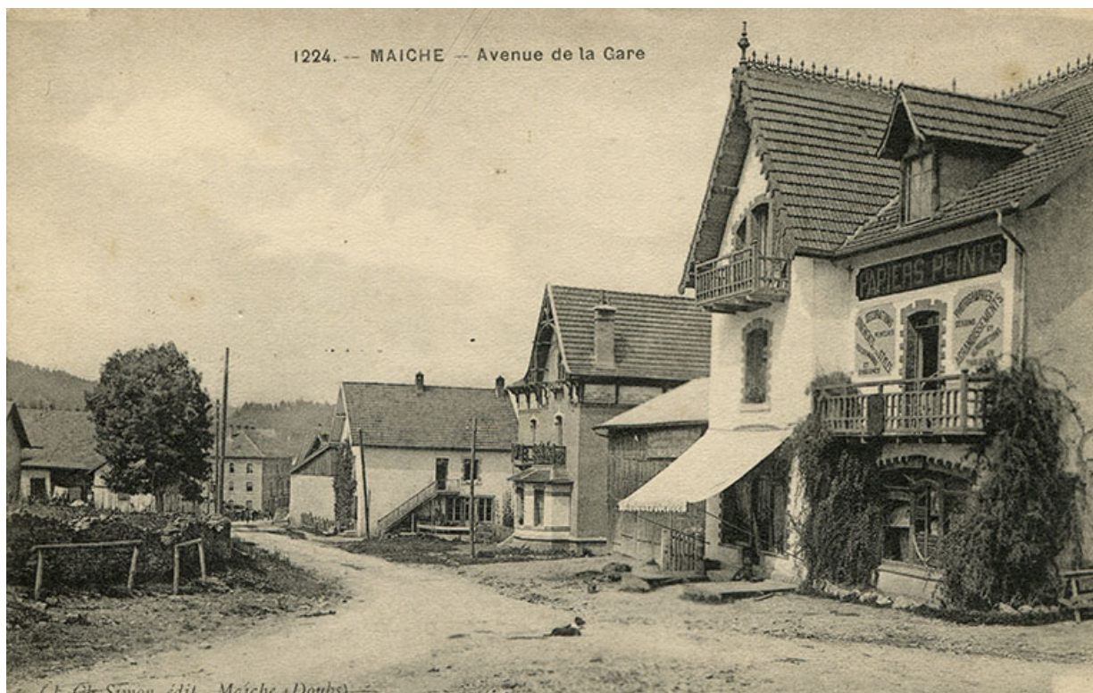
1224. - Maïche - Avenue de la Gare [depuis le carrefour des rues de Goule et du Mont], 1er quart 20e siècle (entre 1911 et 1921). Maison Grux puis atelier d'horlogerie d'Amédée Mairot à droite, maison de l'architecte Langlois puis de l'horloger Paul Mauvais au centre.