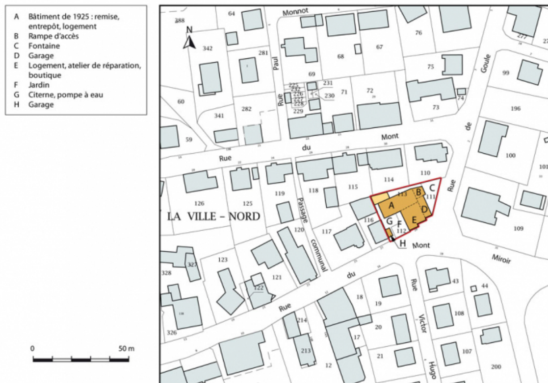
Plan-masse et de situation. Extrait du plan cadastral, 2015, section AB. 25, Maîche, 29 rue du Mont-Miroir