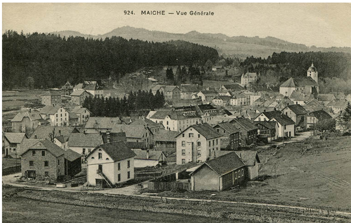
924. Maïche - Vue générale [à l'angle des rues de Goule et du Mont], vers 1911. Le bâtiment est visible à gauche. 25, Maïche, 29 rue du Mont-Miroir

924. Maïche - Vue générale [à l'angle des rues de Goule et du Mont], carte postale, par Ch. Simon, s.d. [1er quart 20e siècle, vers 1911], Simon éd. à Maïche et Ornans. Publiée dans : Simonin, Michel ; Choulet, Jean-Marie. Maïche hier et aujourd'hui. - 1999, p. 33. Egalement publiée dans : Vuillet, Bernard. Entre Doubs et Dessoubre. Tome II. Autour de Maïche et Belleherbe. - 1990, p. 66.