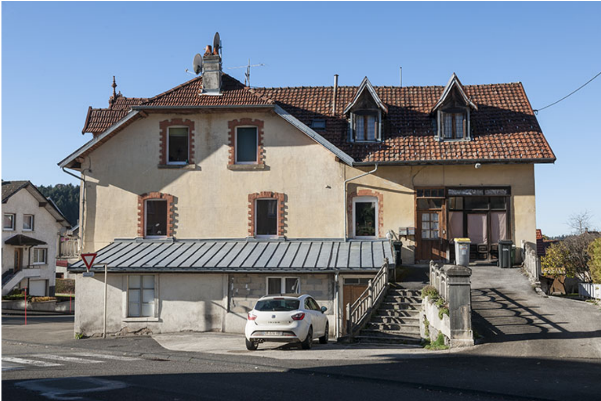
Façade latérale droite.