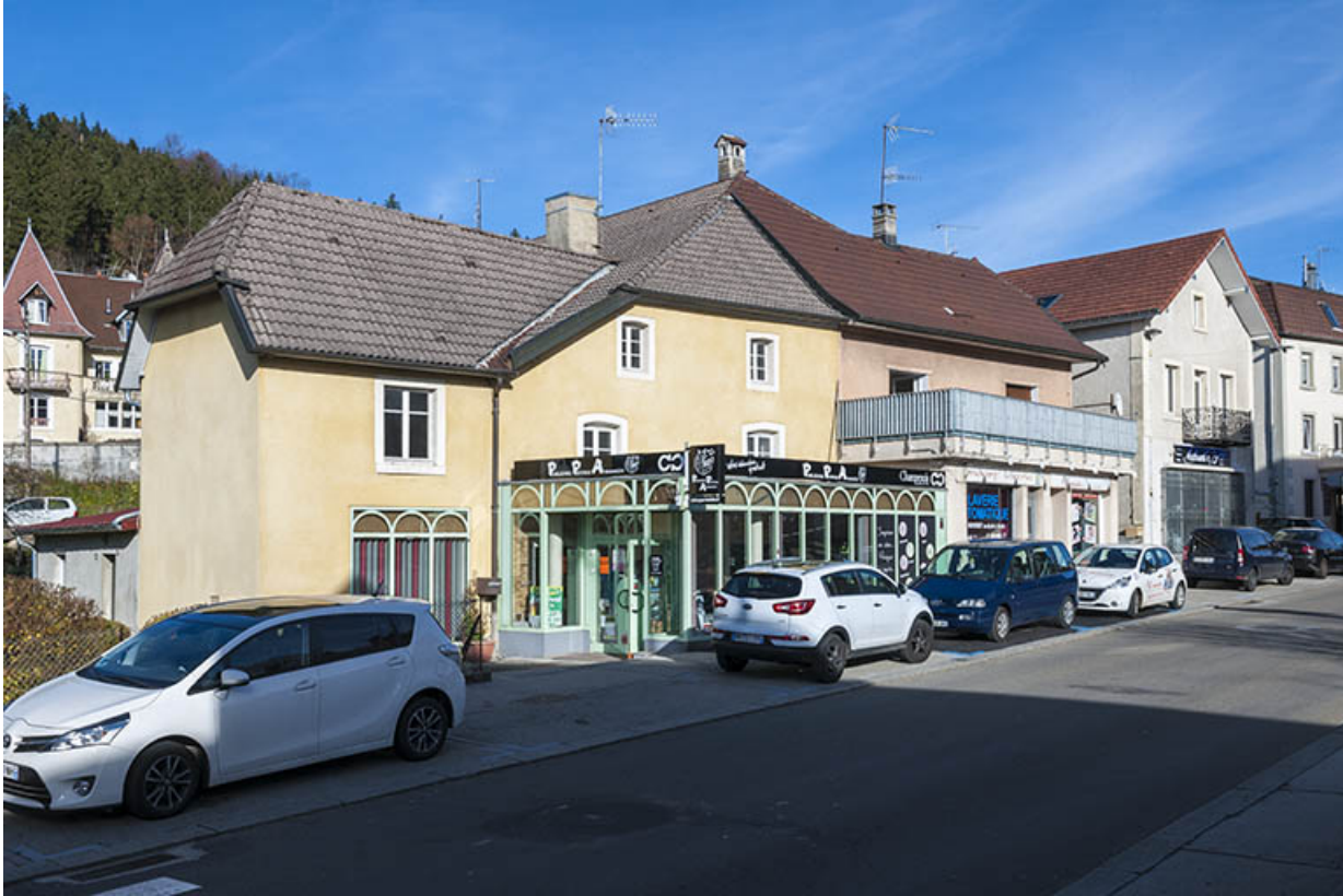
Vue d'ensemble, depuis le sud-ouest (façade antérieure).