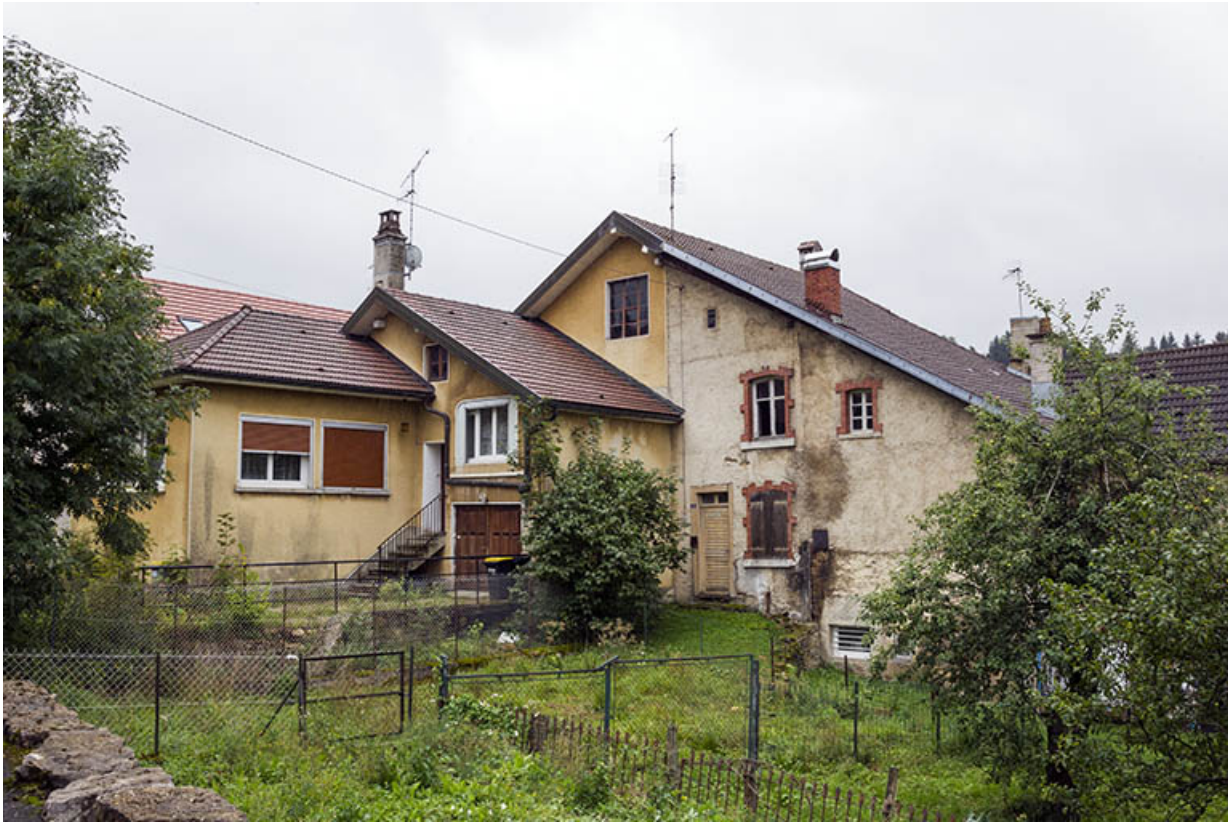
Vue d'ensemble, depuis le nord-ouest (façade postérieure).