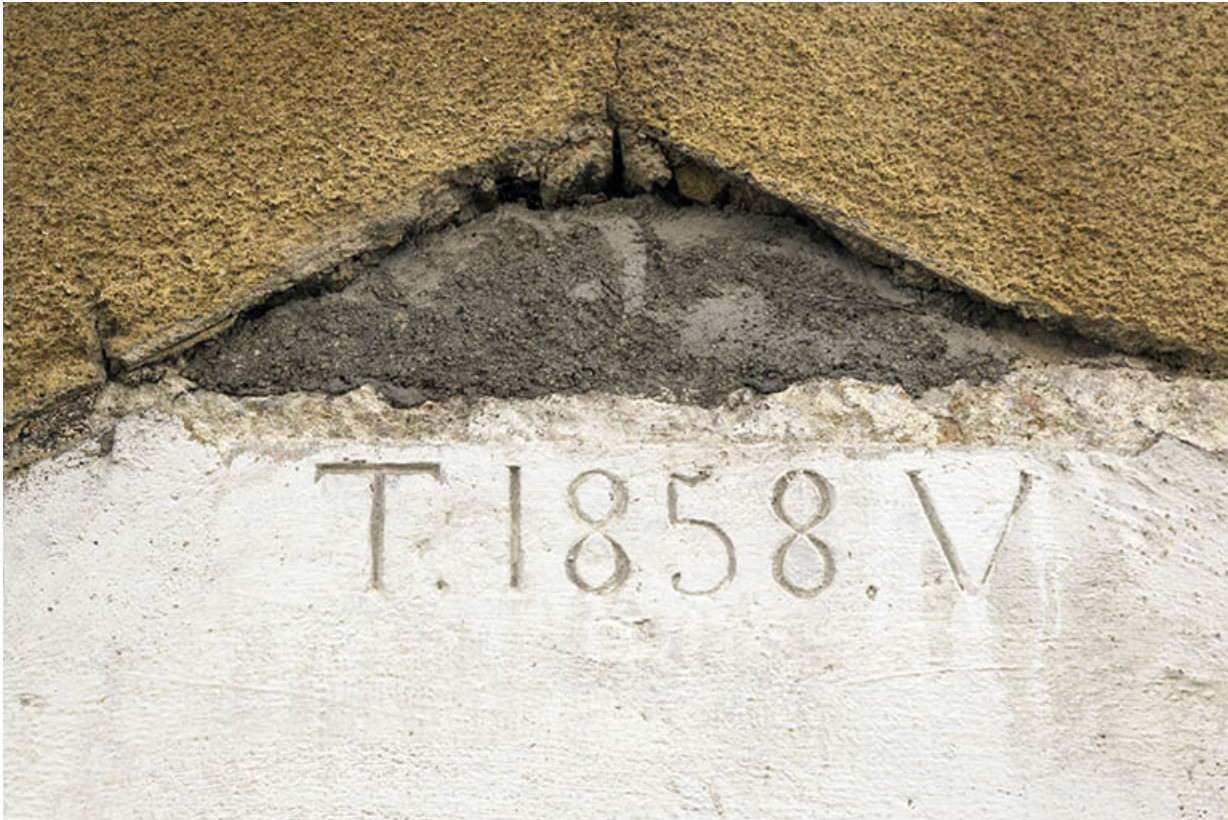
Partie au 19 rue Montalembert, façade latérale droite (orientale) : linteau daté. 25, Maîche, 17 et 19 rue Montalembert