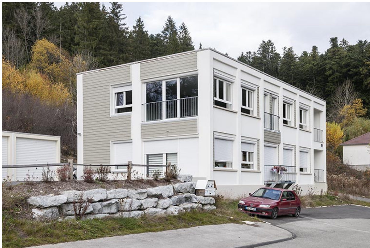
Façades antérieure et latérale gauche, après la transformation en immeuble. 25, Maîche, 13 rue Paul Monnot