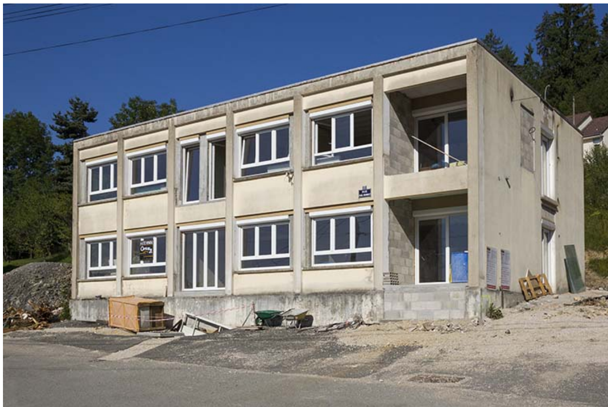
Façades antérieure et latérale droite, avant la transformation en immeuble. 25, Maîche, 13 rue Paul Monnot