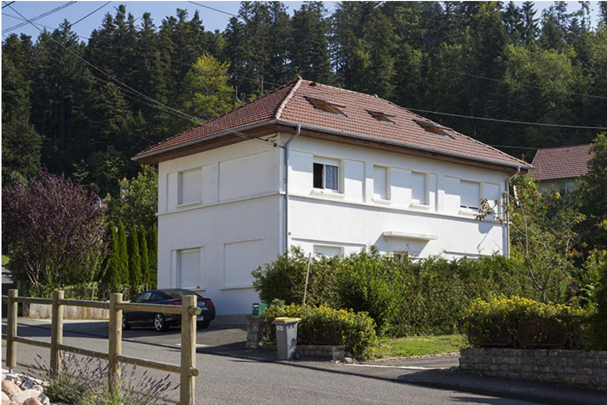
Une fabrique de montres de taille moyenne de l'après-guerre : l'usine Roch Frères (1951), au 14 rue de Goule. 25, Maîche, 14 rue de Goule