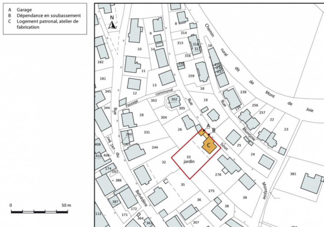
Plan-masse et de situation. Extrait du plan cadastral, 2015, section AB. 25, Maîche, 13 rue Sous Montjoie