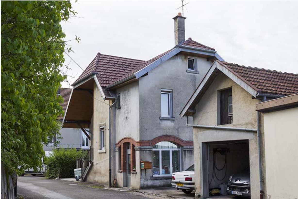
Vue d'ensemble, depuis le nord-ouest (façades antérieure et latérale droite). Garage au premier plan. 25, Maîche, 13 rue Sous Montjoie