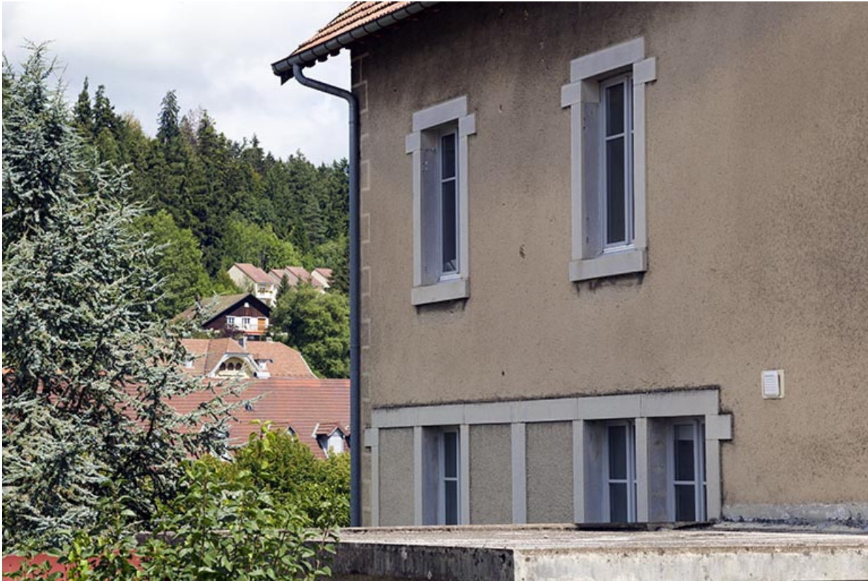
Façade latérale gauche : fenêtres multiples.