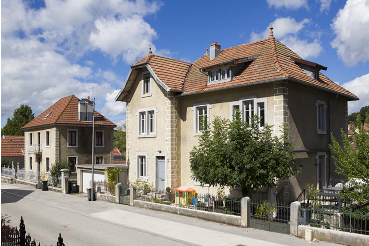
Vue d'ensemble, depuis l'est (façades antérieure et latérale droite). 25, Maîche, 13 rue de l' Helvétie