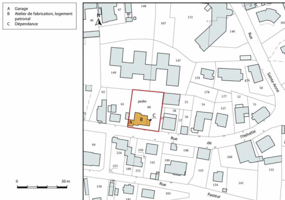
Plan-masse et de situation. Extrait du plan cadastral, 2015, section AI. 25, Maîche, 13 rue de l' Helvétie