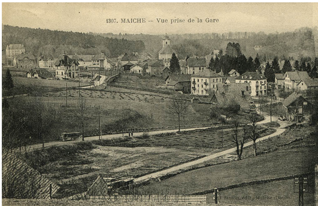
1307. Maïche - Vue prise de la gare, 1ère moitié 20e siècle (avant 1930).