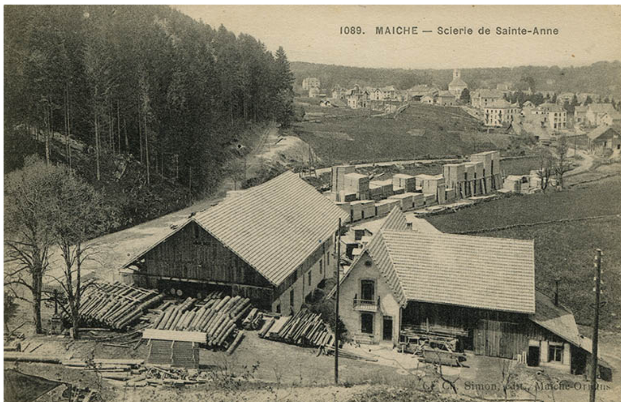
1089. Maïche - Scierie de Sainte-Anne, 1ère moitié 20e siècle (après 1911). 25, Maïche, 10 rue de la Gare