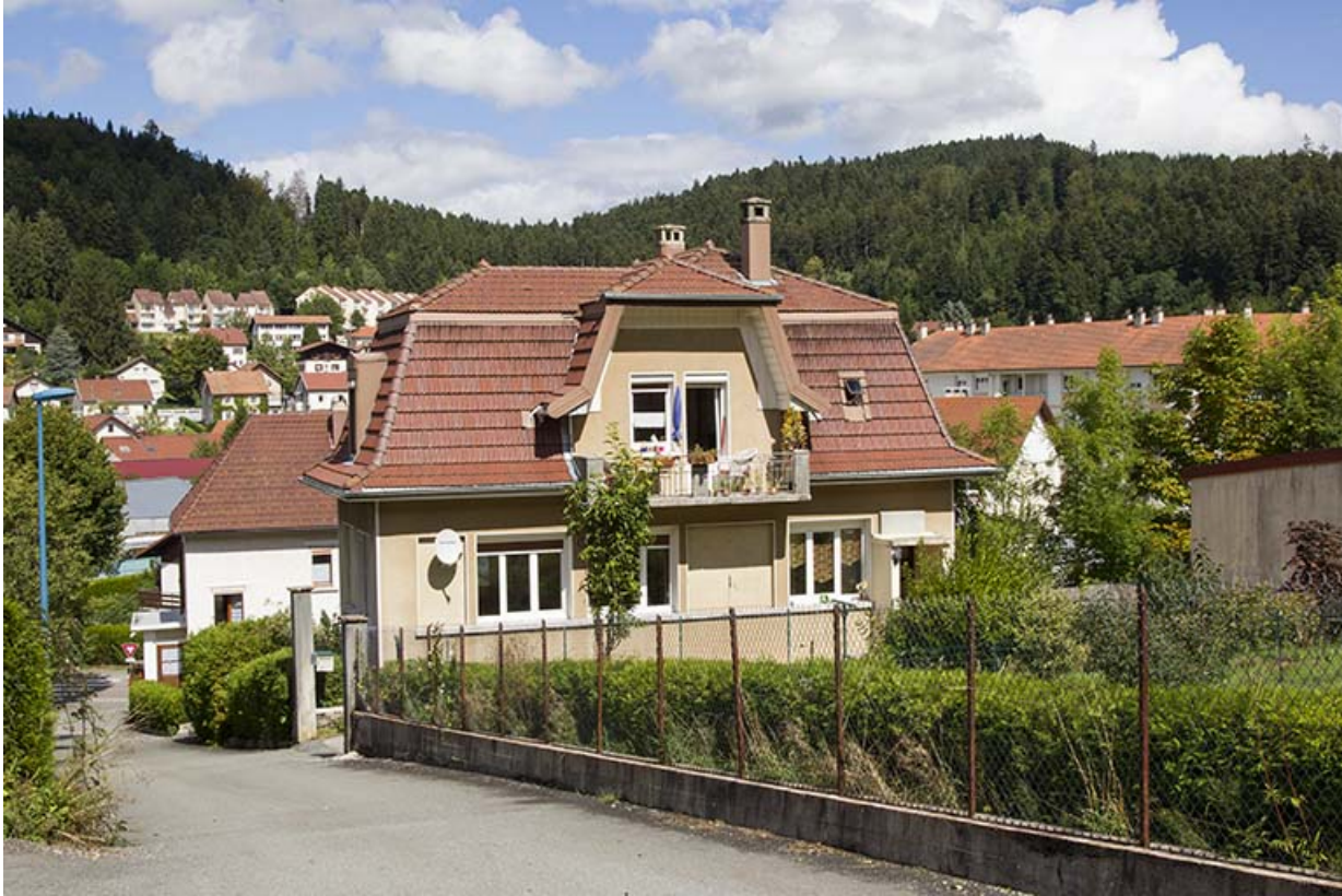
Façades postérieure et latérale droite.