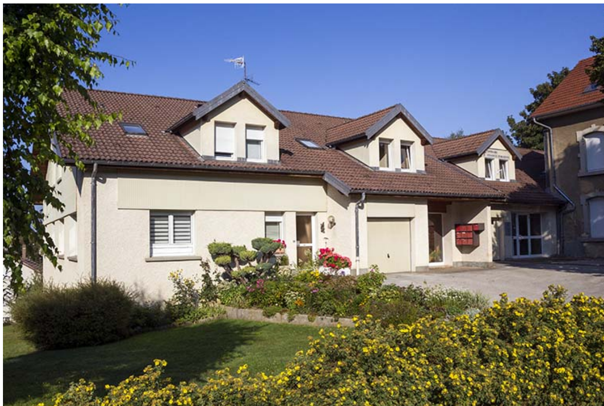
Ateliers de fabrication (immeuble à gauche et perception à droite) : façade antérieure. 25, Maîche, 8 rue de la Gare