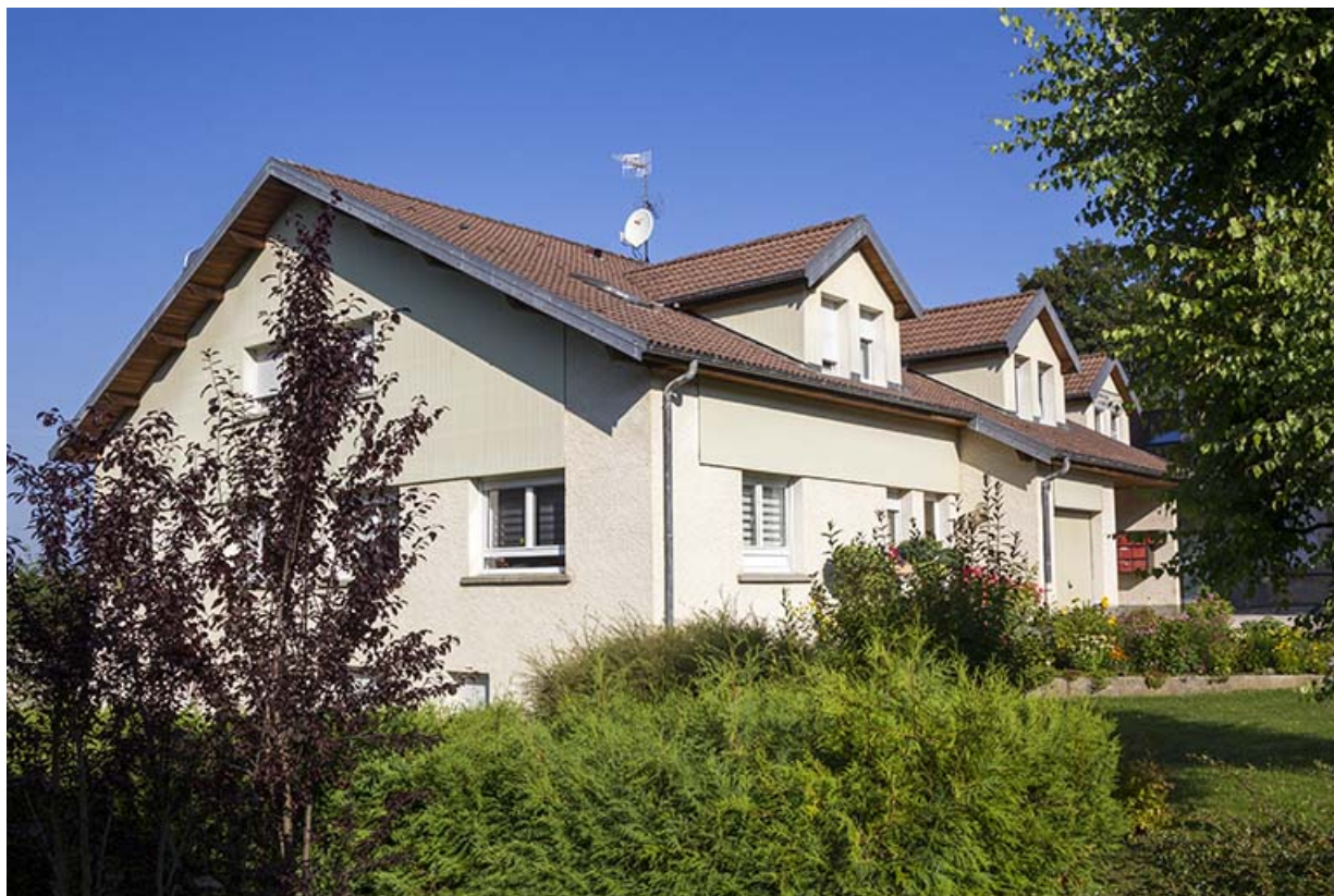
Ateliers de fabrication : façades antérieure et latérale gauche.