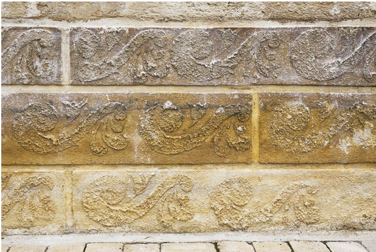
Façade antérieure : décor de l'enduit en partie basse.