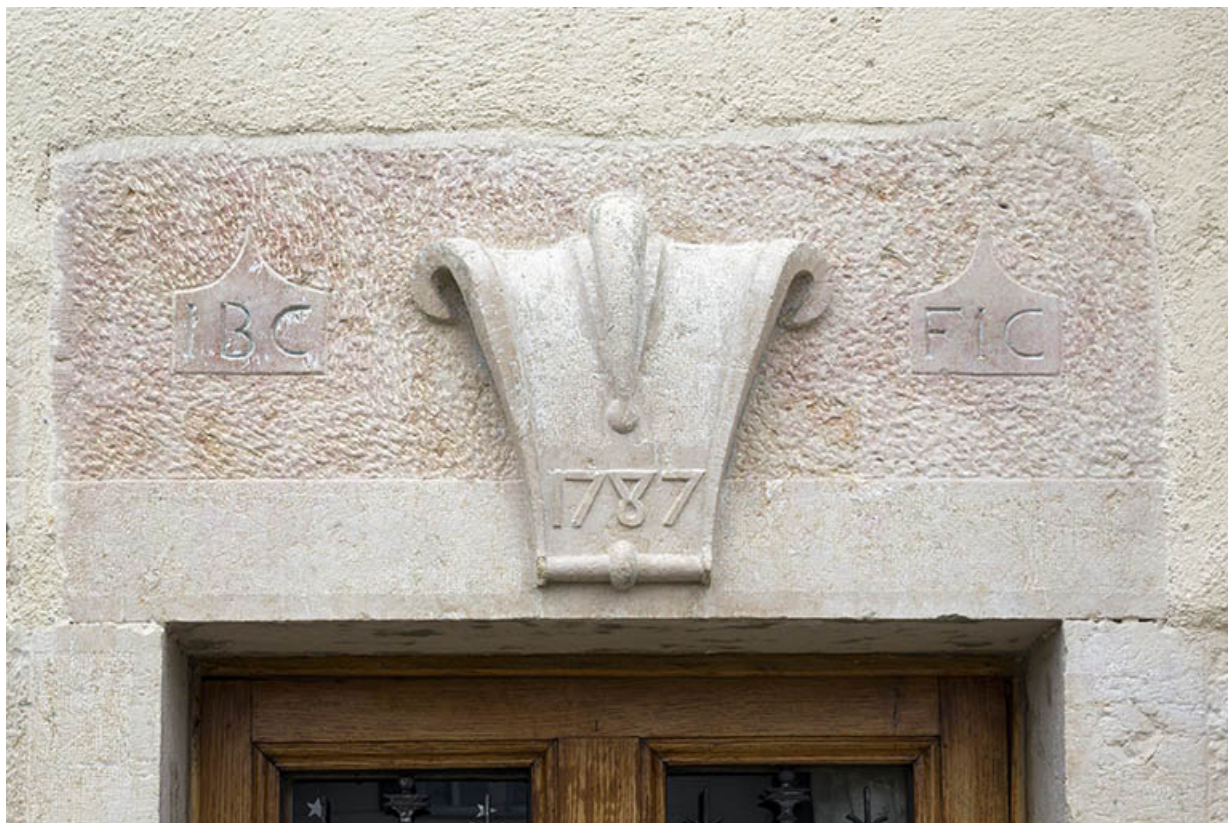
Façade antérieure : linteau orné et daté de la porte de droite.