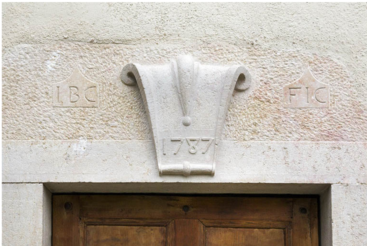
Façade antérieure : linteau orné et daté de la porte de gauche.