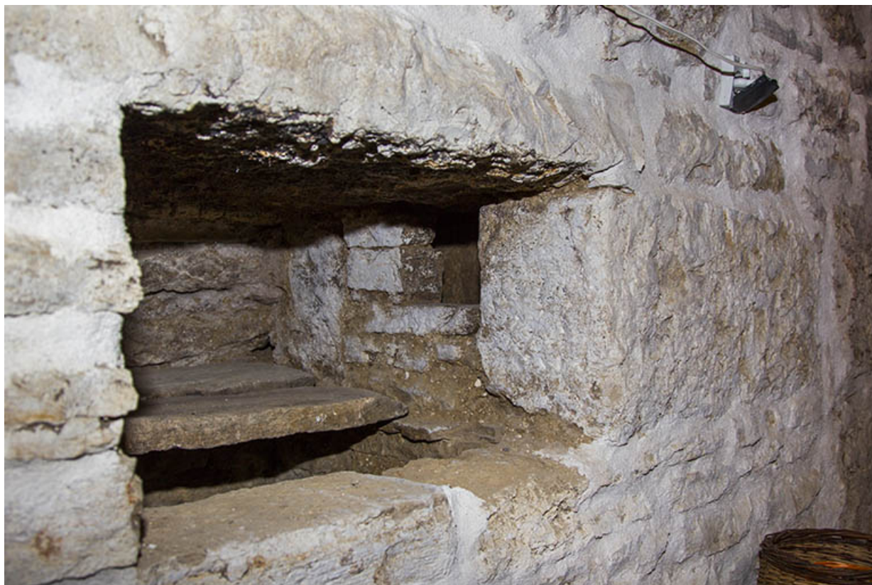
Cellier : niche dans le mur et sa cache.