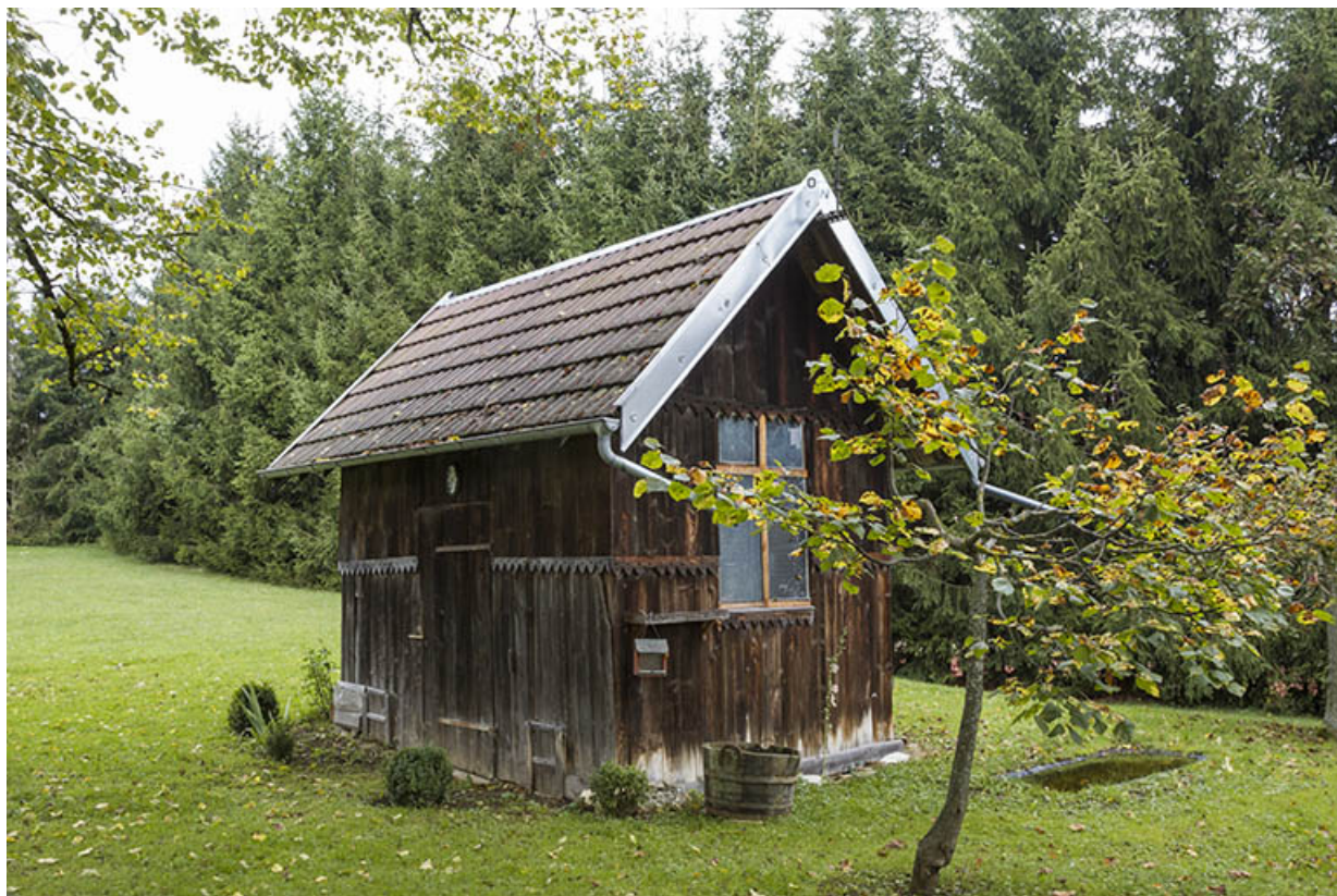
Poulailler, de trois quarts gauche.