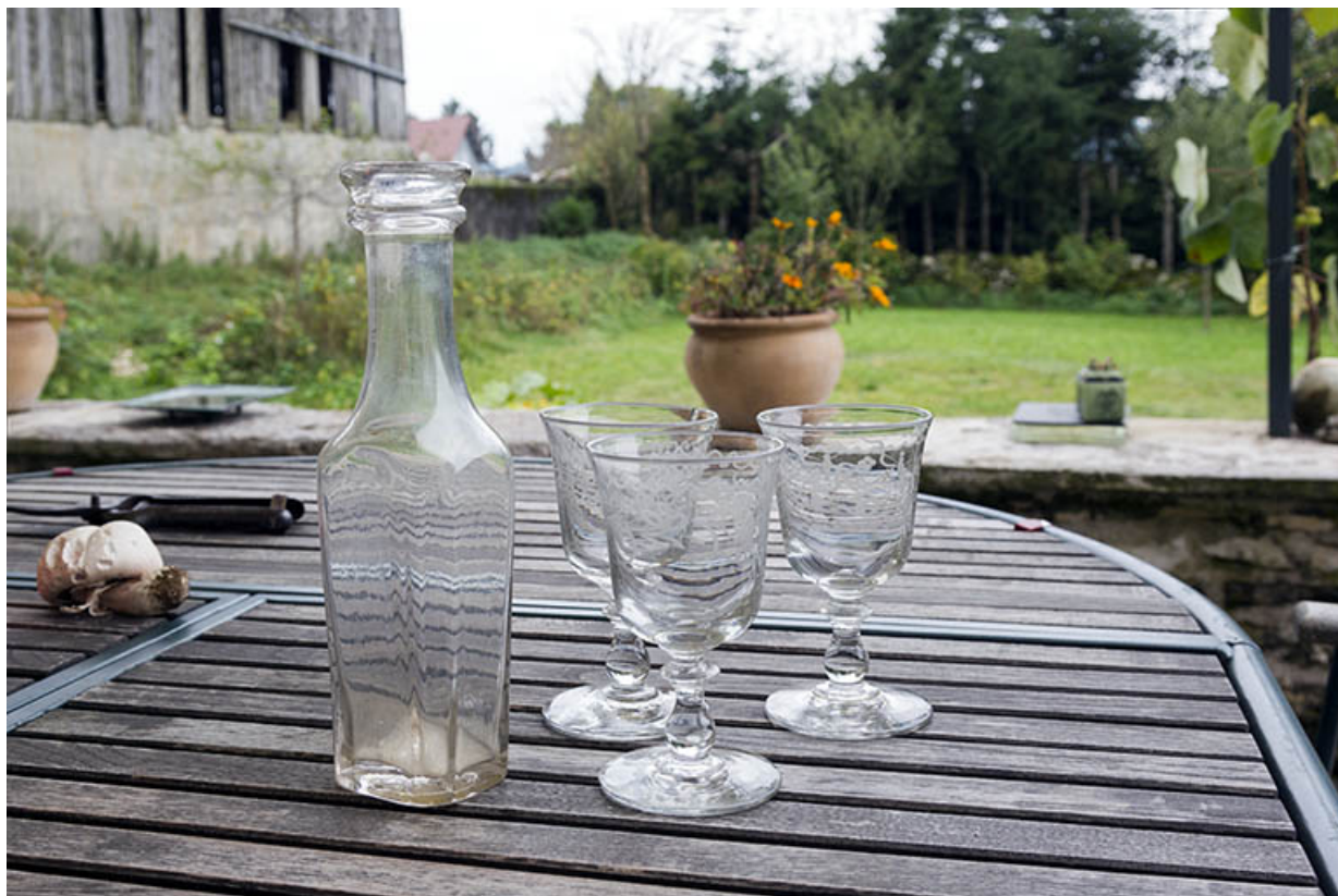
Bouteille et verres à pied réputés provenir de la verrerie du Bief d'Etoz (commune de Charmauvillers).