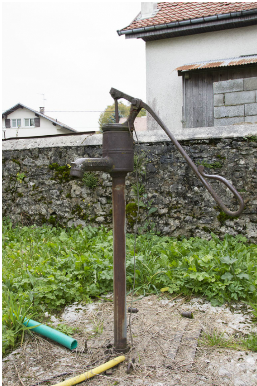
Pompe à eau Renaud, des Fontenelles.