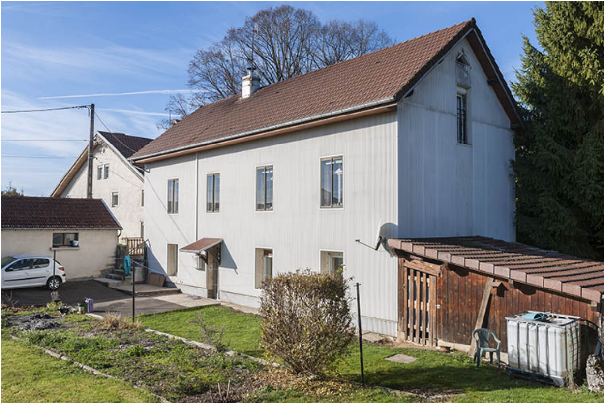
Atelier de fabrication (au n° 6), de trois quarts droite.