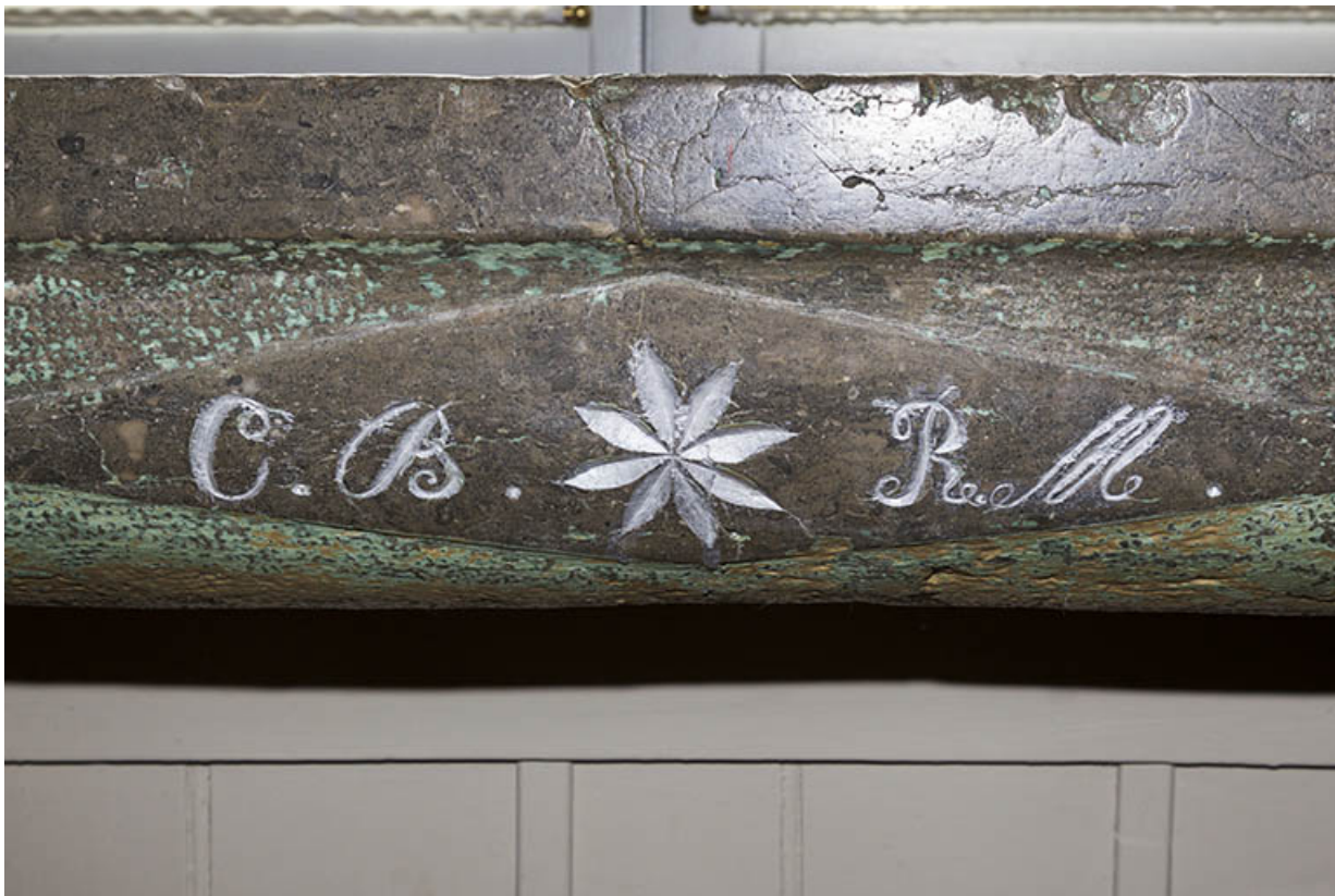
Pierre d'évier : initiales et rosace.