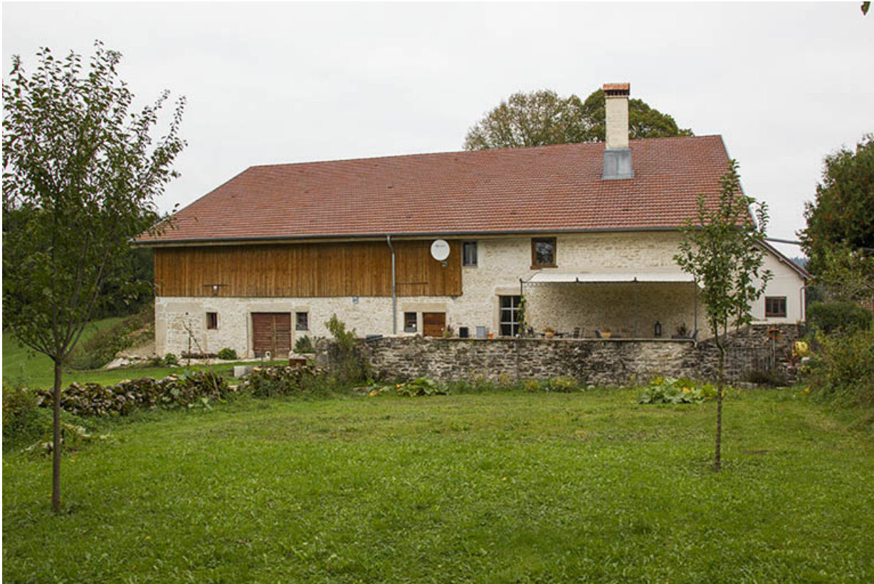
Façade latérale gauche.