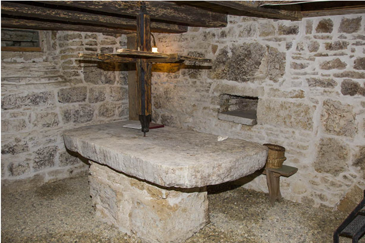
Cellier avec son "tablard".