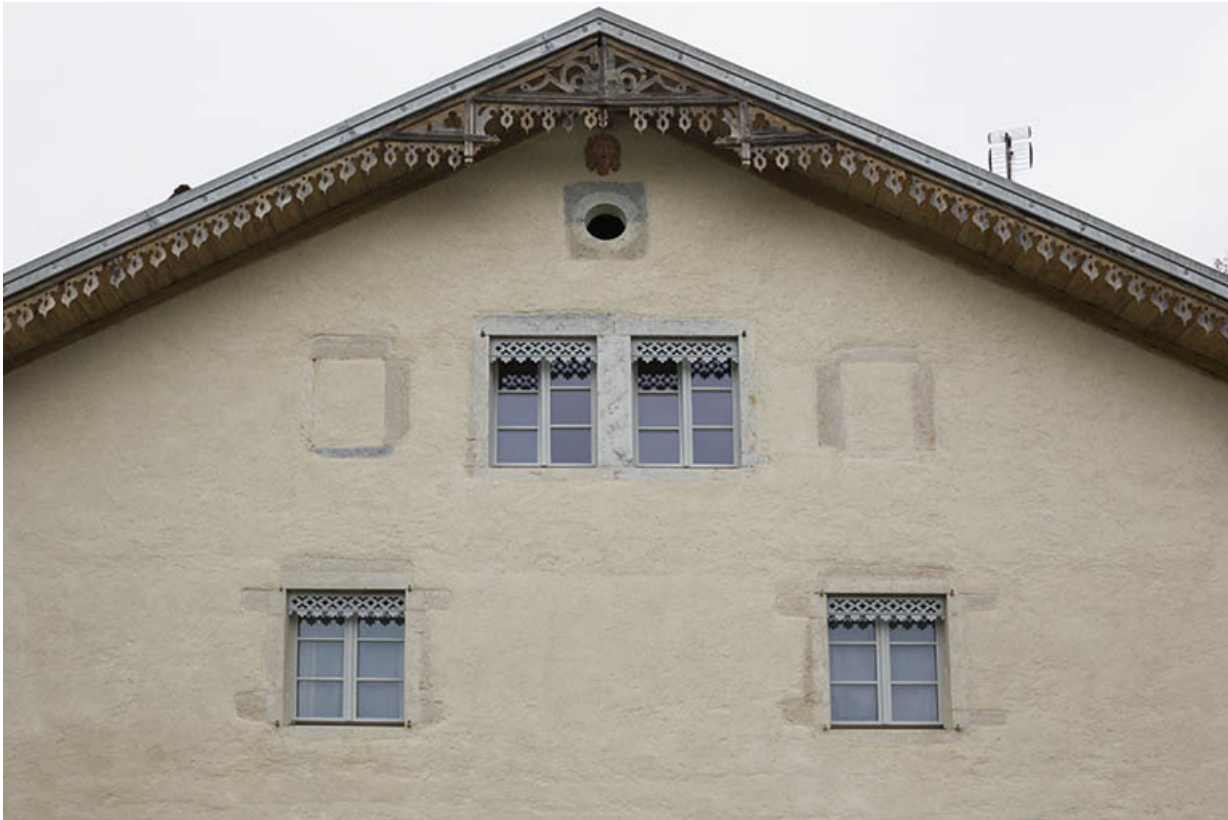
Façade antérieure : fenêtres horlogères du 1er étage de comble.