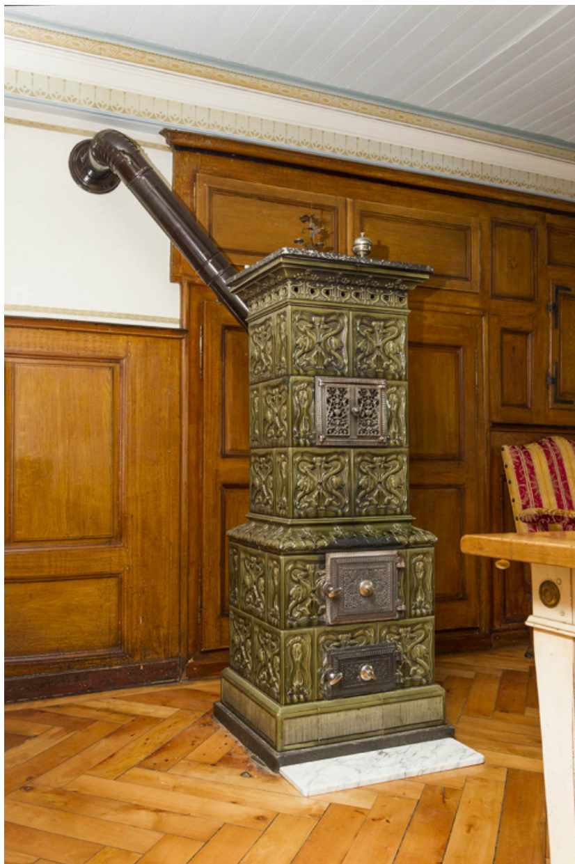
Poêle en carreaux de faïence.