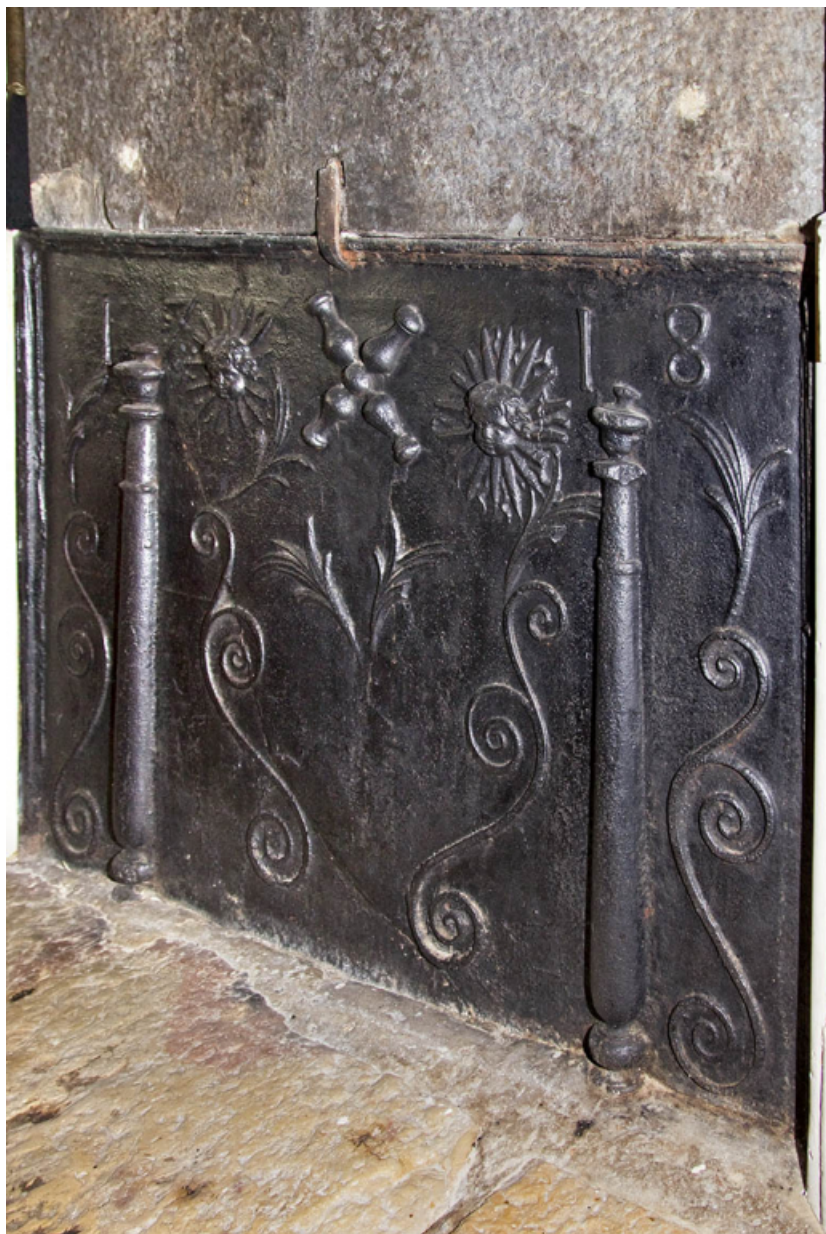
Plaque de cheminée datée 1718.