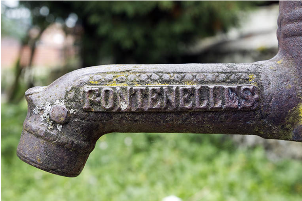
Pompe à eau Renaud : inscription localisant le fabricant aux Fontenelles.