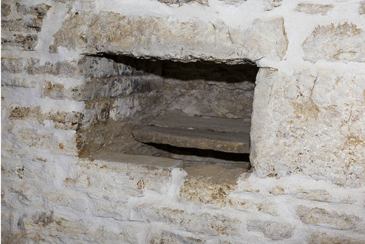
Cellier : niche dans le mur et sa cache.