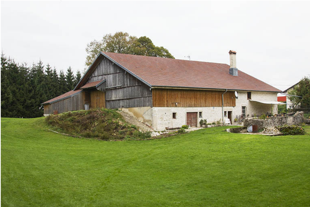
Ferme (au n° 8) : vue d'ensemble, depuis l'ouest (façades postérieure et latérale gauche). 25, Maîche, 6 et 8 rue des Combes