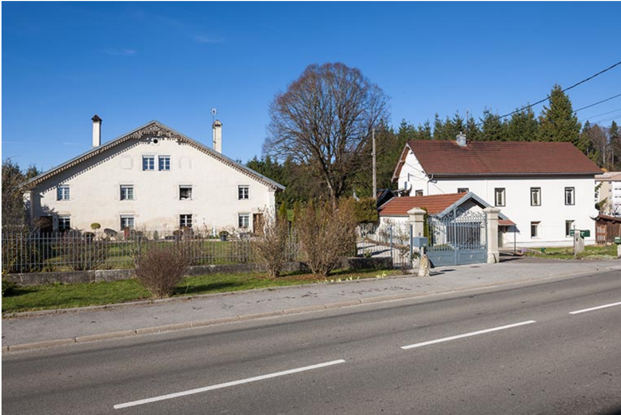
Vue d'ensemble, depuis la rue des Combes à l'est : ferme à gauche (au n° 8), atelier de fabrication à droite (au n° 6). 25, Maîche