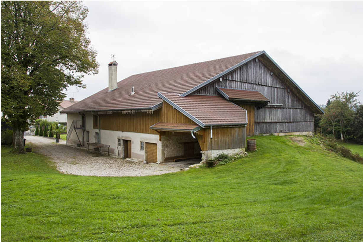
Ferme (au n° 8) : vue d'ensemble, depuis le nord (façades postérieure et latérale droite). 25, Maîche, 6 et 8 rue des Combes