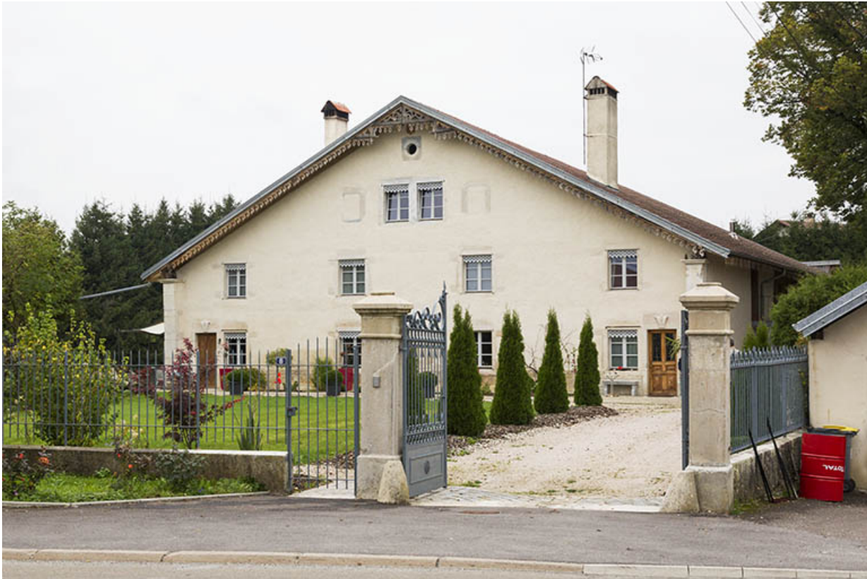
Ferme (au n° 8) : vue d'ensemble, depuis l'est (façade antérieure). 25, Maîche, 6 et 8 rue des Combes