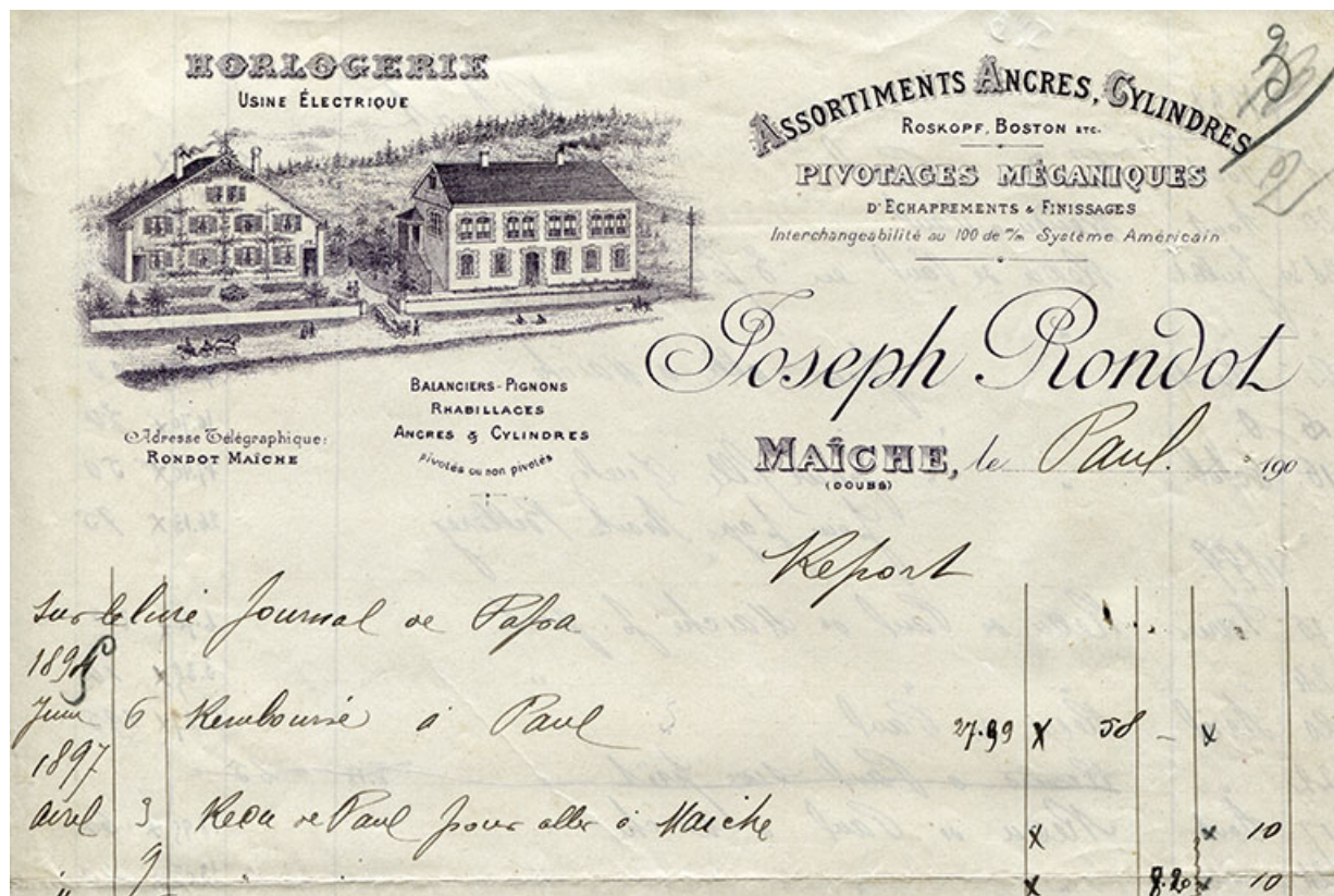
Papier à en-tête de la société Joseph Rondot, décennie 1900. 25, Maîche, 6 et 8 rue des Combes