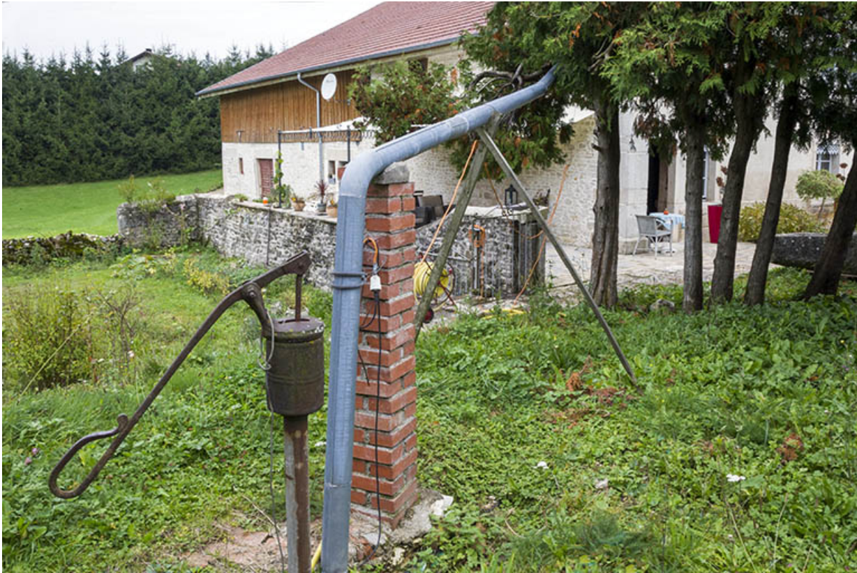
Citerne, pompe et tuyau d'amenée d'eau.