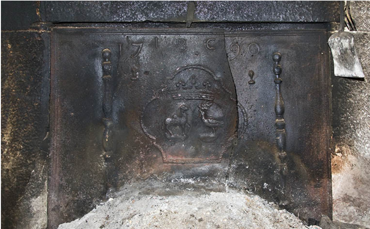
Plaque de cheminée datée 1790.