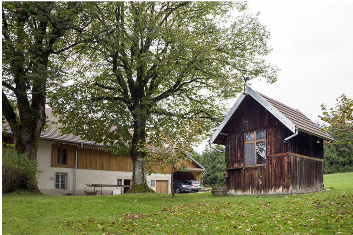
Poulailler : vue d'ensemble.