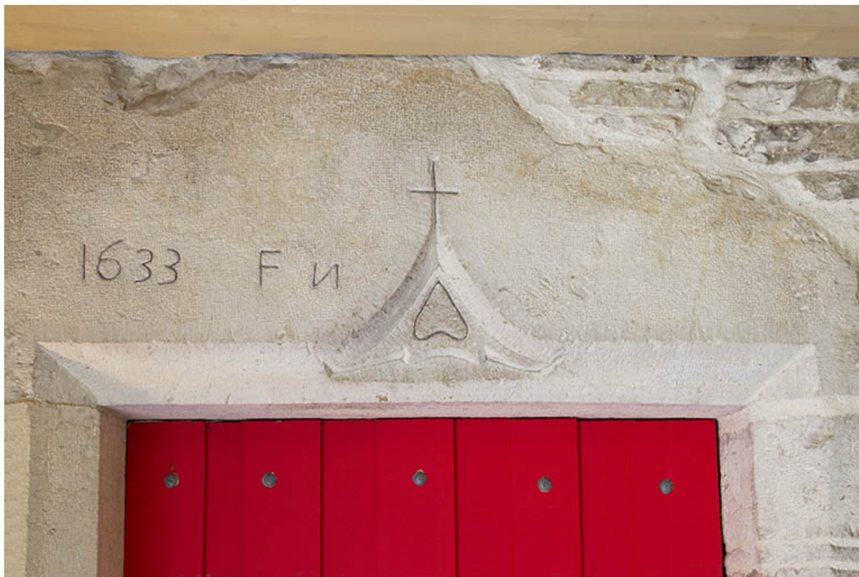
Linteau portant la date 1633, intégré au bâtiment.