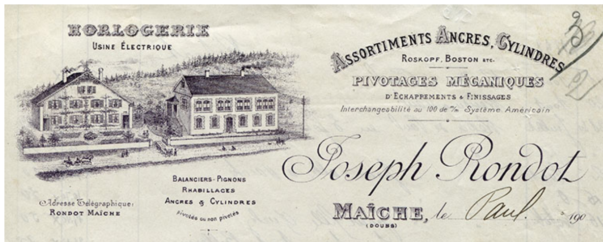
Papier à en-tête de la société Joseph Rondot [détail], décennie 1900 25, Maïche