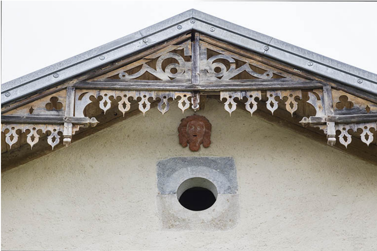
Façade antérieure : lambrequin et oculus du 2e étage de comble.