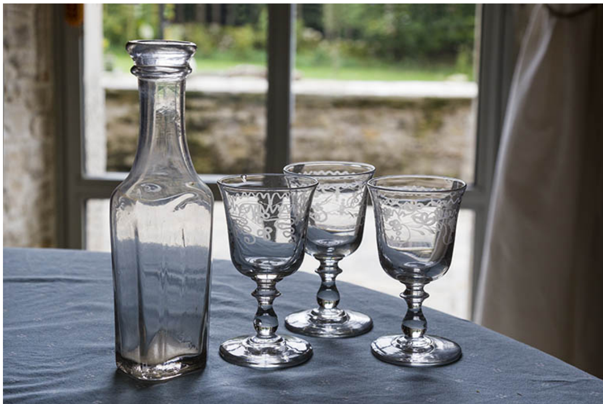
Bouteille et verres à pied réputés provenir de la verrerie du Bief d'Etoz (commune de Charmauvillers).