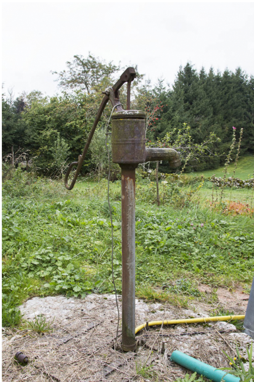
Pompe à eau Renaud, des Fontenelles.