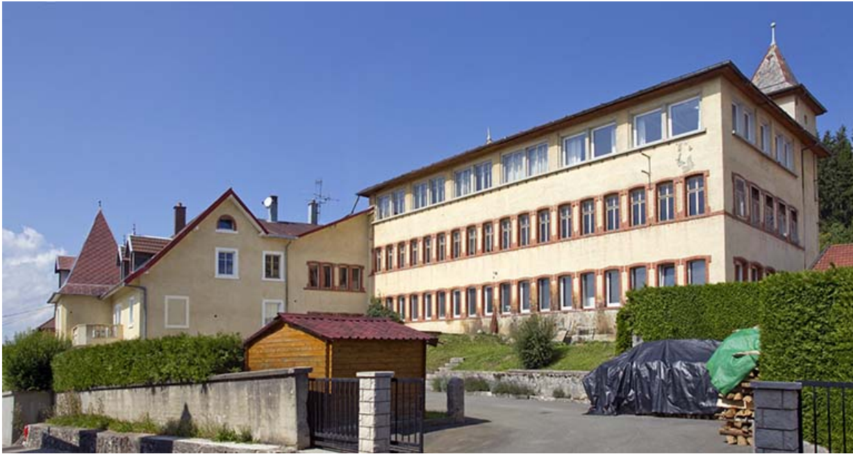
Vue d'ensemble, depuis la rue du Mont à l'est. 25, Maïche, 7-9 rue du Mont