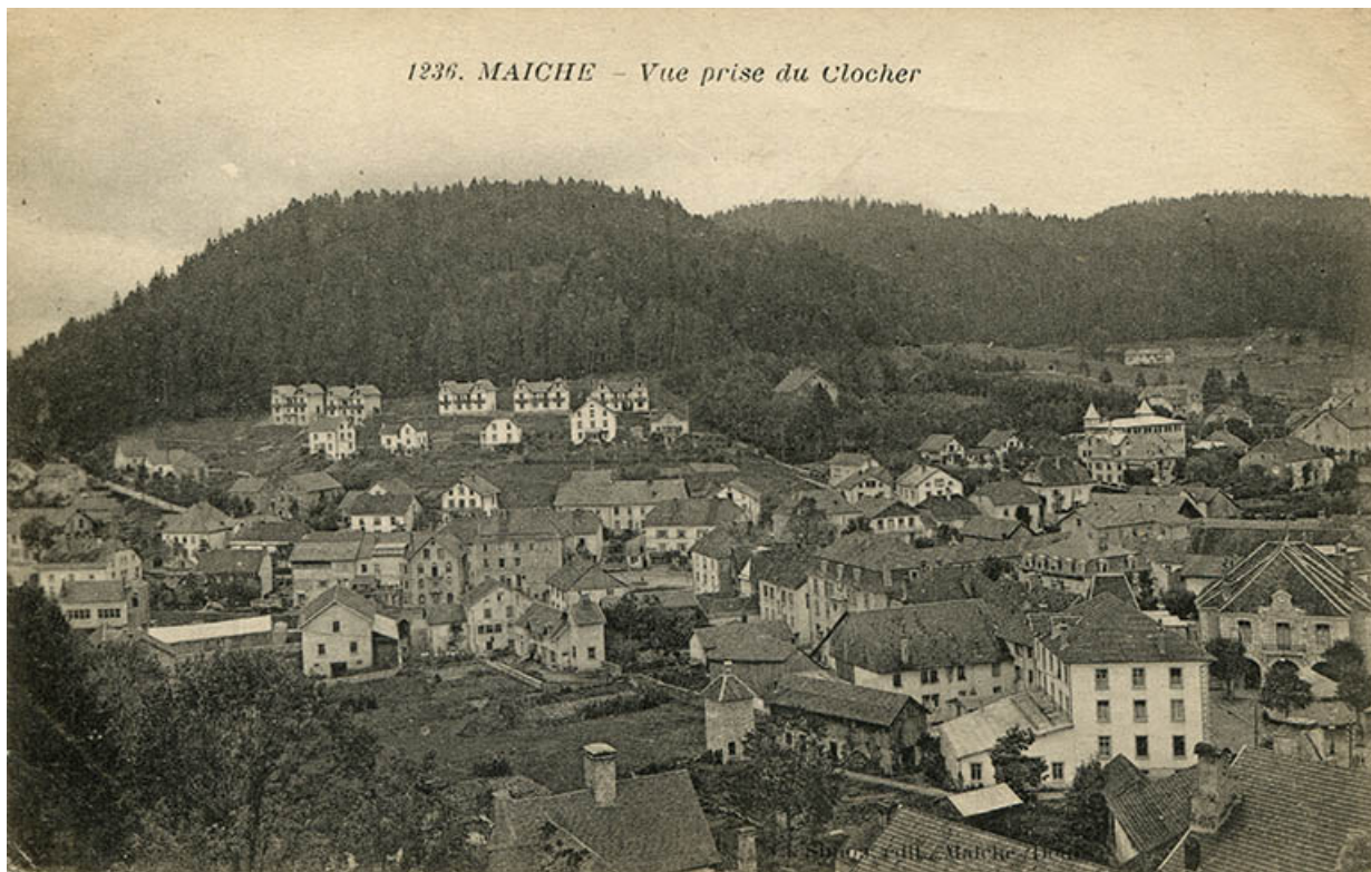
1236. Maïche - Vue prise du clocher [centre du village et quartier de Montjoie], 2e quart 20e siècle. 25, Maïche

1236. Maïche - Vue prise du clocher [centre du village et quartier de Montjoie], carte postale, par Ch. Simon, s.d. [2e quart 20e siècle], Ch. Simon éd. à Maïche. Publiée dans : Simonin, Michel ; Choulet, Jean-Marie. Maïche hier et aujourd'hui. - Maïche : Jardins de Mémoire, 1999, p. 34.