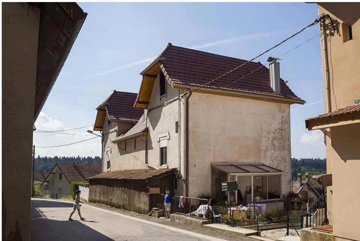
Immeuble n° 6 : façades nord et est (côté rue).