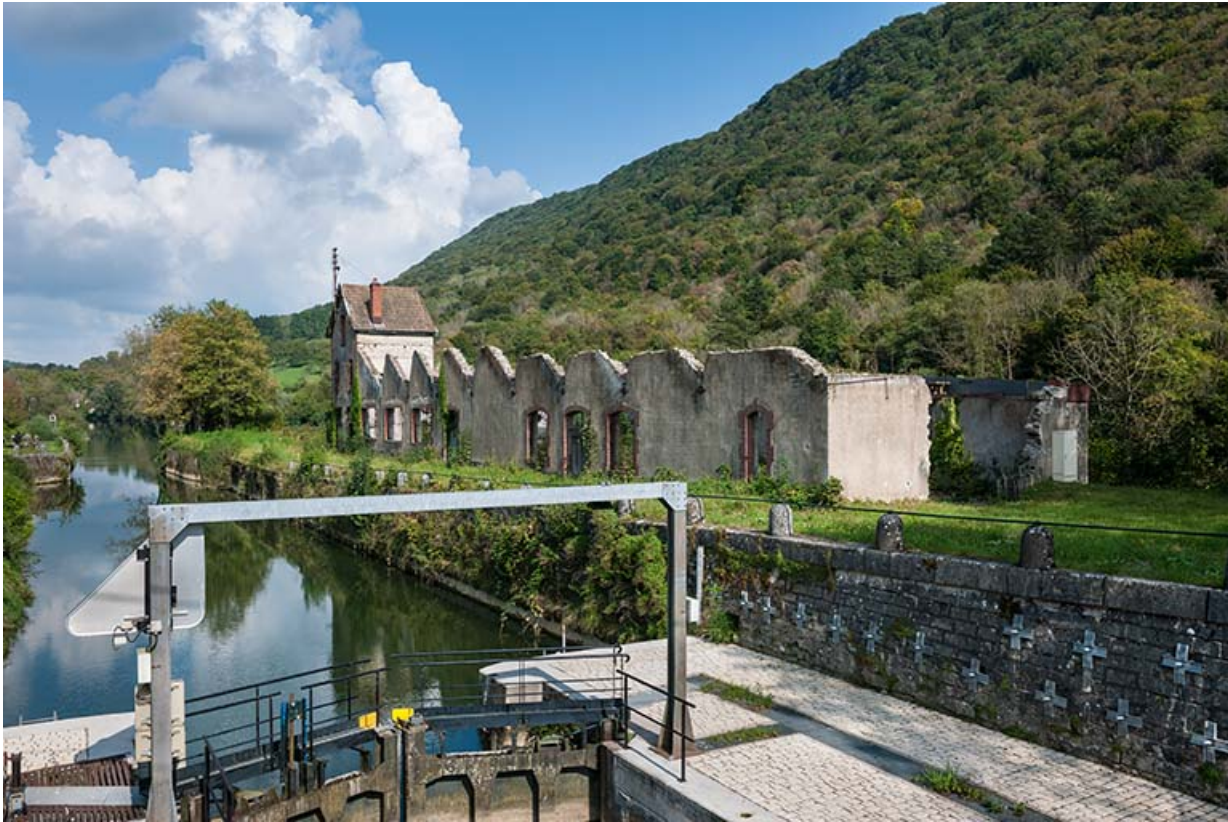
Vue d'ensemble depuis la porte aval de l'écluse.

25, Ougney-Douvot RD 277, lieudit : Douvot