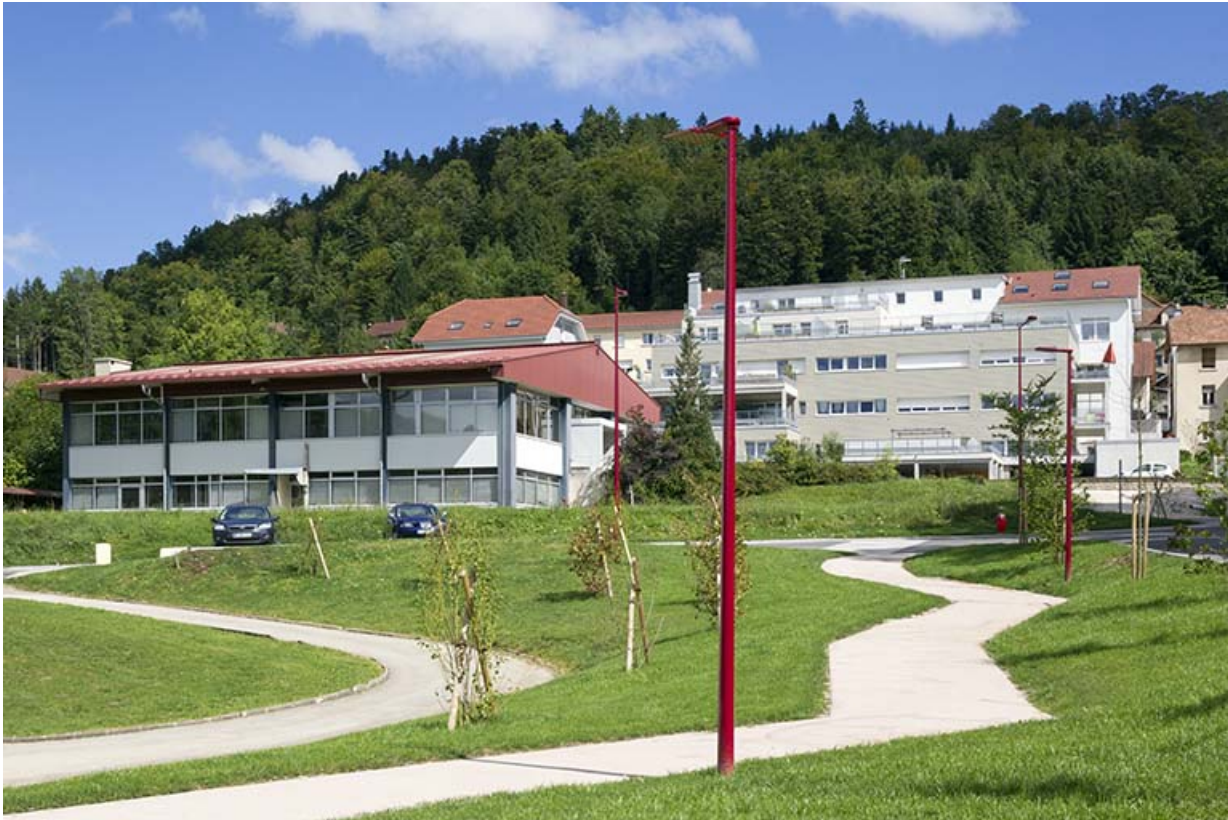
Vue d'ensemble, depuis le sud-ouest.