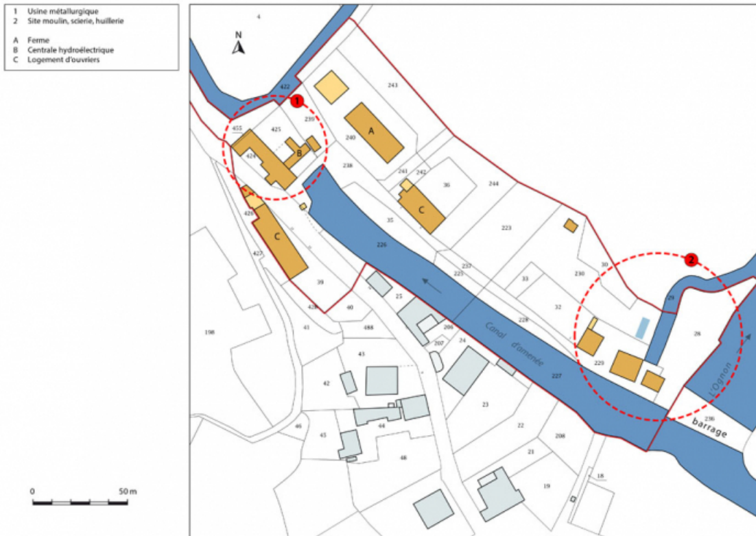
Plan-masse et de situation. Extrait du plan cadastral, 2016, section D. 25, Monclay rue du Moulin