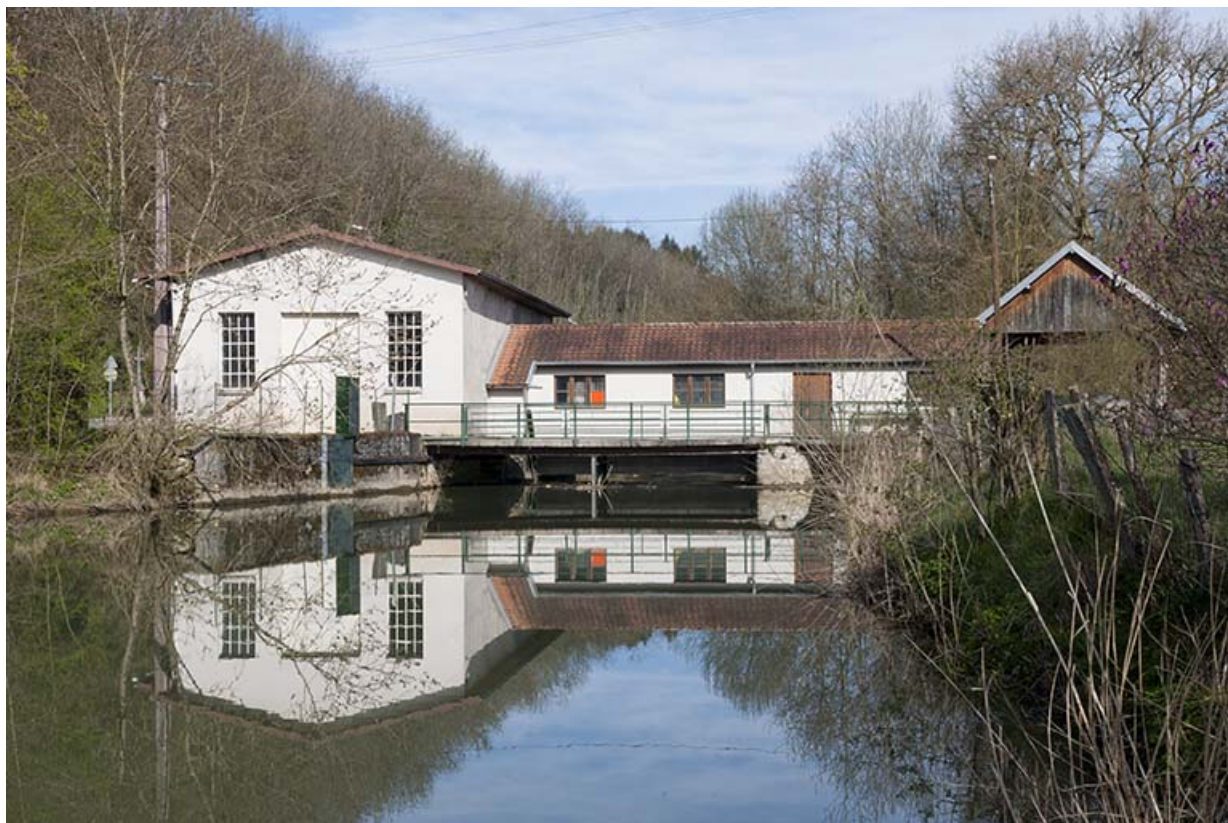
Vue d'ensemble depuis l'amont du bief de dérivation. 25, Moncley rue du Moulin