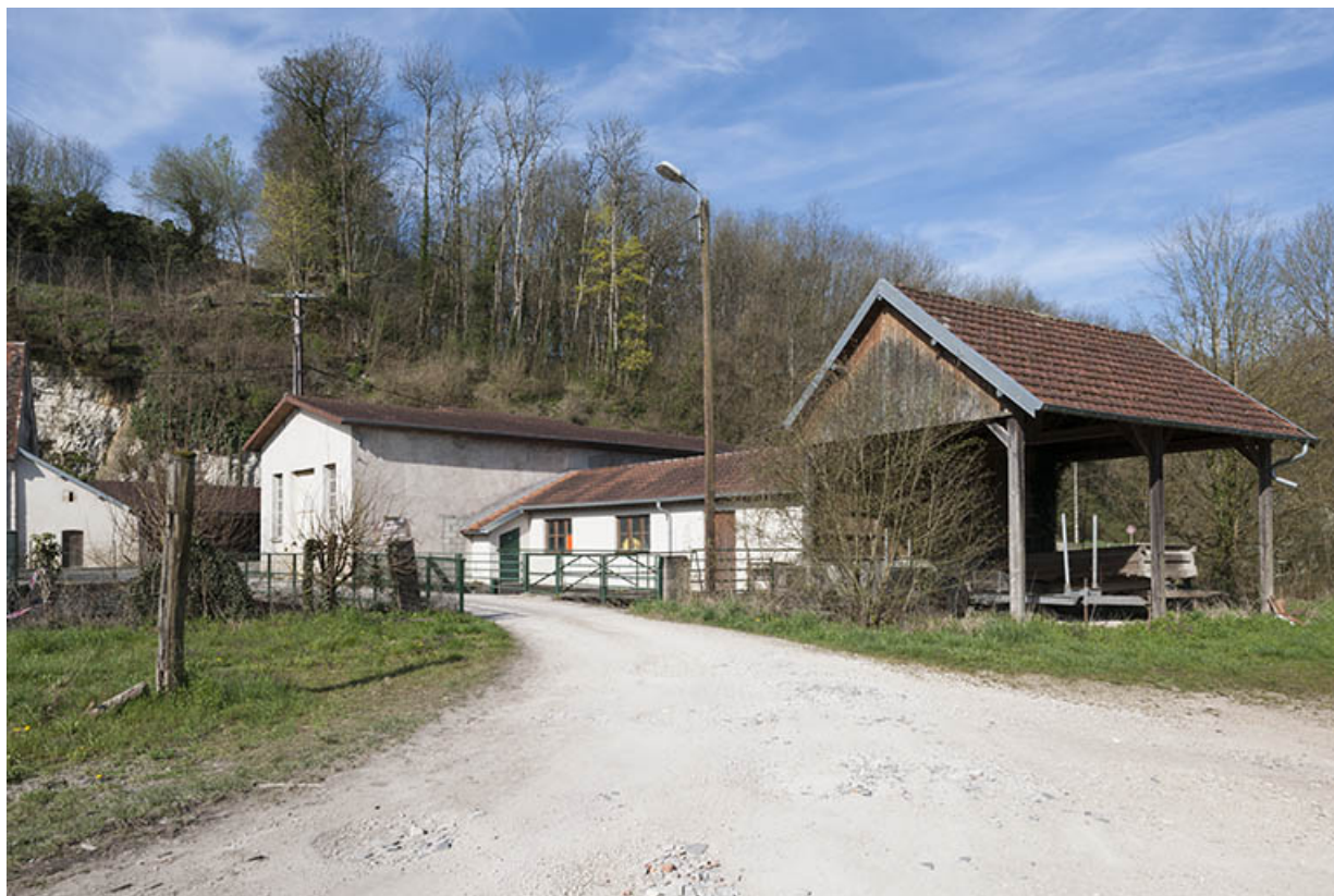
Vue depuis l'est.