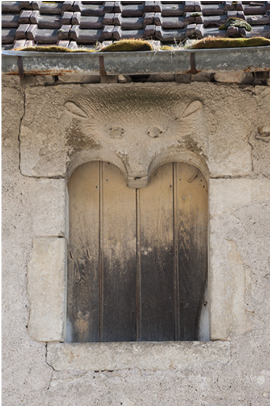
Détail d'une fenêtre du premier étage. 25, Monclay rue du Moulin