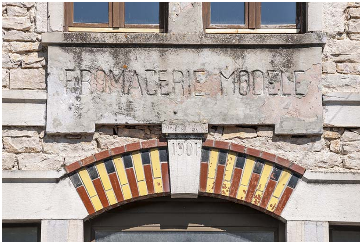
Façade sud. Inscription sur le pignon.