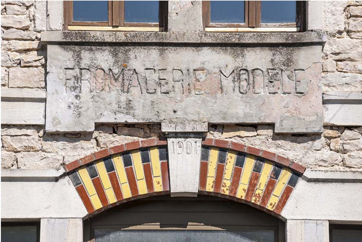
Façade sud. Inscription sur le pignon.