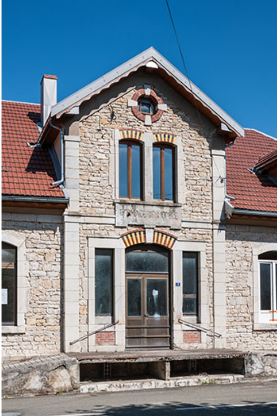
Elévation du pignon central.