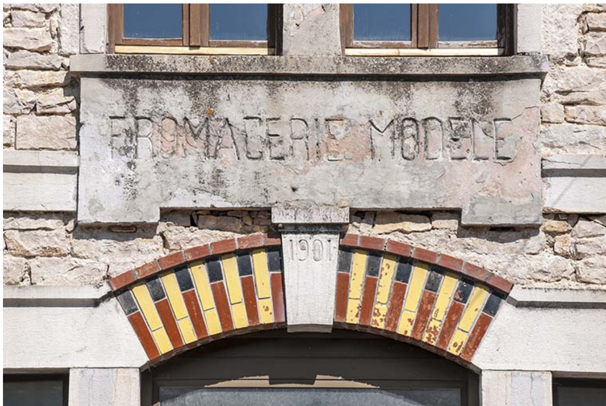
Façade sud. Inscription sur le pignon.