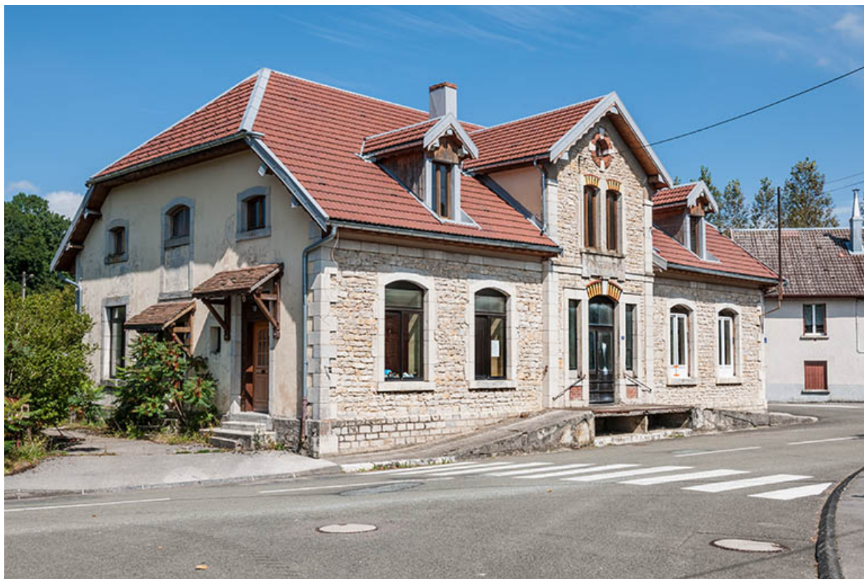
Vue de trois quarts gauche. 25, Vanclans, 8 Grande Rue