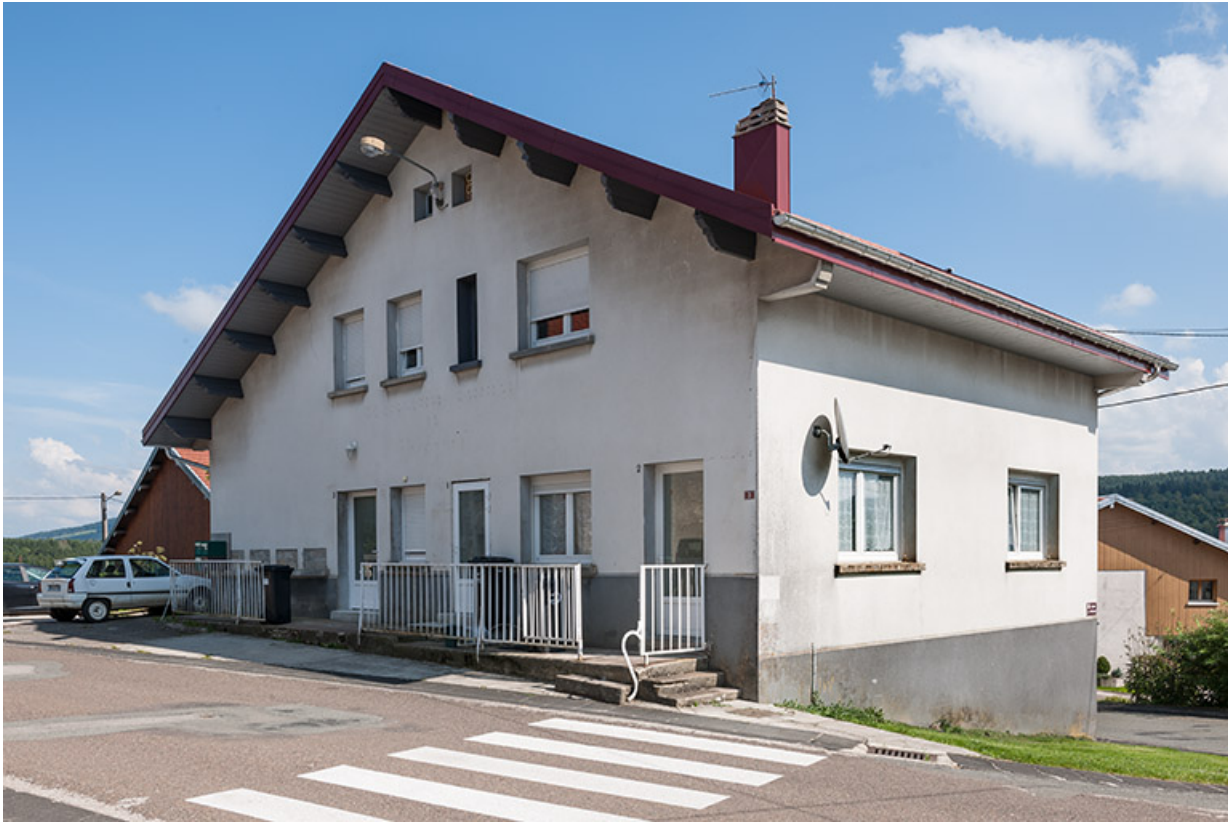
Nouvelle fromagerie (1963) vue de trois quarts droite.