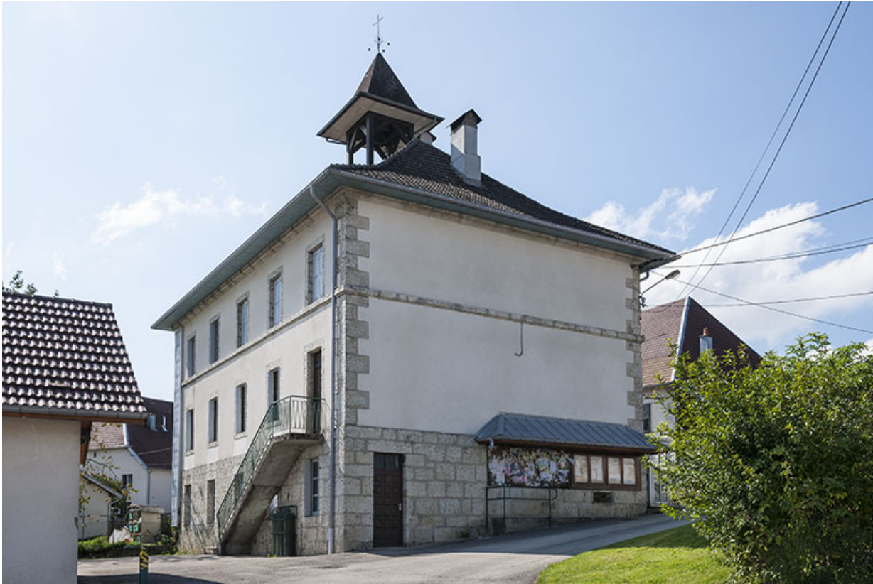
Vue de trois quarts arrière.