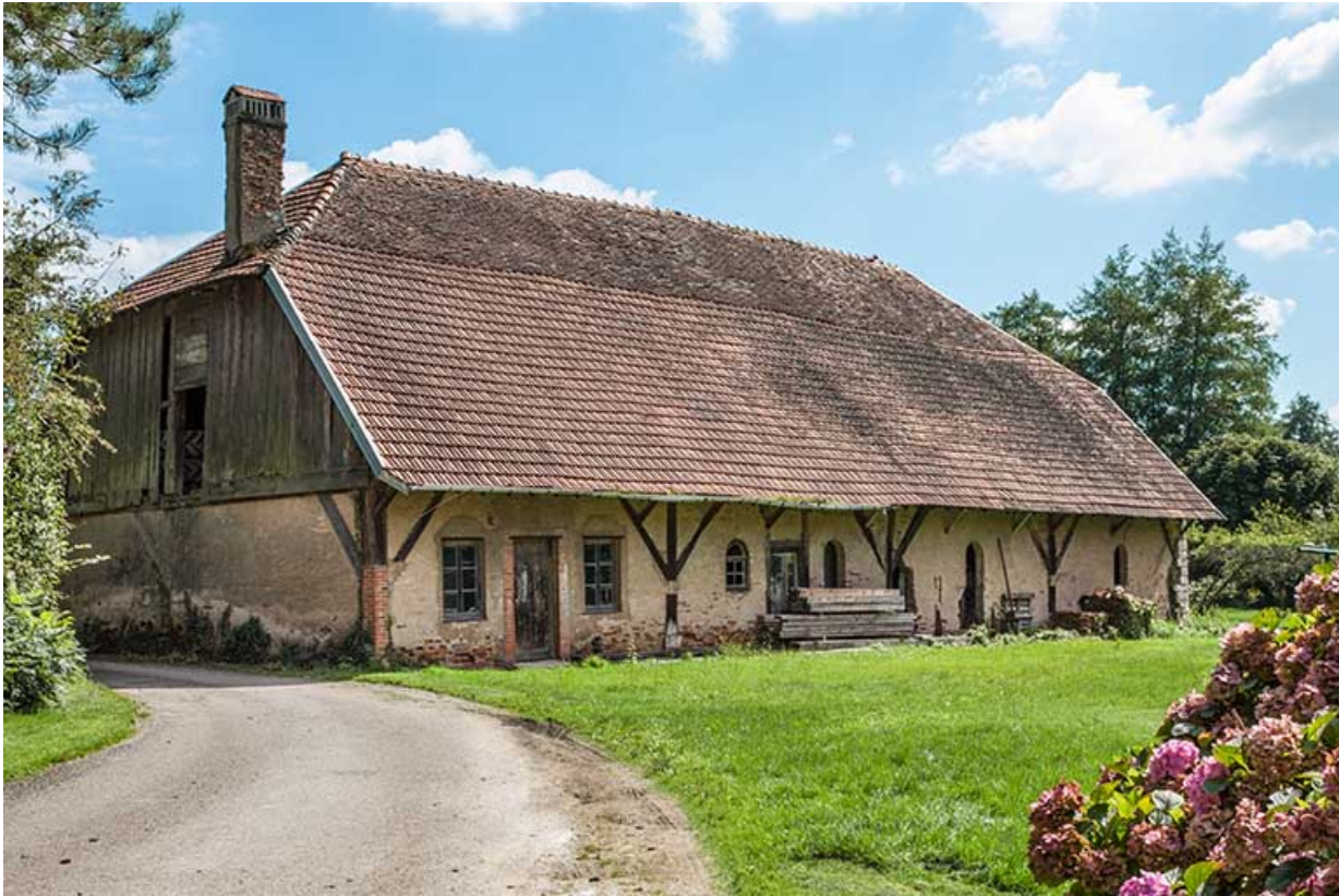
Magasin industriel depuis le nord-ouest.

25, Montagney-Servigney rue du Haut fourneau