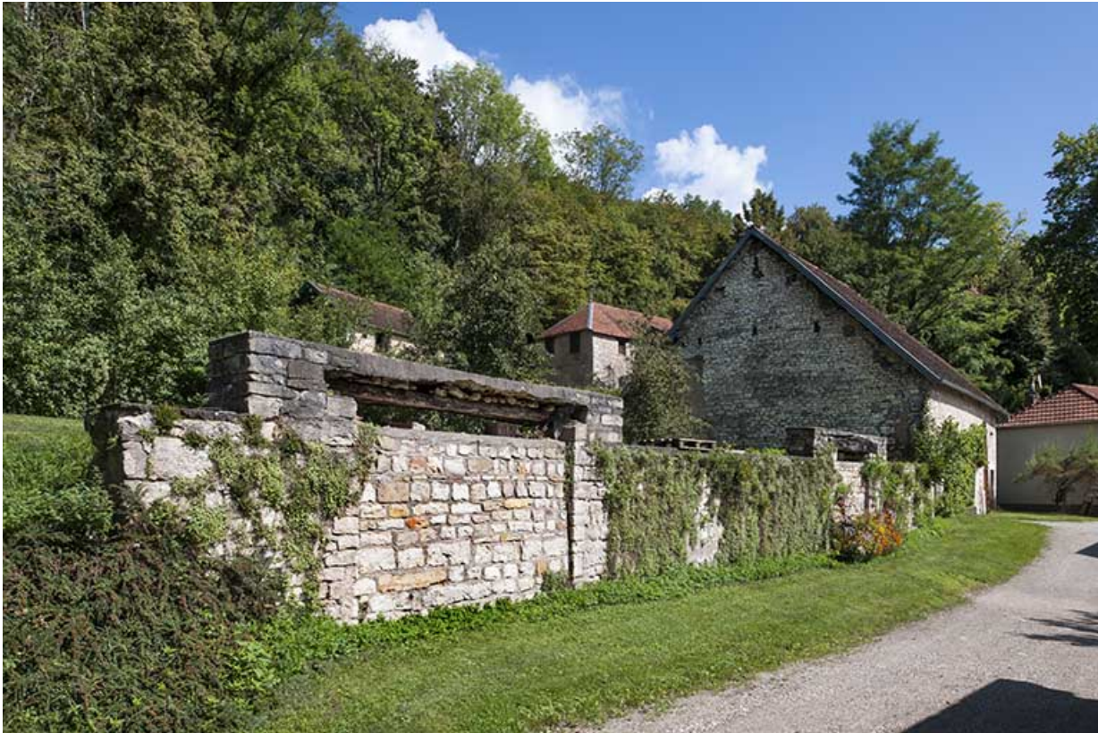
Vestiges de la halle à charbon (premier plan) et bâtiment agricole.

25, Montagney-Servigney rue du Haut fourneau