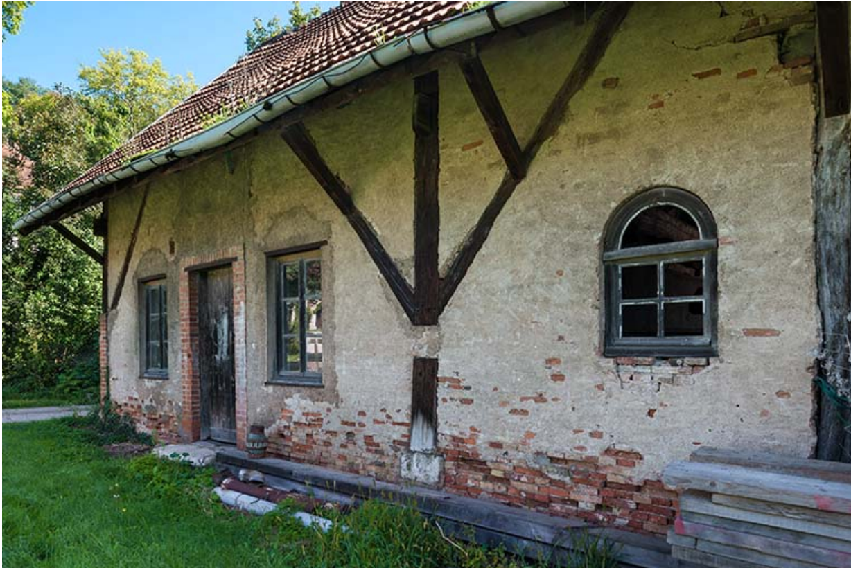
Détail de la façade ouest du magasin.

25, Montagney-Servigney rue du Haut fourneau