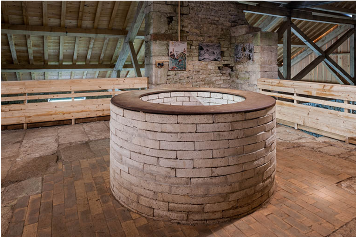
Gueulard (reconstitué) du haut fourneau.

25, Montagney-Servigney rue du Haut fourneau