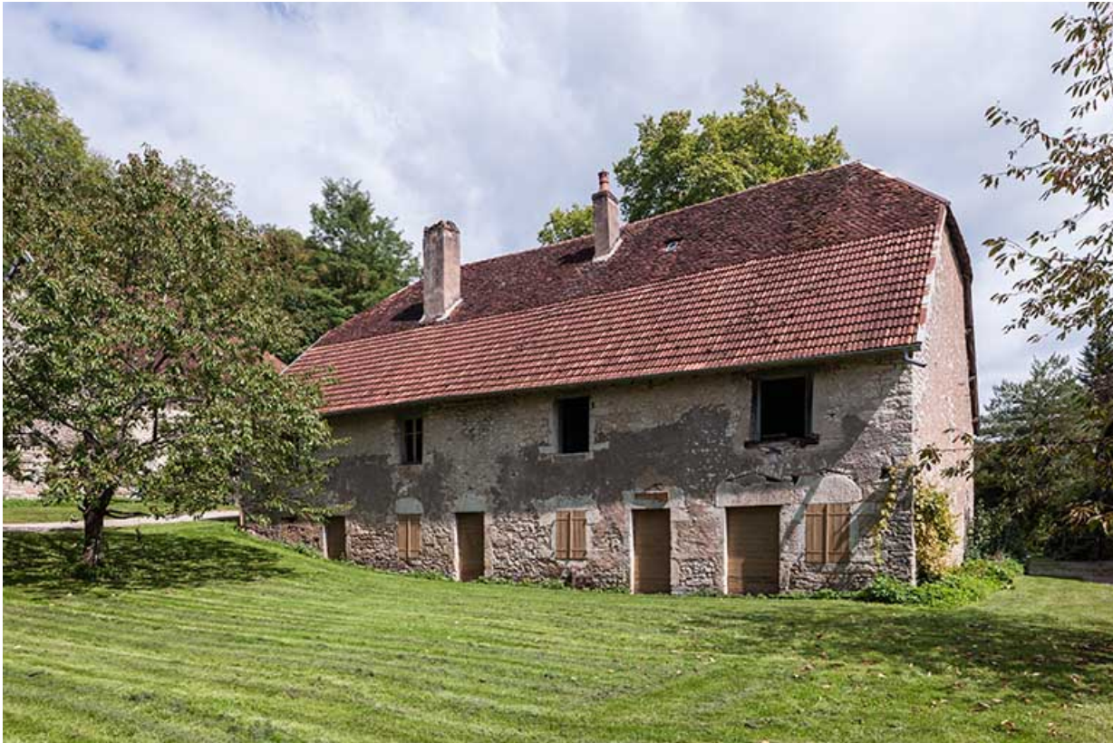
Logement d'ouvriers. Façade ouest de trois quarts.

25, Montagney-Servigny rue du Haut fourneau