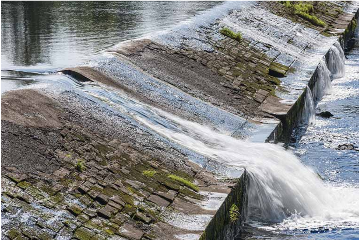
Vue de détail du barrage.

25, Montagney-Servigney rue du Haut fourneau