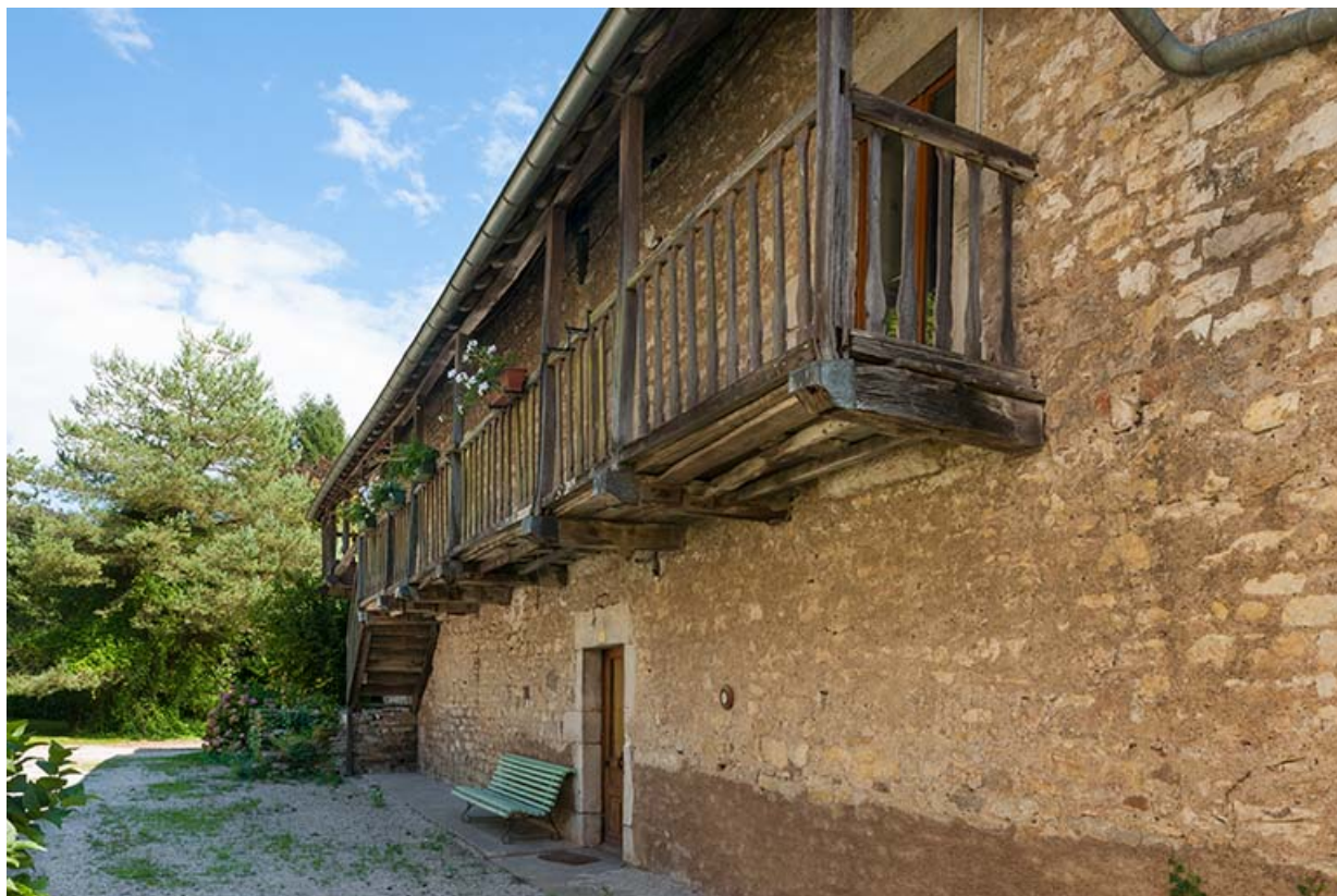
Coursive de la façade nord du logement patronal.

25, Montagney-Servigney rue du Haut fourneau