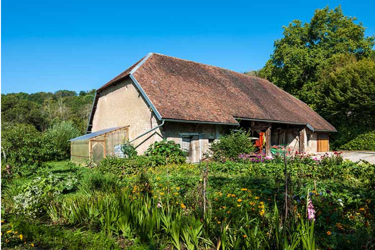
Vue du magasin industriel depuis le sud-est. 25, Montagney-Servigney rue du Haut fourneau