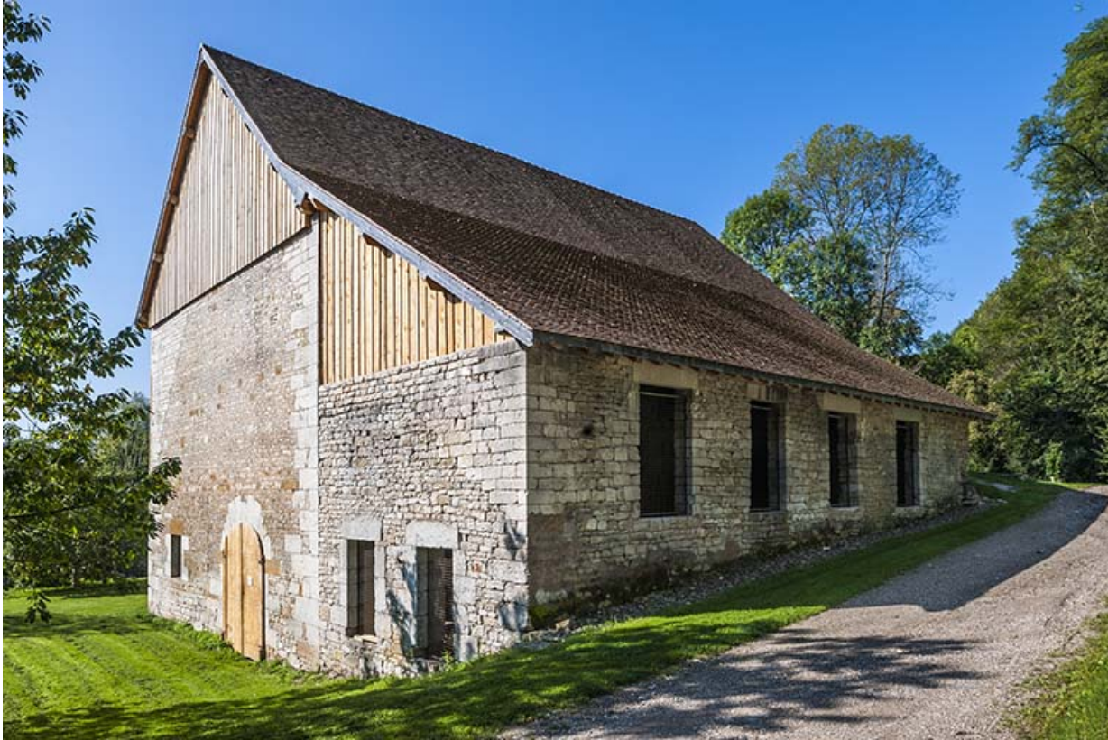
Bâtiment du haut fourneau vu de trois quarts gauche.

25, Montagney-Servigney rue du Haut fourneau