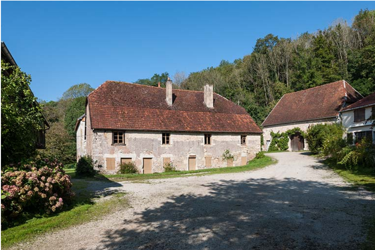
Logement d'ouvriers et bâtiment agricole depuis la cour.

25, Montagney-Servigny rue du Haut fourneau