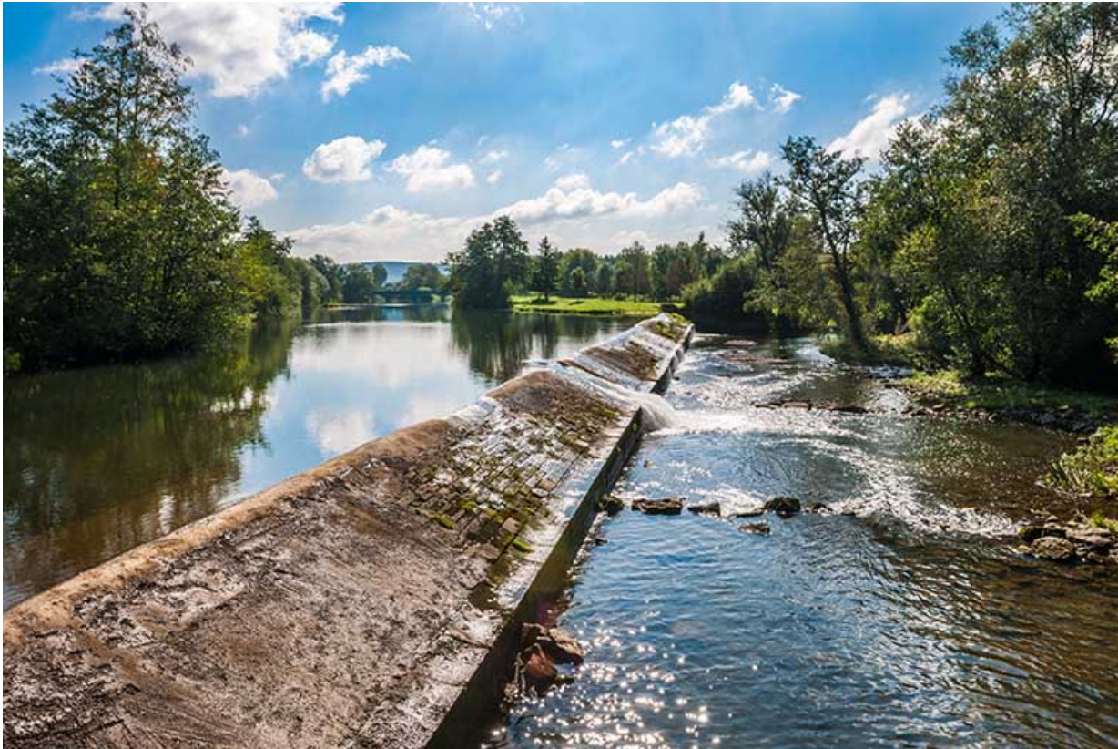
Vue d'ensemble du barrage depuis la rive droite.

25, Montagney-Servigny rue du Haut fourneau