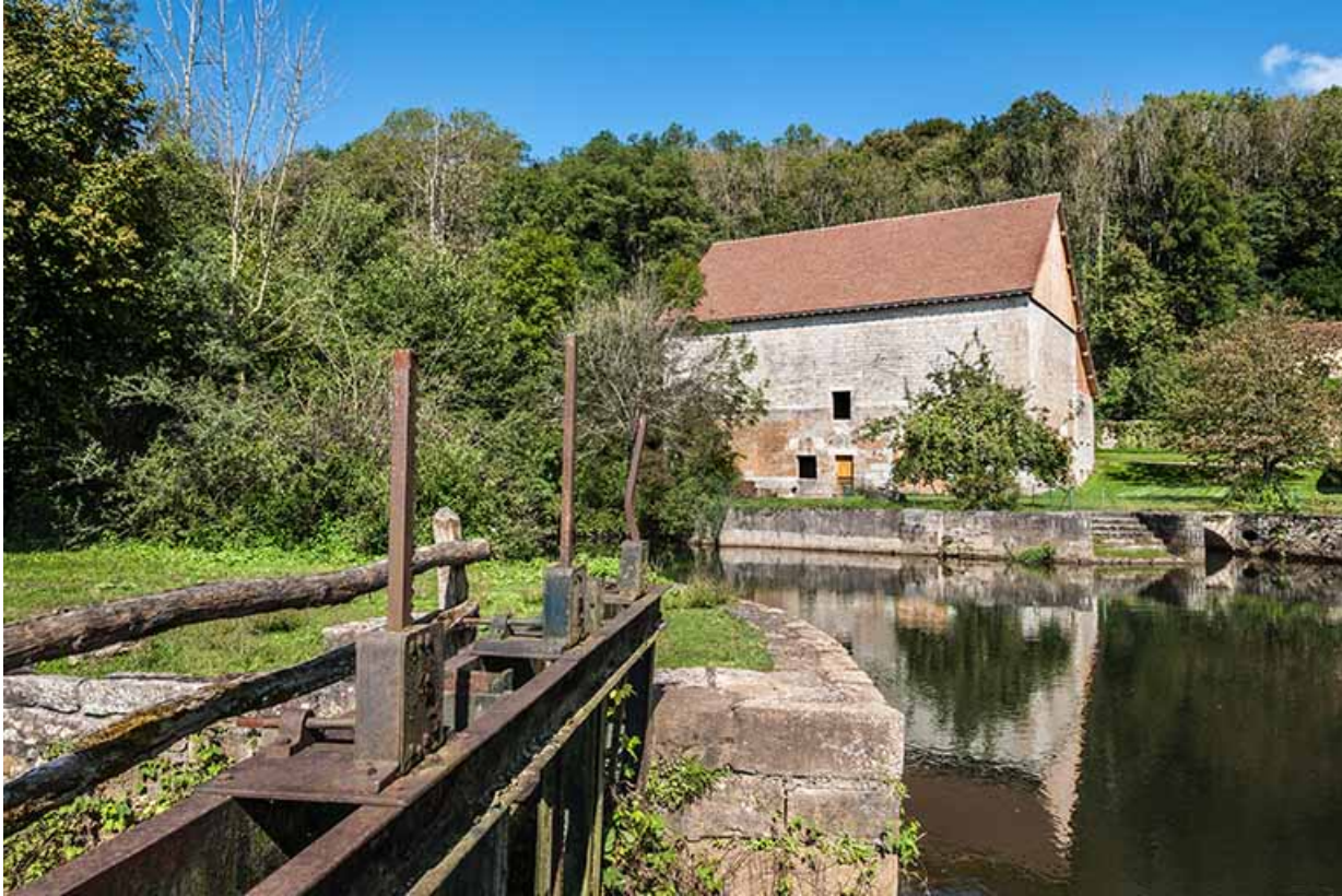
Bâtiment du haut fourneau depuis le vannage de l'ancien atelier de forge.

25, Montagney-Servigny rue du Haut fourneau