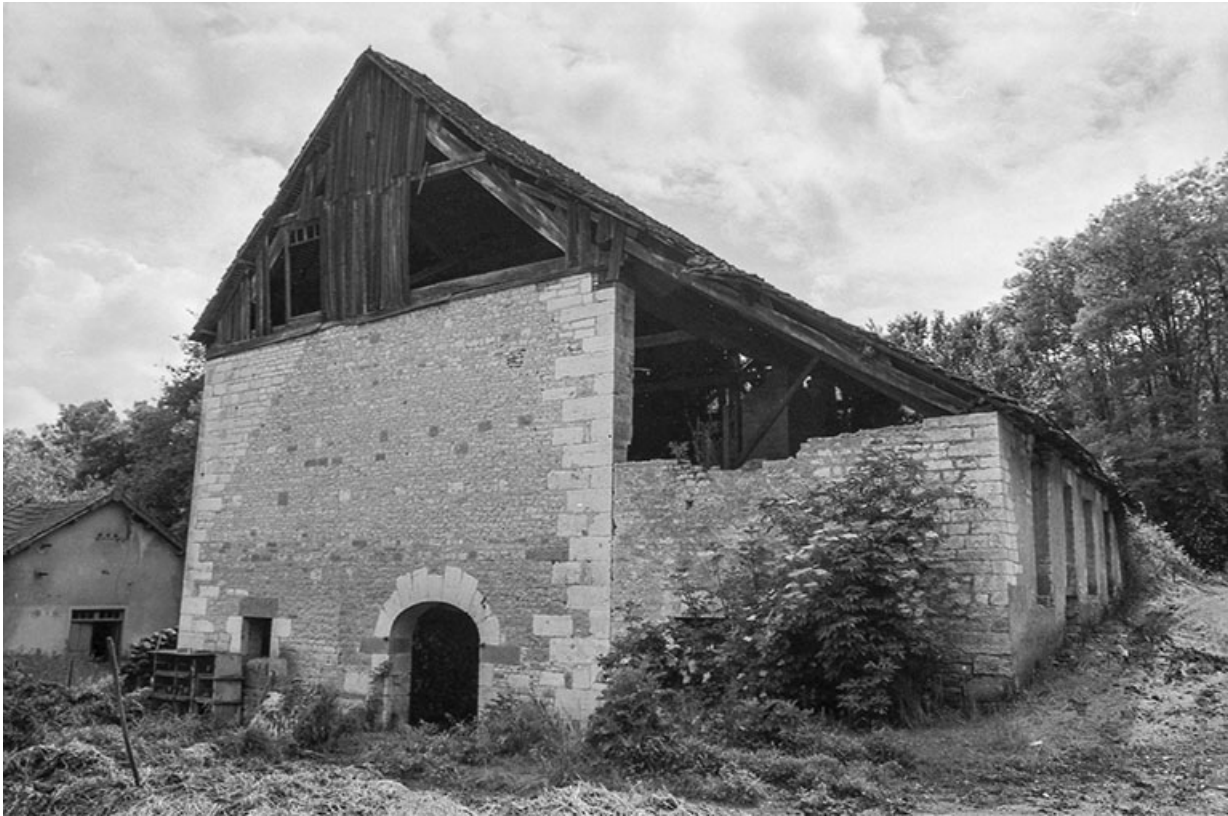
Le bâtiment du haut-fourneau.

25, Montagney-Servigney rue du Haut fourneau