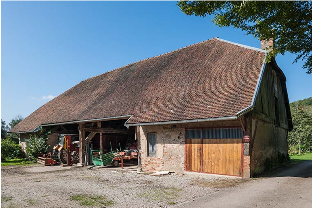
Façade est du magasin industriel.

25, Montagney-Servigny rue du Haut fourneau