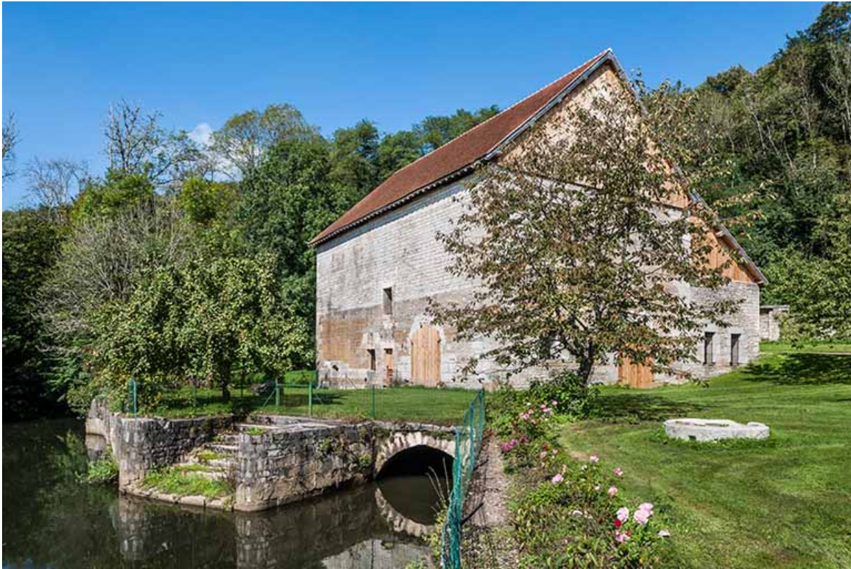
Bâtiment du haut fourneau depuis le sud-est.

25, Montagney-Servigney rue du Haut fourneau