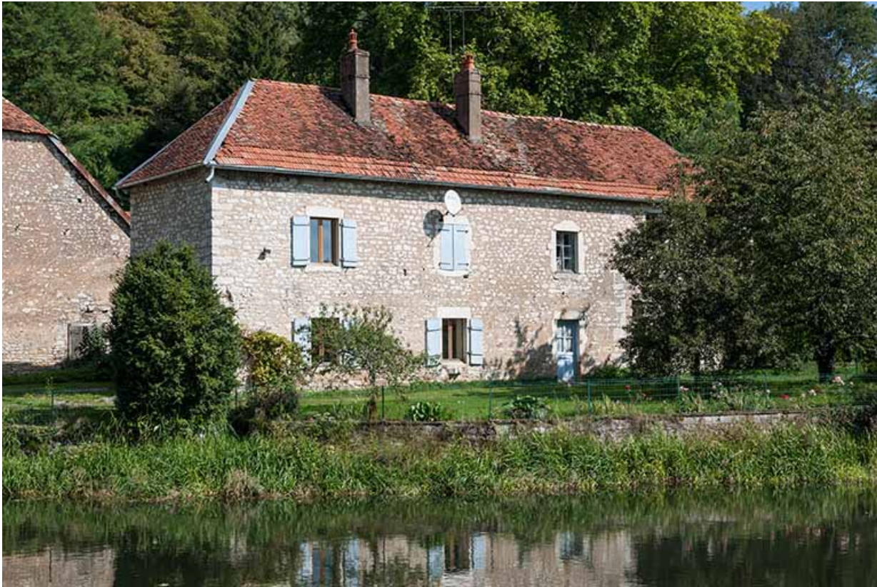
Vue de trois quarts arrière du logement patronal (devenu ensuite logement d'ouvriers).

25, Montagney-Servigney rue du Haut fourneau