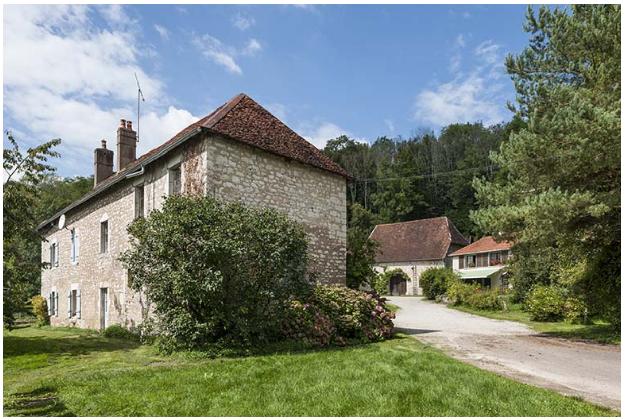
Vue d'ensemble depuis l'entrée du site.

25, Montagney-Servigney rue du Haut fourneau