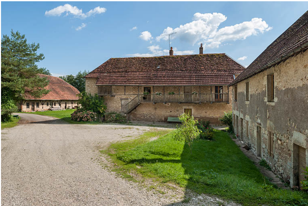
Magasin industriel et logement patronal depuis le nord.

25, Montagney-Servigney rue du Haut fourneau