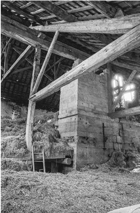
Partie supérieure du haut-fourneau.

25, Montagney-Servigney rue du Haut fourneau