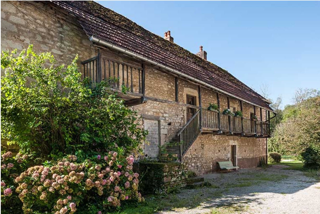
Façade nord du logement patronal.

25, Montagney-Servigney rue du Haut fourneau