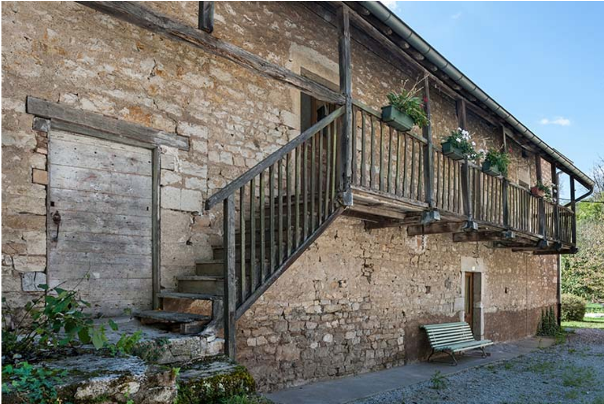
Détail de la façade nord du logement patronal.

25, Montagney-Servigny rue du Haut fourneau