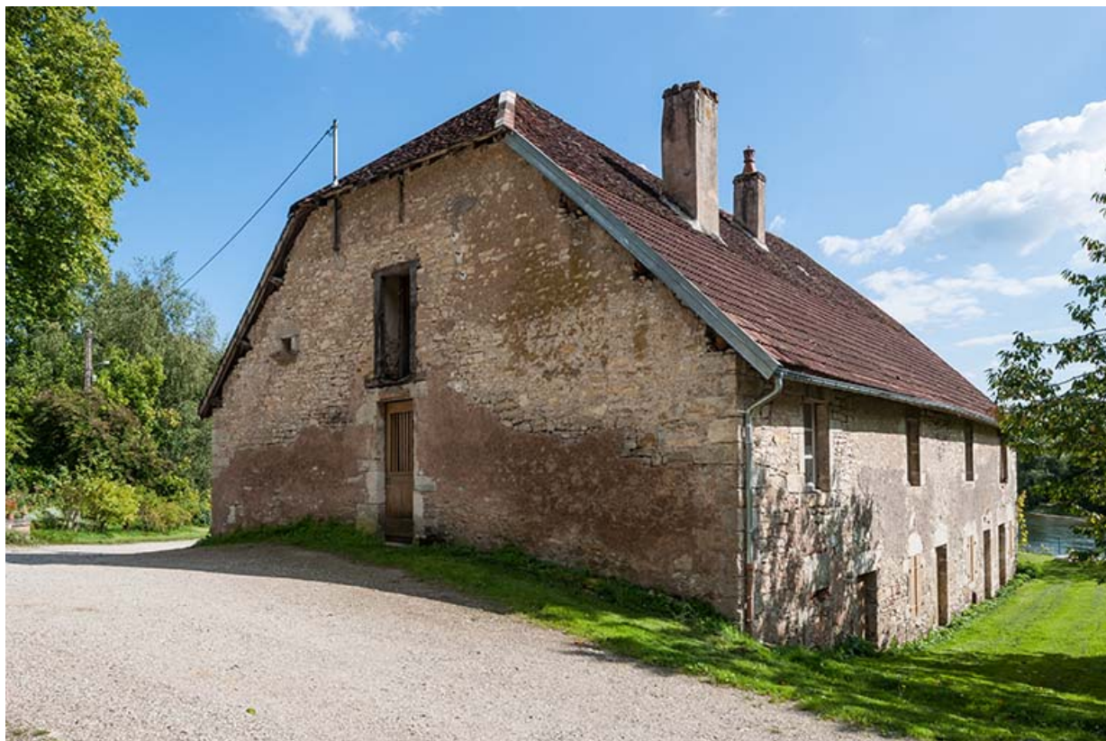
Logement d'ouvriers vu de trois quarts arrière. 25, Montagney-Servigny rue du Haut fourneau