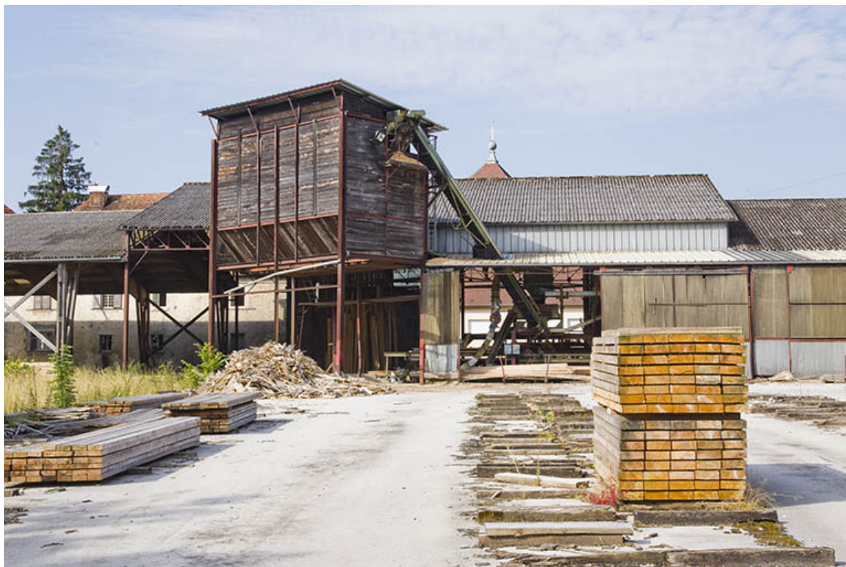
Silo à sciure et hangar de 1969-1970.