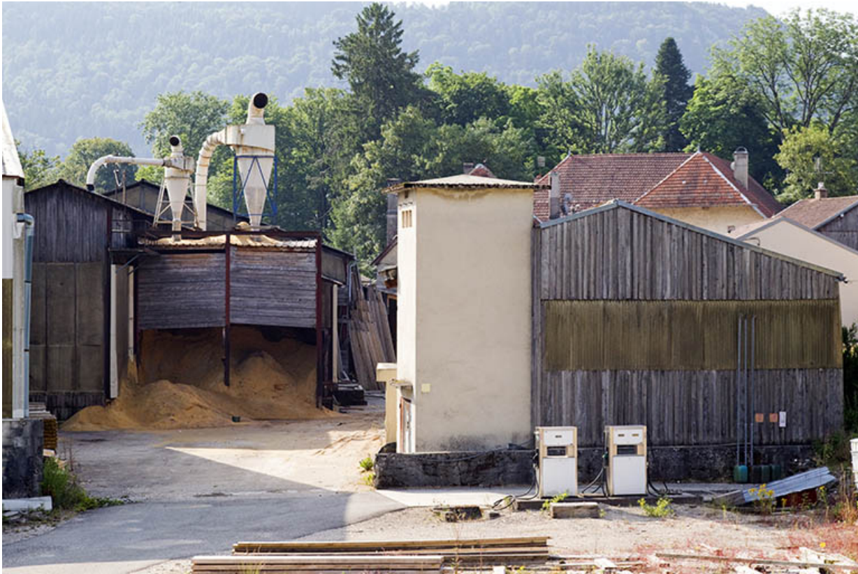
Silos à sciure et magasin industriel situés à l'ouest.