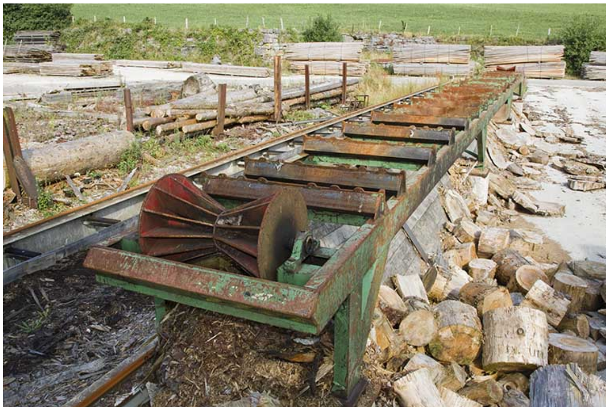
Parc aux grumes : convoyeur.