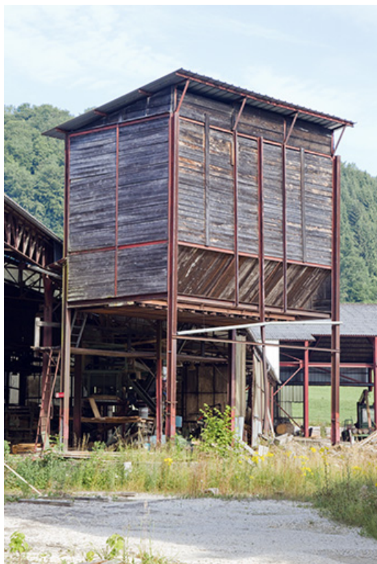
Silo à sciure.