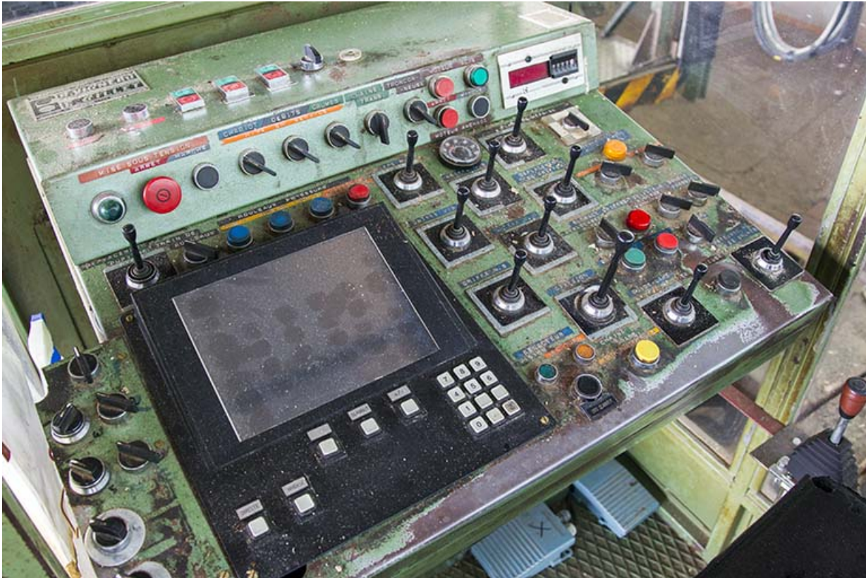
N° de l'illustration : 20132501291NUC2A