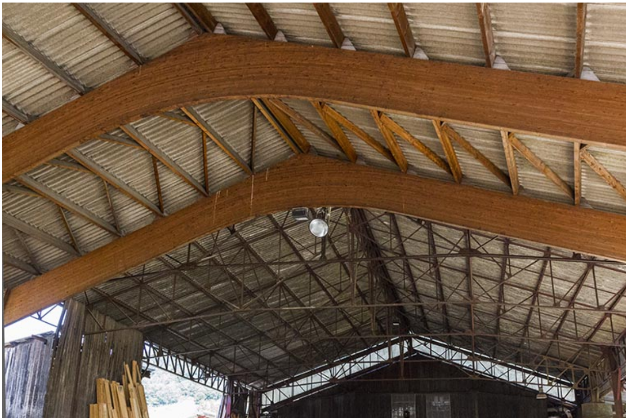
Hangar de 1990 : charpente en lamellé-collé.