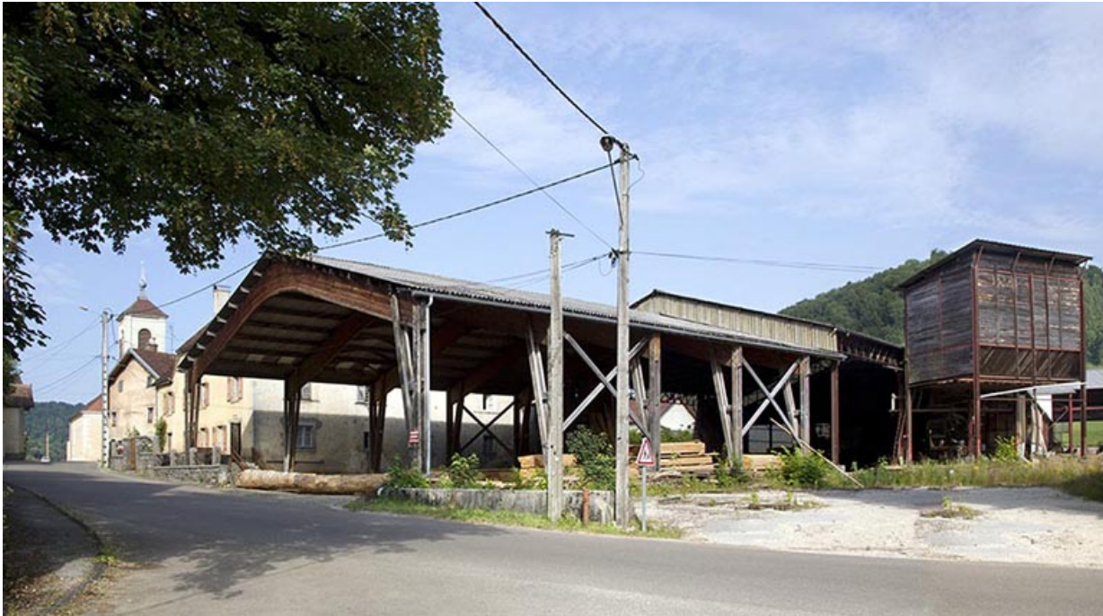
Entrée de la scierie : hangar de 1990 et silo à sciure.