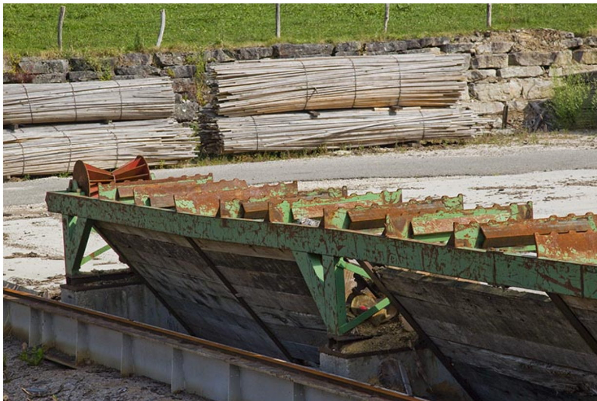
Parc aux grumes : détail du convoyeur.