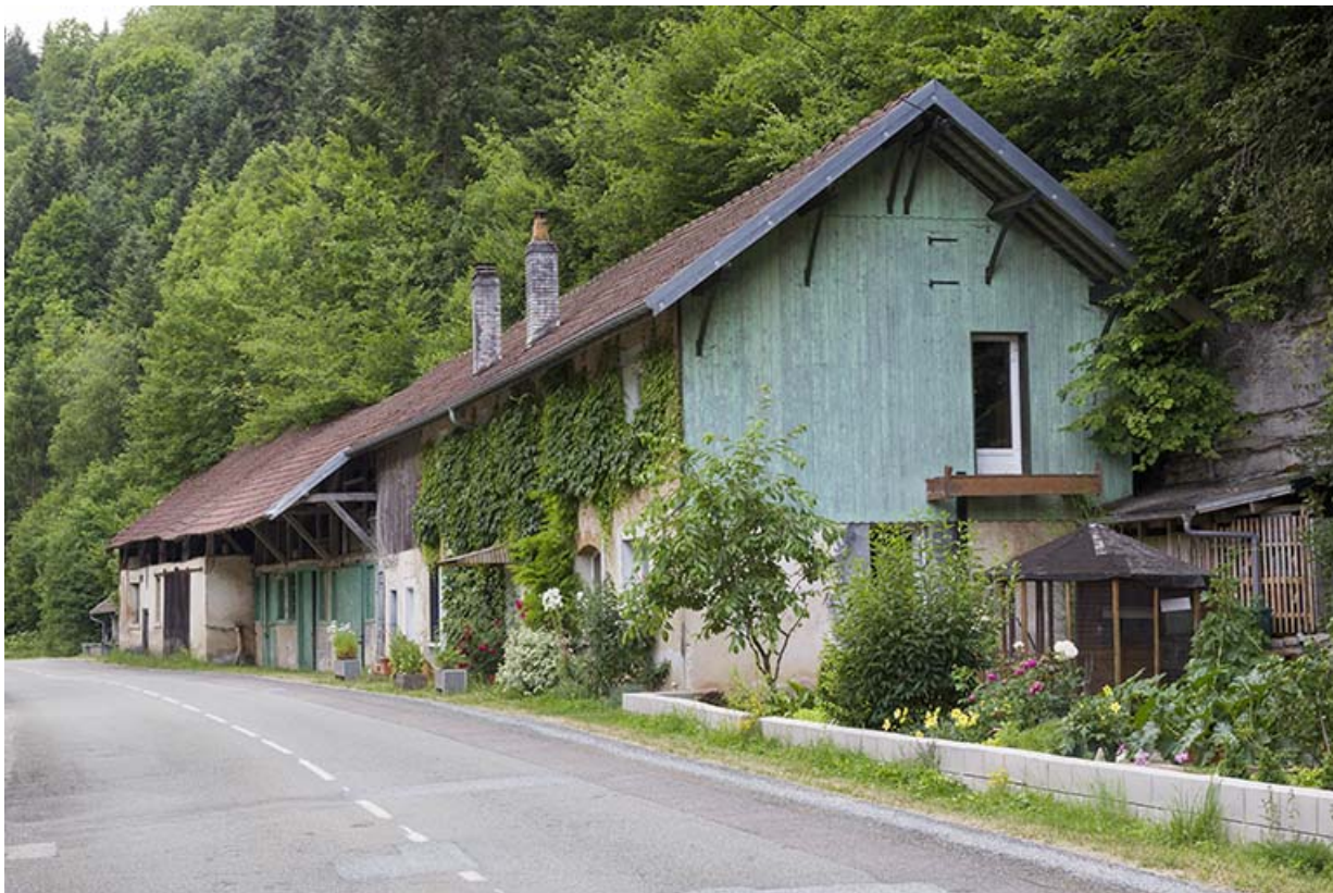
Logements d'ouvriers, écuries et remises, depuis le nord.

25, Vaucluse, lieudit : le Moulin du Milieu