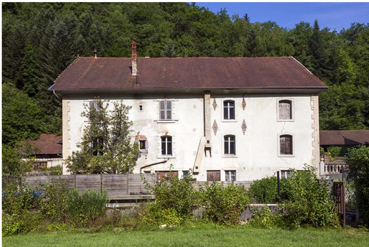
Logement patronal de 1900 : façade postérieure.

25, Vaucluse, lieudit : le Moulin du Milieu