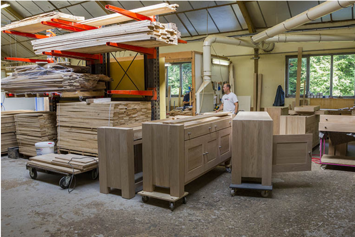
Atelier des années 1980 : stockage de bois et de meubles.