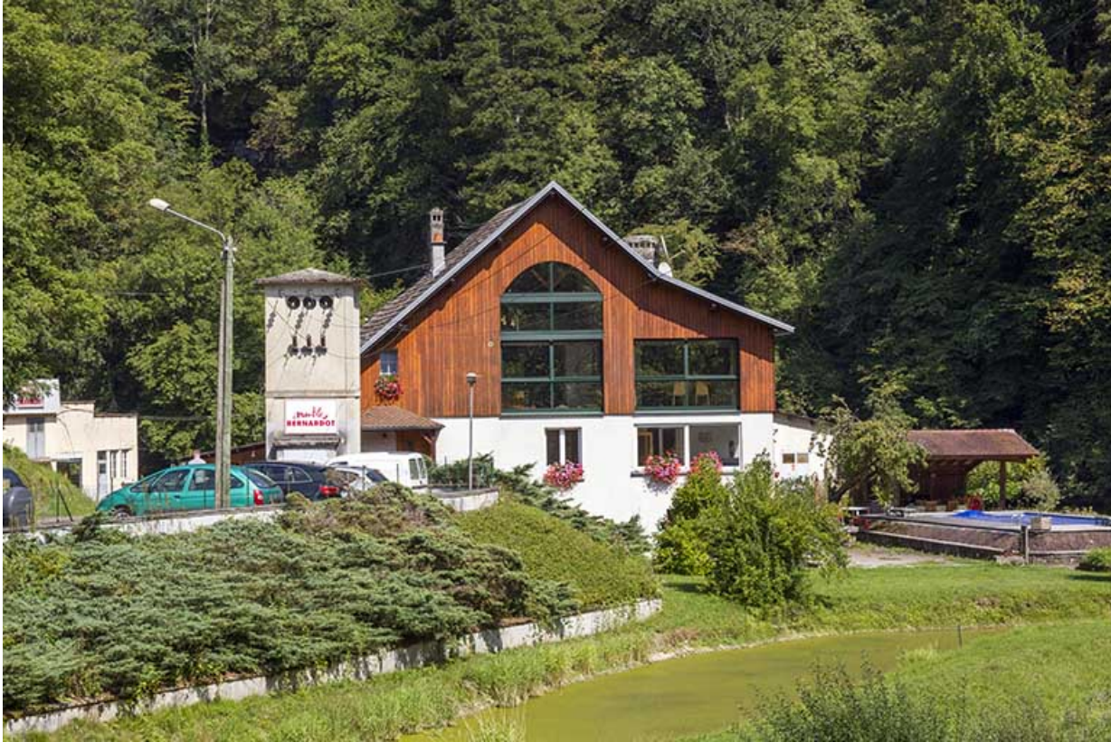
Le logement patronal et le transformateur, depuis l'ouest.