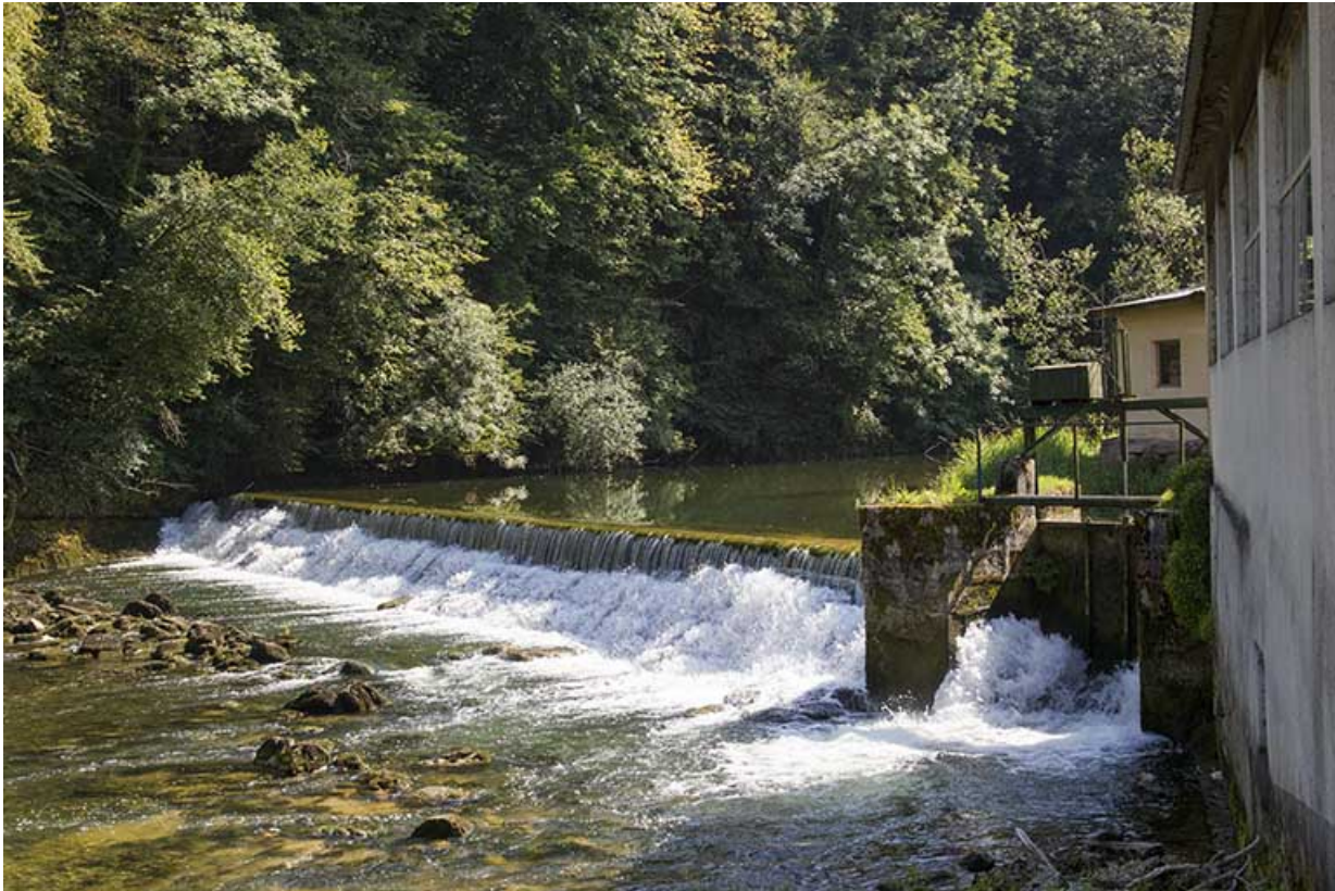
Le barrage et la vanne de décharge.