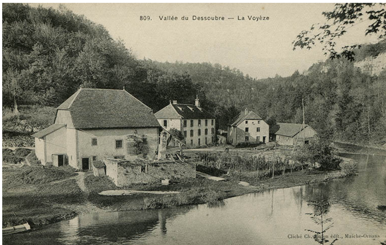
809. Vallée du Dessoubre - La Voyèze, 4e quart 19e siècle (avant 1903). 25, Vaclusotte, lieudit : la Voyèze