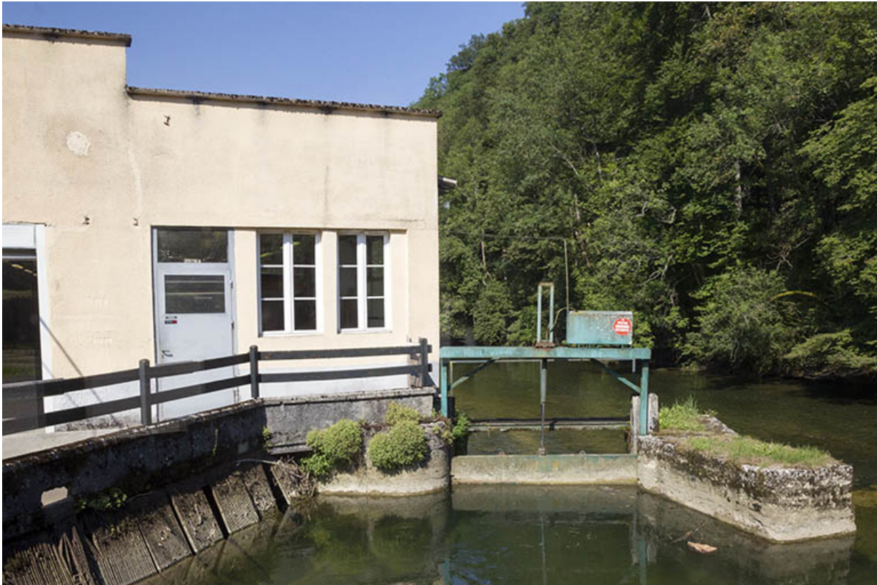
Le bâtiment d'eau et la vanne de décharge.