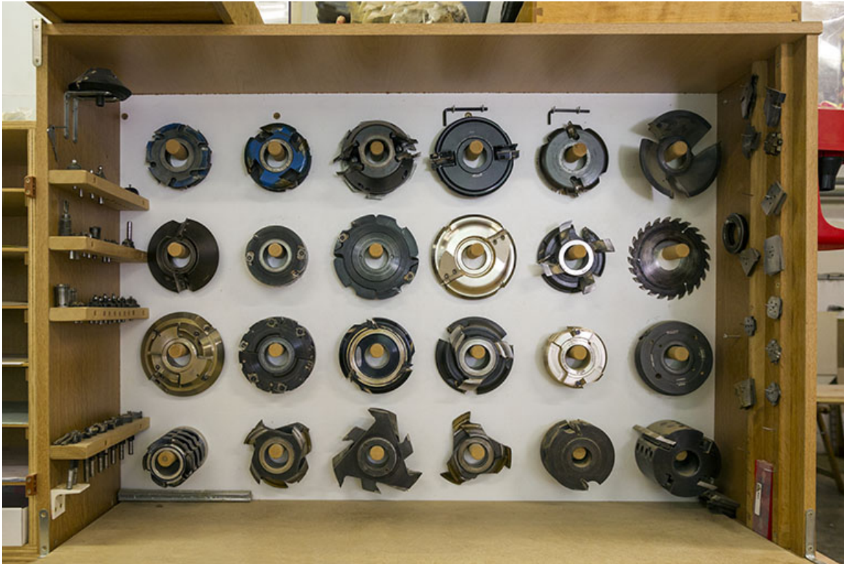
Atelier de 1990 : fraises et outils de coupe.