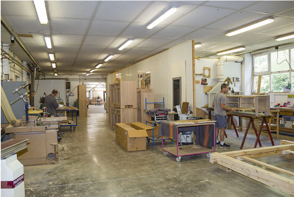
Intérieur de l'atelier de 1990.