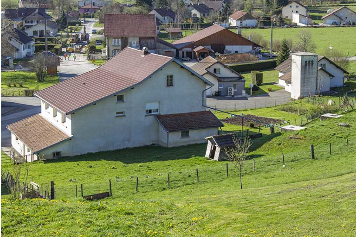
Elévation postérieure et citernes.