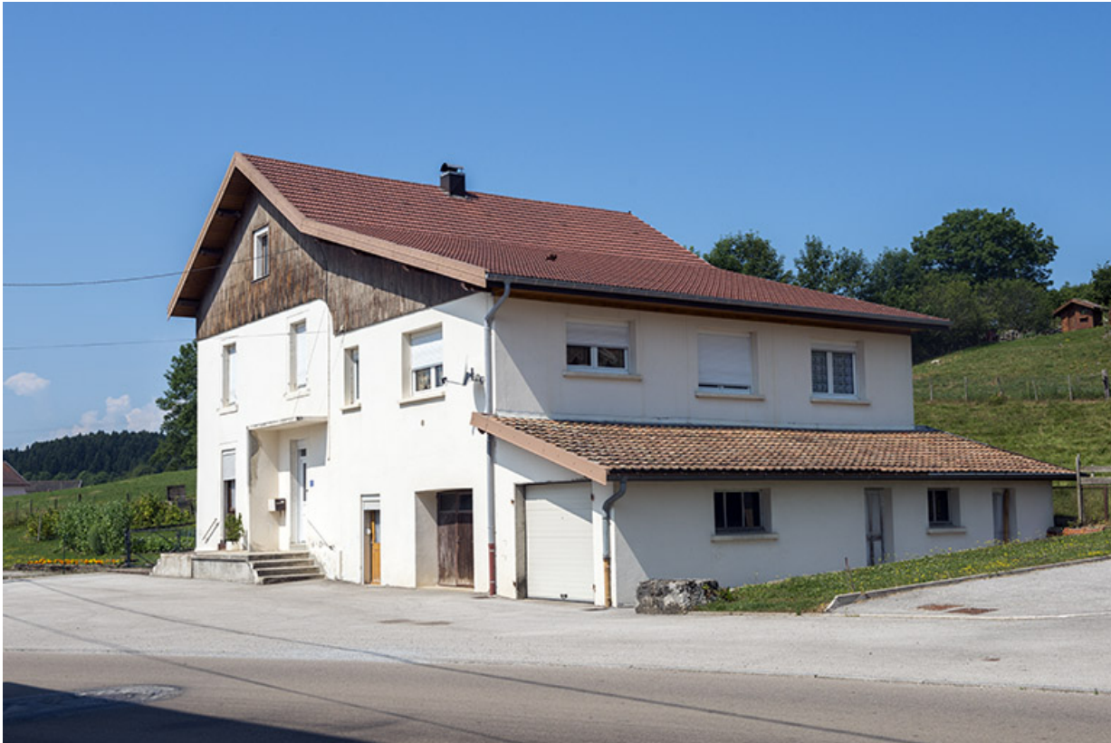
Elévations antérieure et latérale droite.