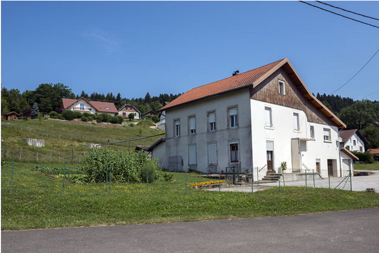
Vue d'ensemble, depuis le sud (élévations antérieure et latérale gauche).