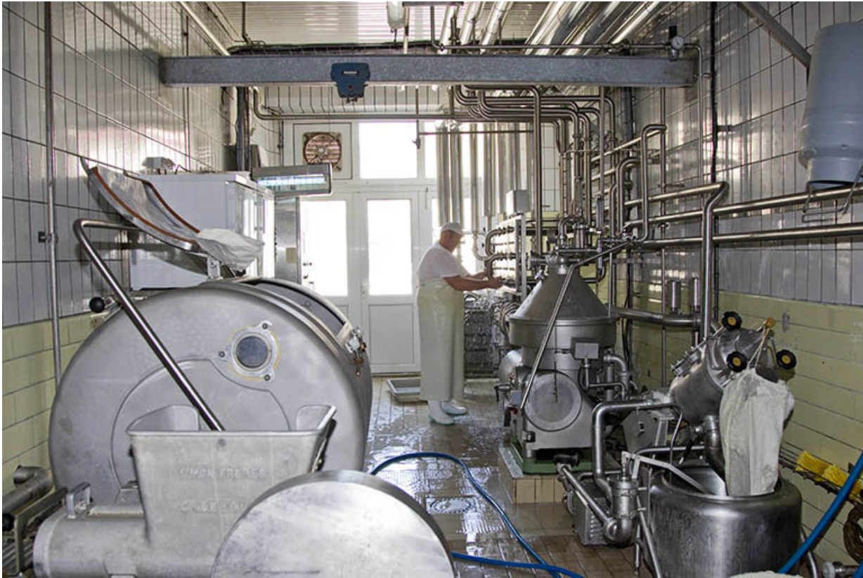
Salle de la baratte (à gauche) et de l'écumeuse (à droite). 25, Belleherbe, 22 Grande Rue