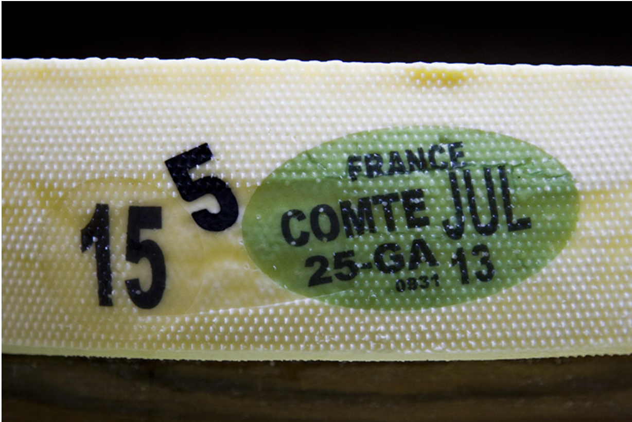
Plaque verte de caséine ("carte d'identité" de la meule de comté).