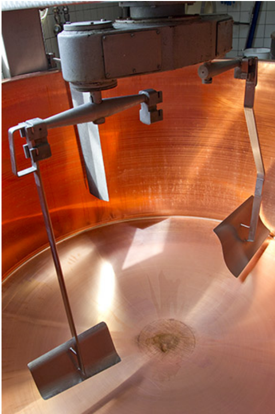
Cuve de fabrication : outils de brassage.