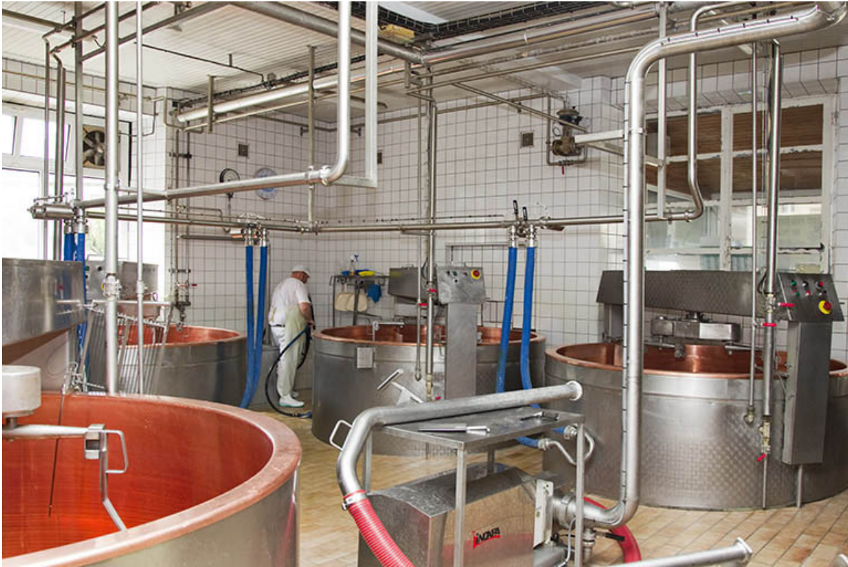
Intérieur de l'atelier de fabrication, avec quatre cuves.