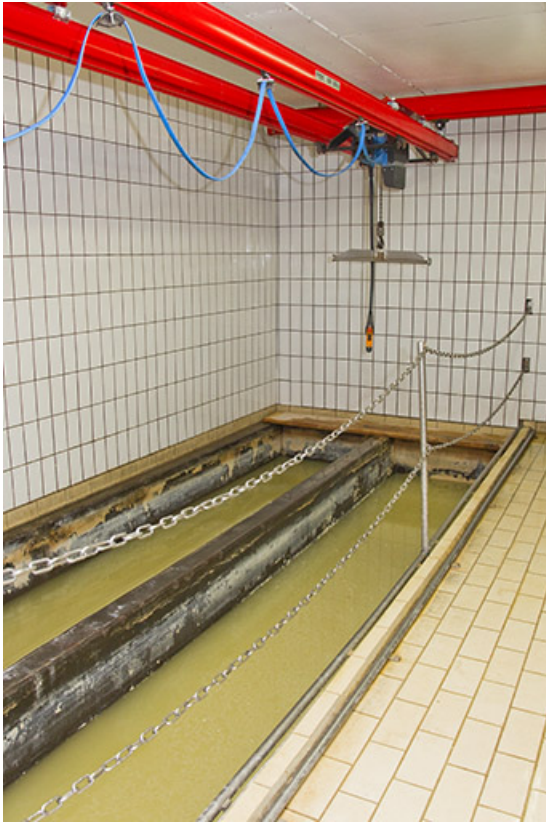
Bacs à saumure.