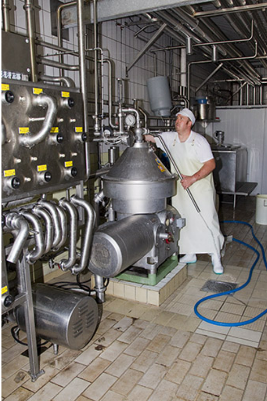
Ecrémeuse et fromager.