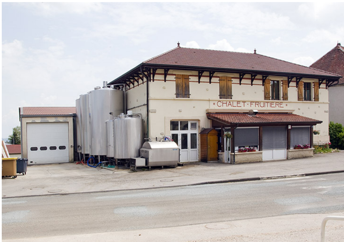
Façades antérieure et latérale gauche. 25, Belleherbe, 22 Grande Rue