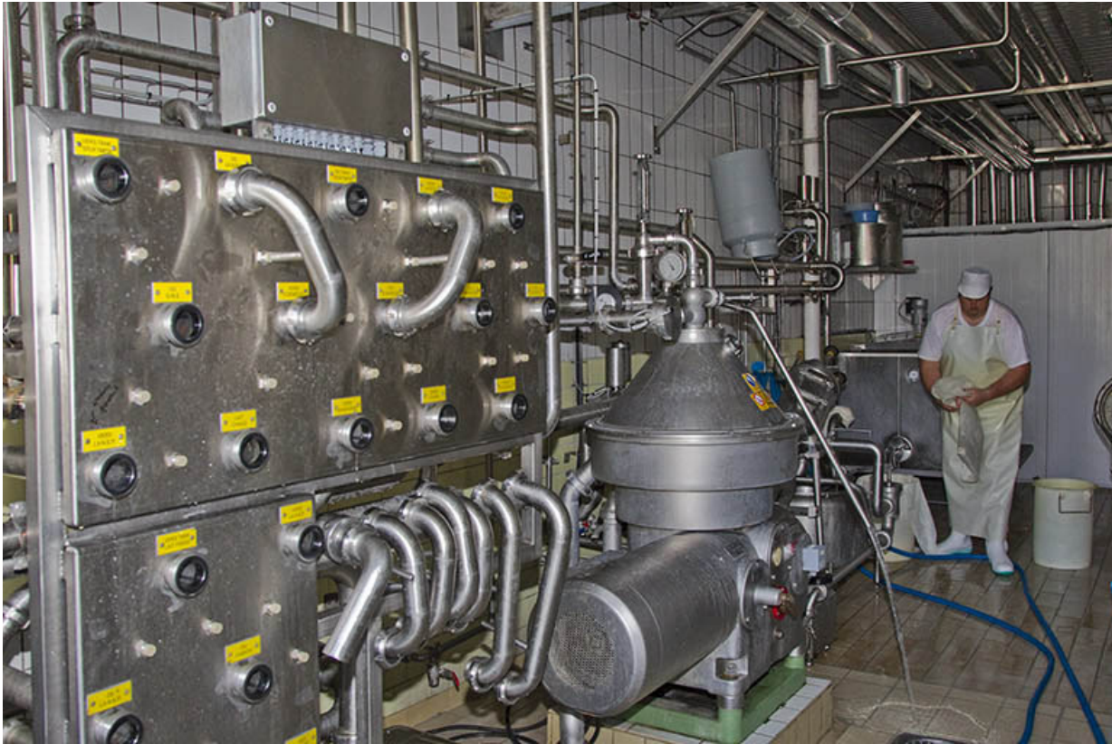
Panneaux de gestion des flux de liquide.