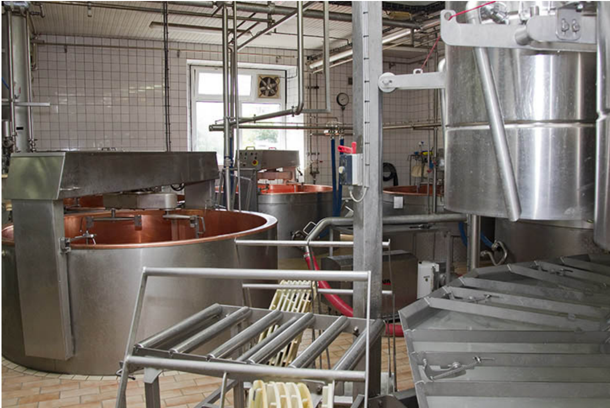
Intérieur de l'atelier de fabrication, depuis le groupe de moulage.