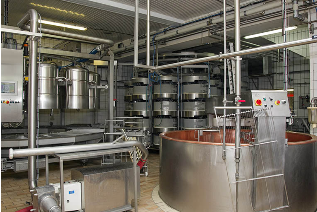
Intérieur de l'atelier de fabrication. Au premier-plan une cuve, au second le groupe de moulage (à gauche) et celui de pressage (à droite).