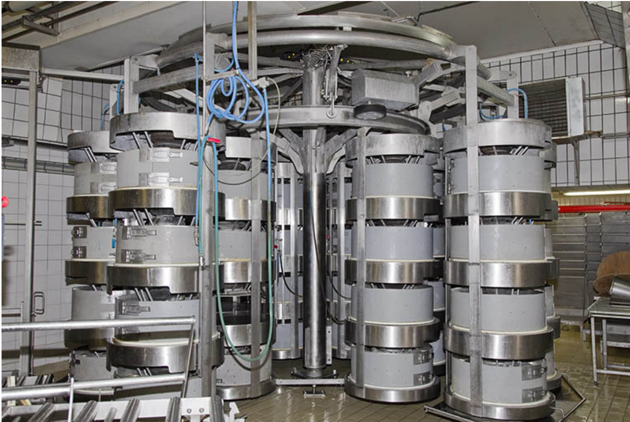
Groupe de pressage.