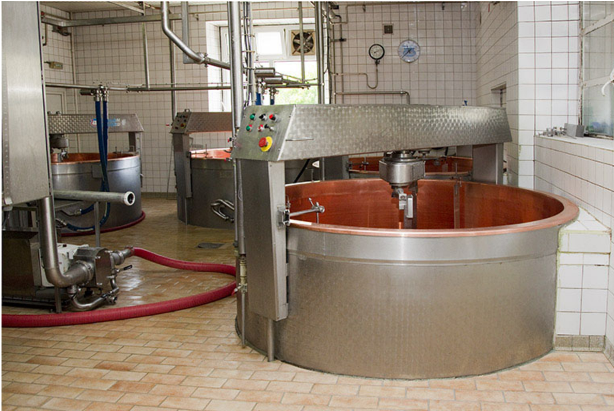
Cuves de fabrication.