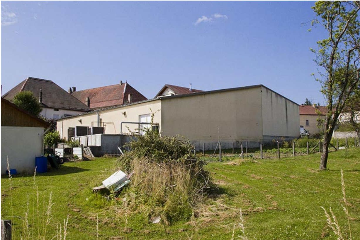
Façades postérieure et latérale gauche des extensions.