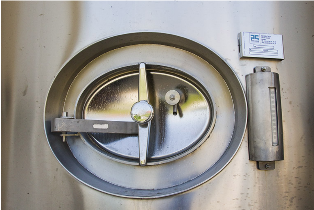
Porte d'une cuve de stockage.