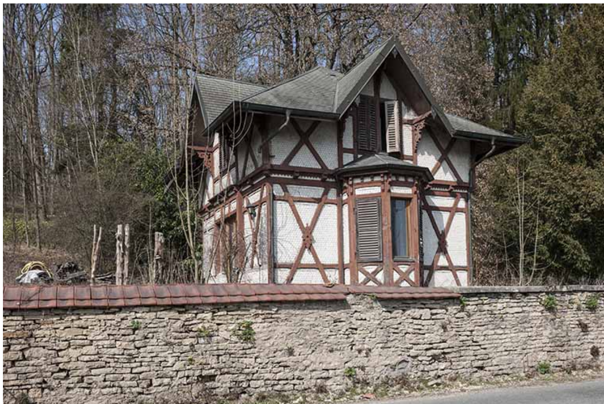
Vue rapprochée de la conciergerie.