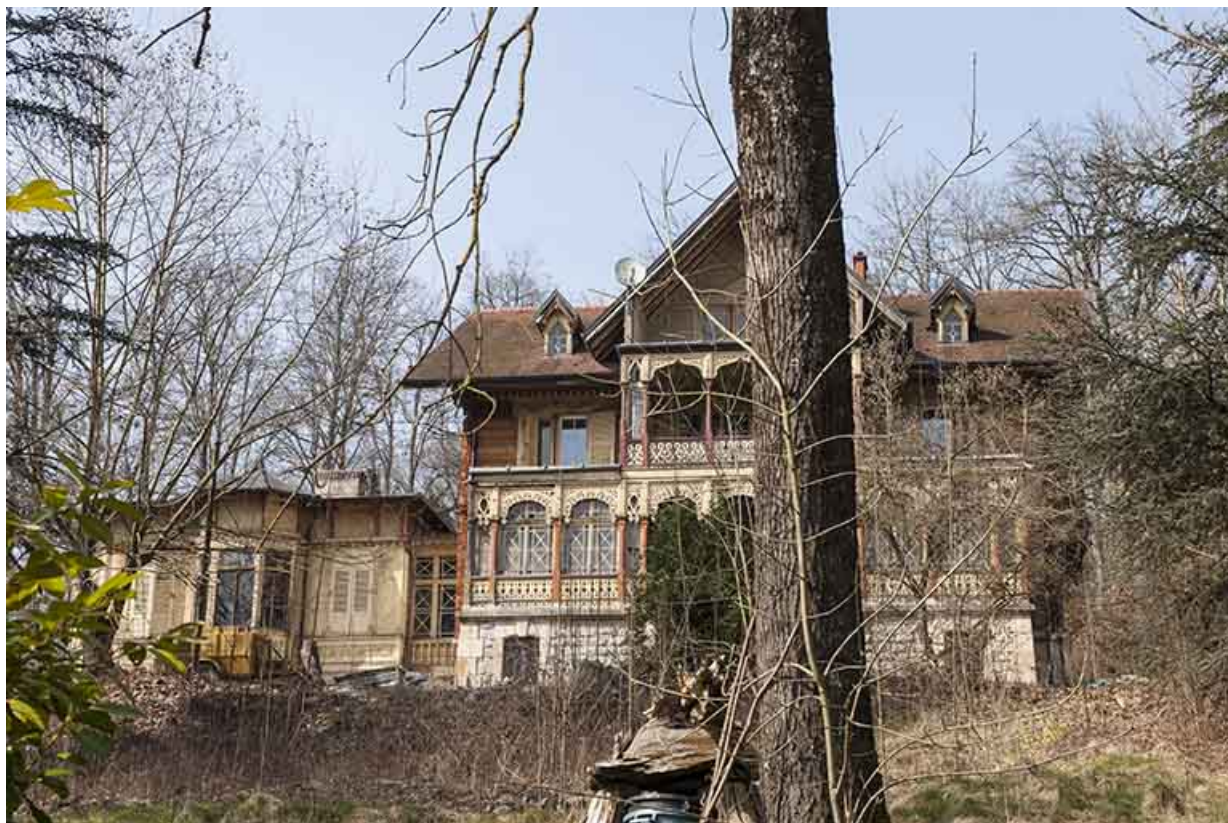
Logement patronal et son extension ouest.