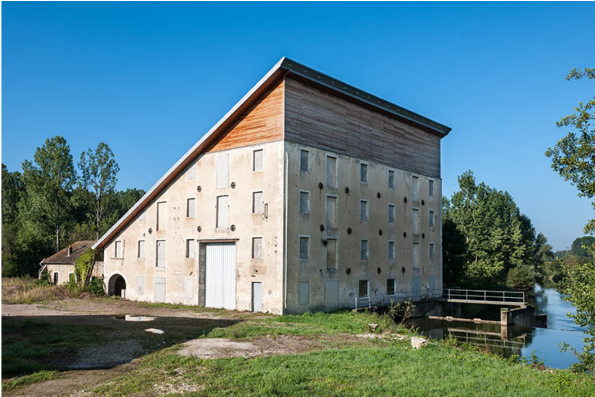
Vue de trois quarts gauche.