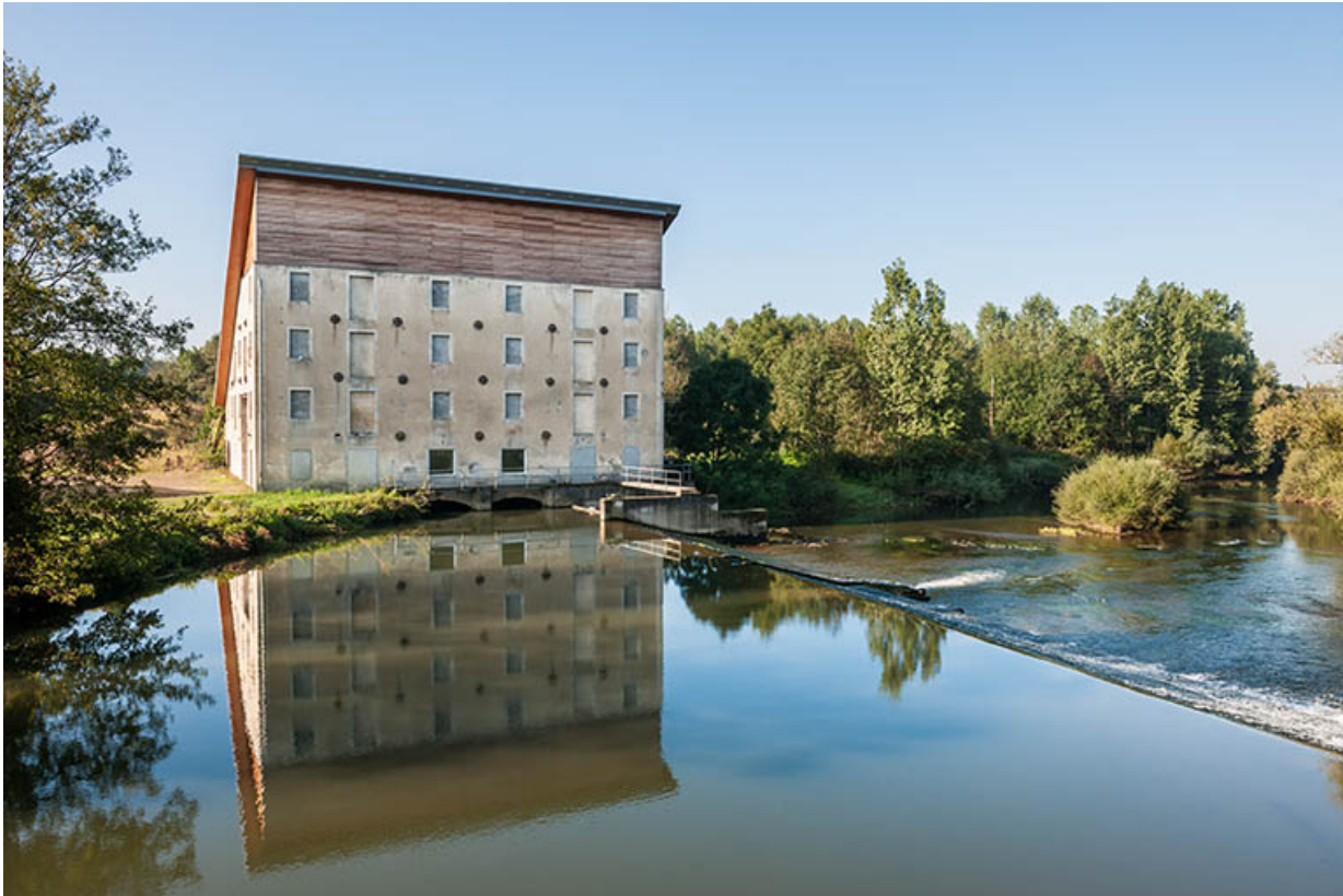
Vue d'ensemble depuis le pont.