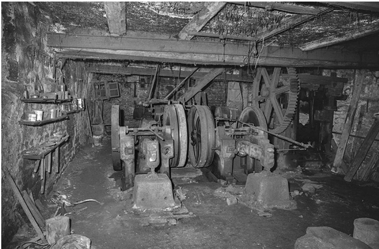
Atelier : les martinets.

25, Guillon-les-Bains, 4 rue de la Taillanderie