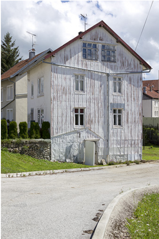
Façade latérale droite, de trois quarts gauche.