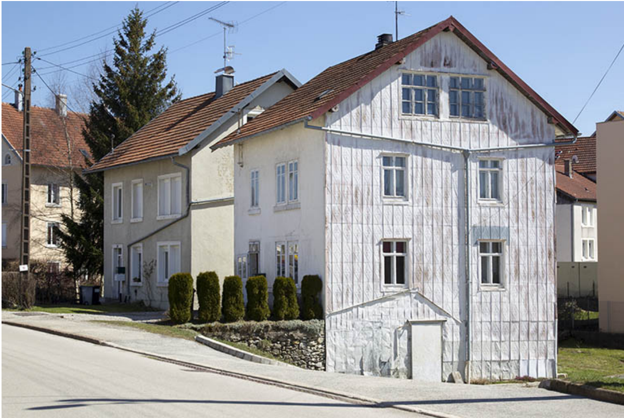
Maison et atelier d'horlogerie Janin, à Charquemont.