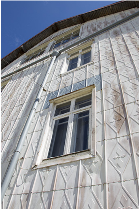
Façade latérale droite : fenêtres vues en contre-plongée.