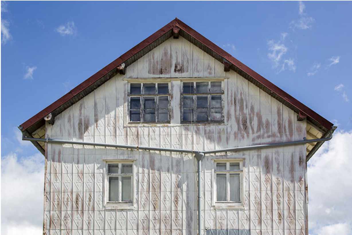
Façade latérale droite : fenêtres des niveaux supérieurs.