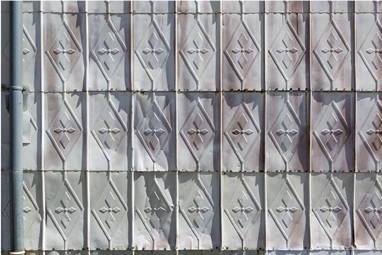
Façade latérale droite : essentage de tôle.