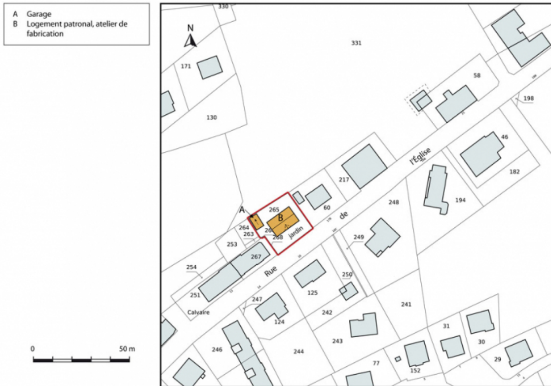
Plan-masse et de situation. Extrait du plan cadastral, 2015, section AD. 25, Charquemont, 17 rue de l' Eglise