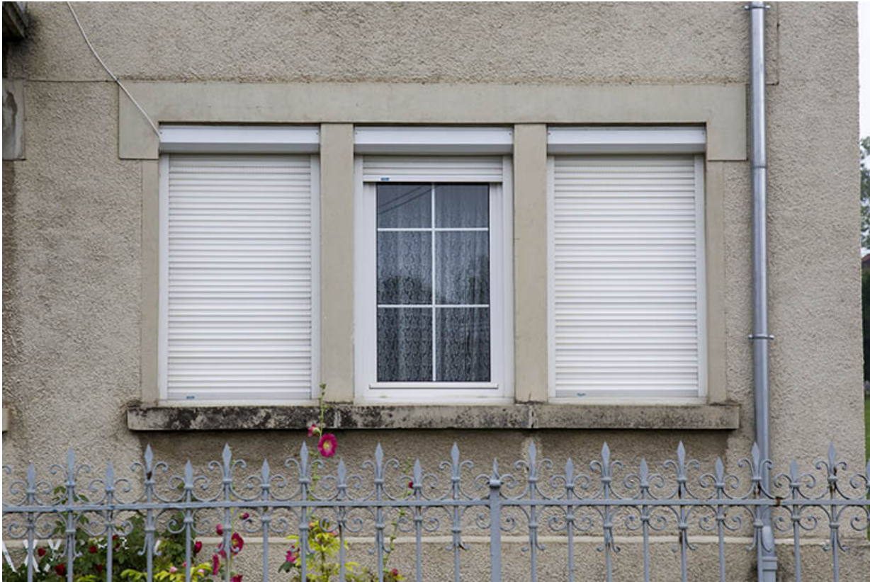
Façade antérieure : fenêtres multiples.