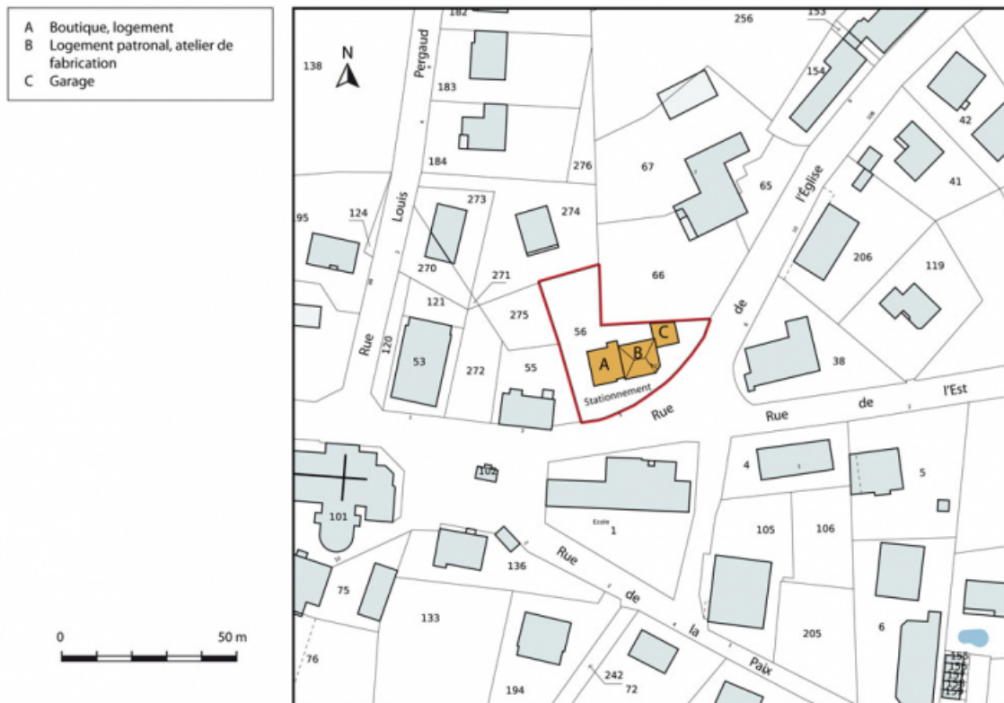
Plan-masse et de situation. Extrait du plan cadastral, 2015, section AC. 25, Charquemont, 5 rue de l' Eglise