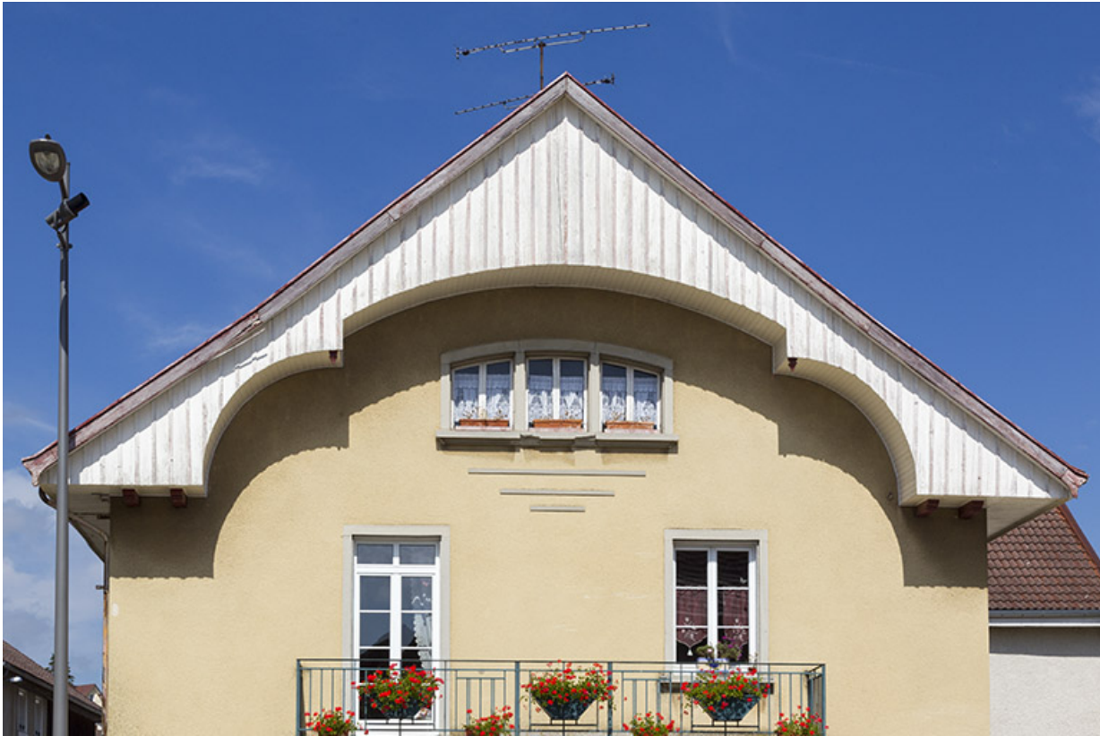
Corps de bâtiment principal, façade antérieure : niveaux supérieurs et lambrichure.

25, Charquemont, 8 place de l' Hôtel de Ville