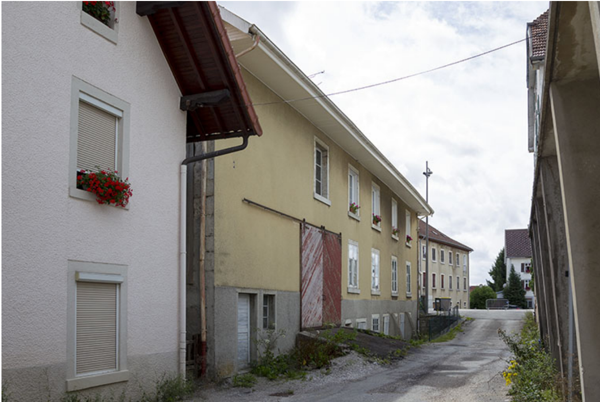
Façade des deux corps de bâtiment sur l'impasse.

25, Charquemont, 8 place de l' Hôtel de Ville