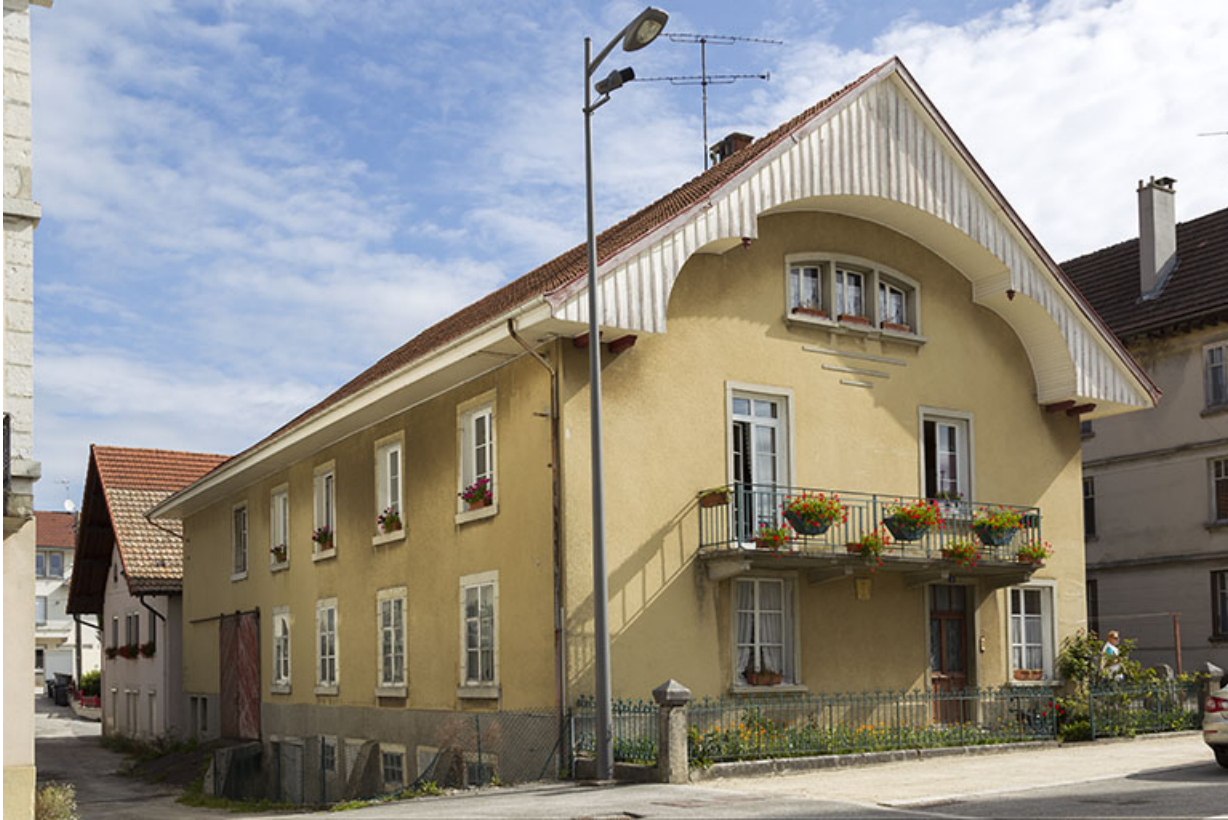
Corps de bâtiment principal : façades antérieure et latérale gauche.

25, Charquemont, 8 place de l' Hôtel de Ville