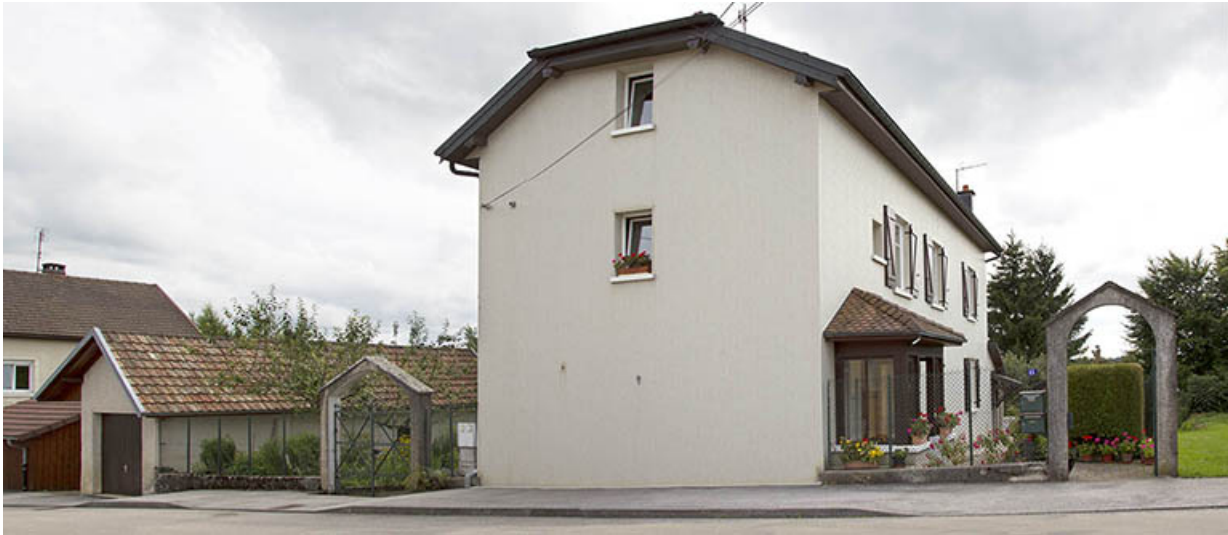
Vue d'ensemble depuis le nord-est (façades antérieure et latérale gauche). A gauche le garage. 25, Charquemont, 15 rue Victor Hugo

N° de l'illustration : 20152500886NUC4AQ