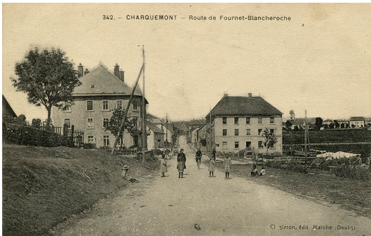
342. - Charquemont - Route de Fournet-Blancheroche [le bas du village depuis la statue de la Vierge], 1er quart 20e siècle. 25, Charquemont, 49 Grande Rue

342. - Charquemont - Route de Fournet-Blancheroche [le bas du village depuis la statue de la Vierge], carte postale, par Ch. Simon, s.d. [1er quart 20e siècle], Ch. Simon éd. à Maiche. Publiée dans : Vuillet, Bernard. Entre Doubs et Dessoubre. Tome III. Autour de Charquemont et Damprichard. - 1991, p. 118.