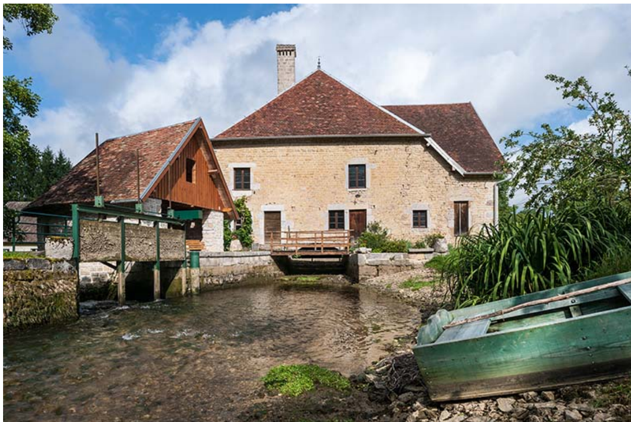
Vue rapprochée depuis le sud-est.