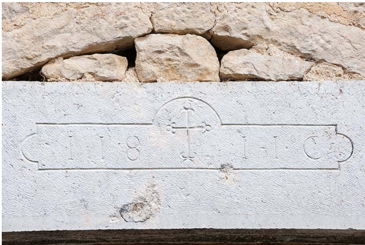
Détail d'un linteau de la façade sud.