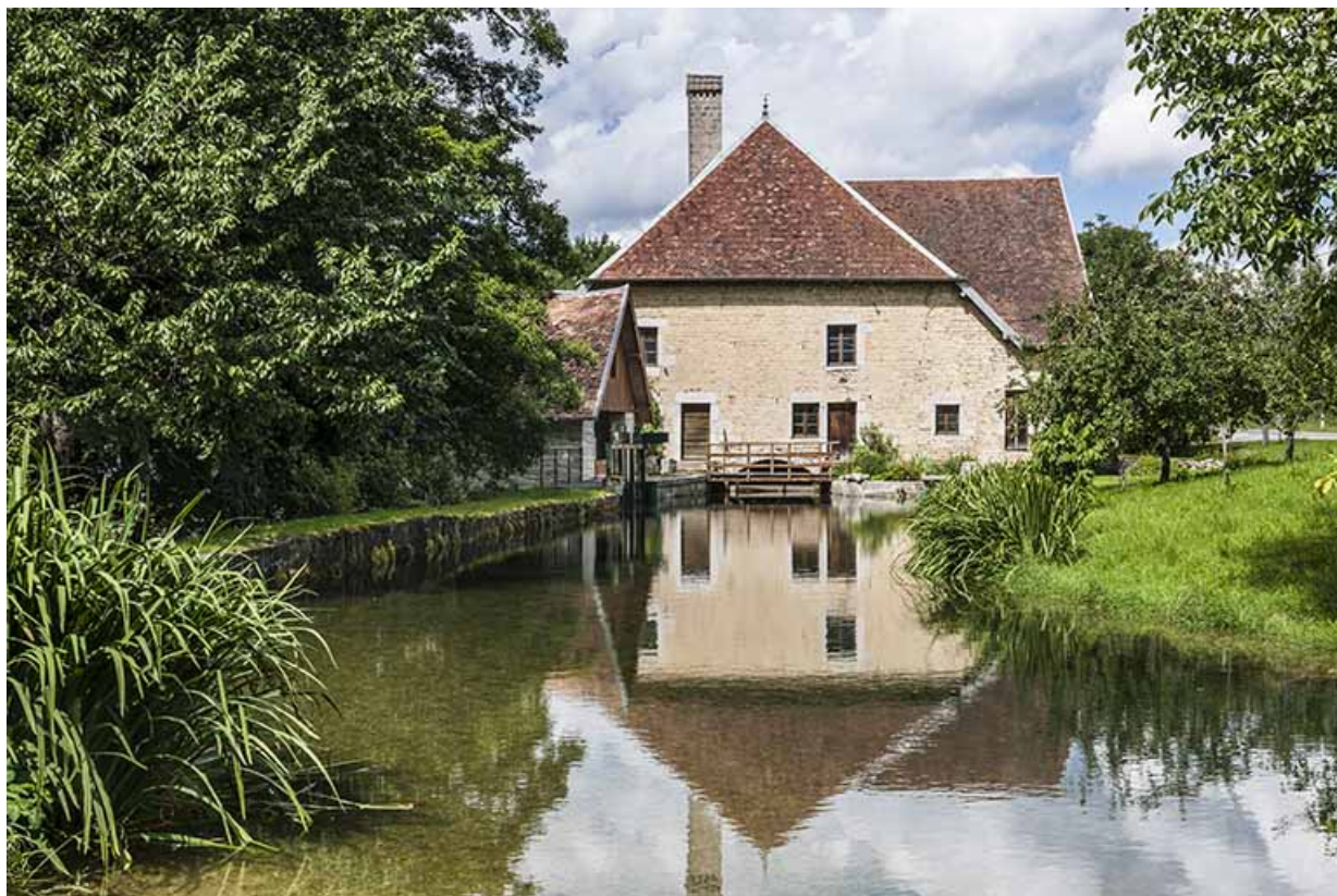
Vue d'ensemble depuis l'amont.