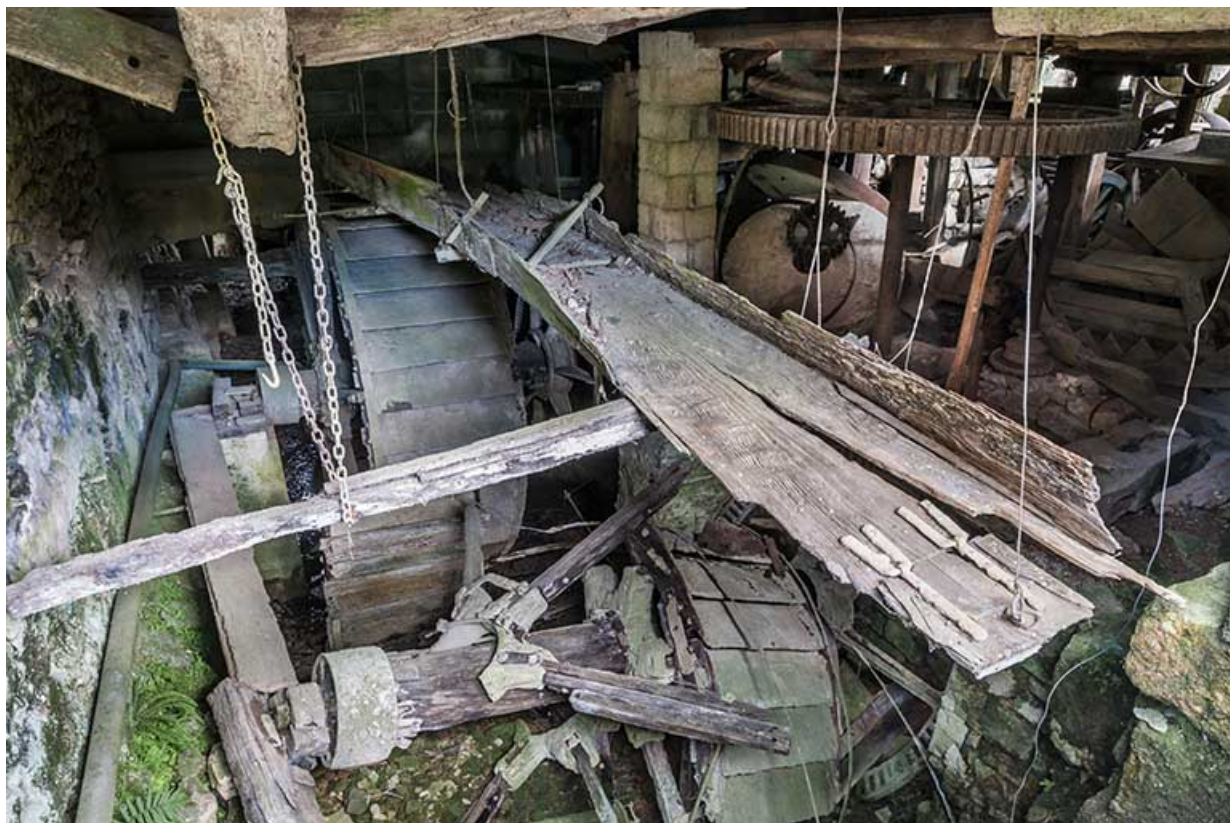
Vue plongeante sur la partie motrice : vestiges de deux roues hydrauliques et de la huche d'amenée. 25, Bremondans, lieudit : Amans