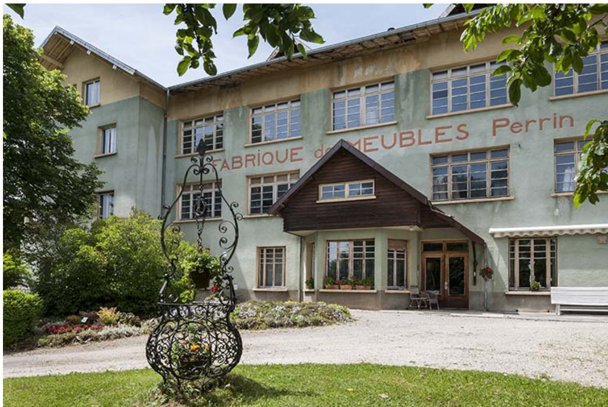
Atelier de menuiserie. Façade est.

25, Orchamps-Vennes, 4 rue du Château d'eau