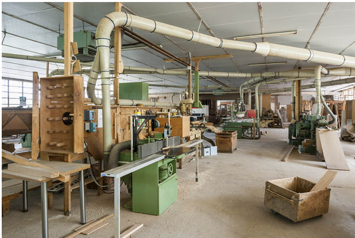
Atelier de menuiserie. Vue d'ensemble.

25, Orchamps-Vennes, 4 rue du Château d'eau