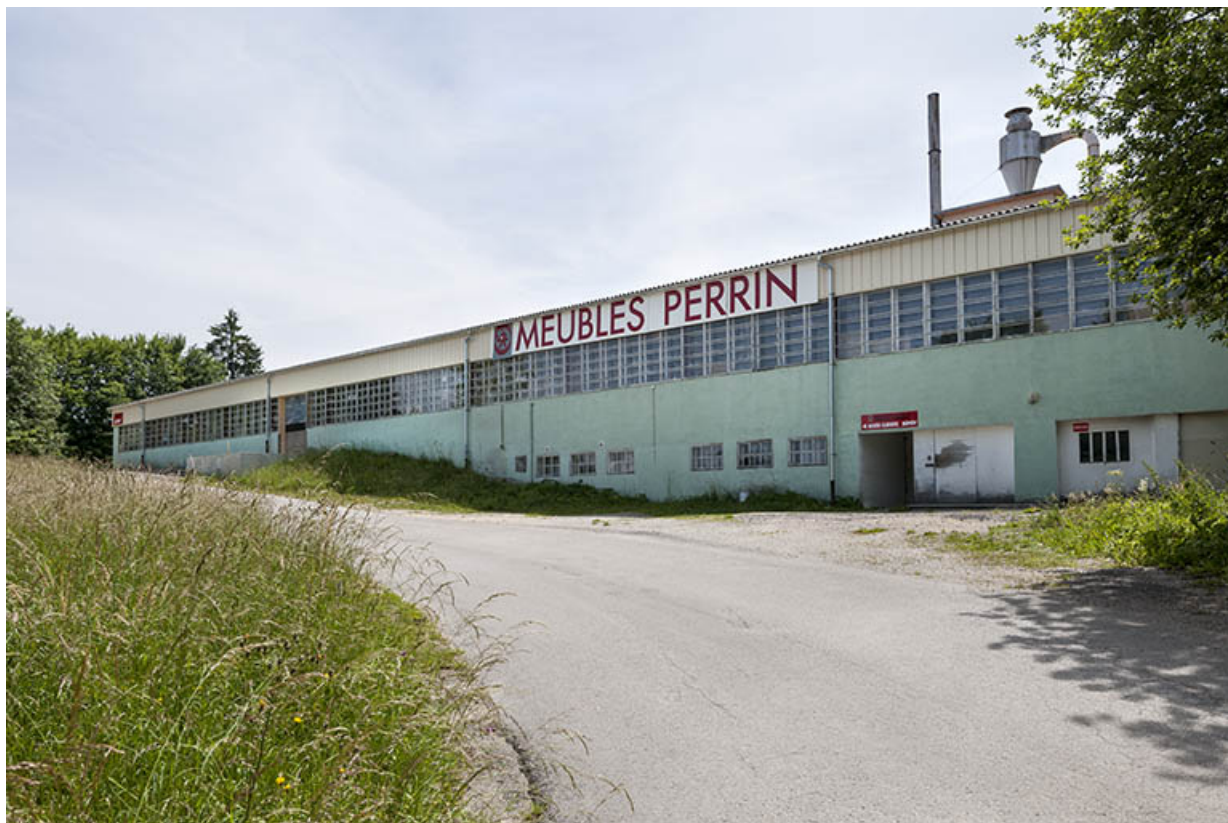
Atelier de menuiserie nord. Vue de trois quarts.

25, Orchamps-Vennes, 4 rue du Château d'eau