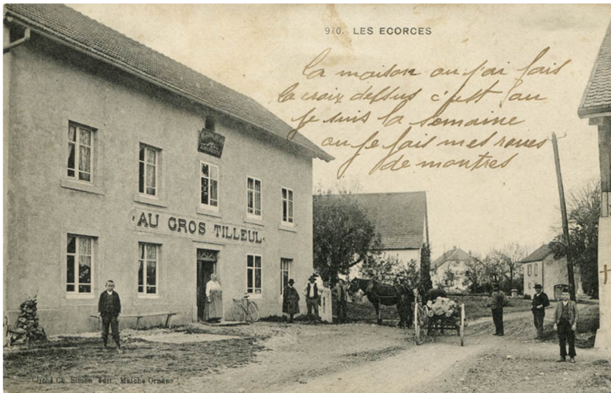
920. Les Ecorces [façade antérieure, de trois quarts gauche], entre 1903 et 1913. 25, Les Écorces, 20 Grande Rue