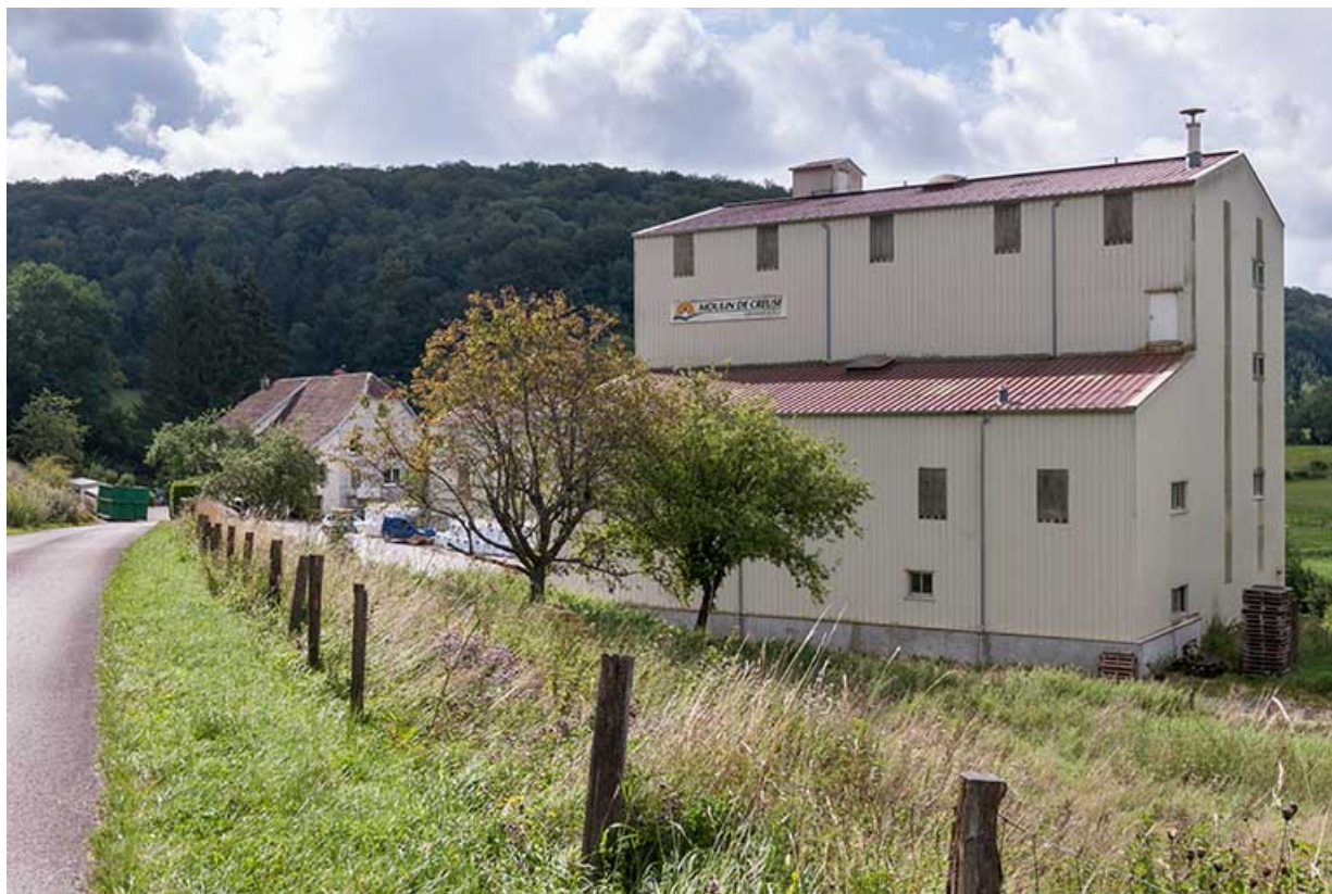
Vue depuis la route d'accès. A droite, le nouvel atelier de fabrication.