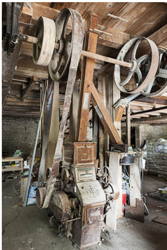
Rez-de-chaussée surélevé. Broyeur à cylindres Lacroix (Dole) et sa transmission par courroie. 25, Villers-Chief, lieudit : Creuse