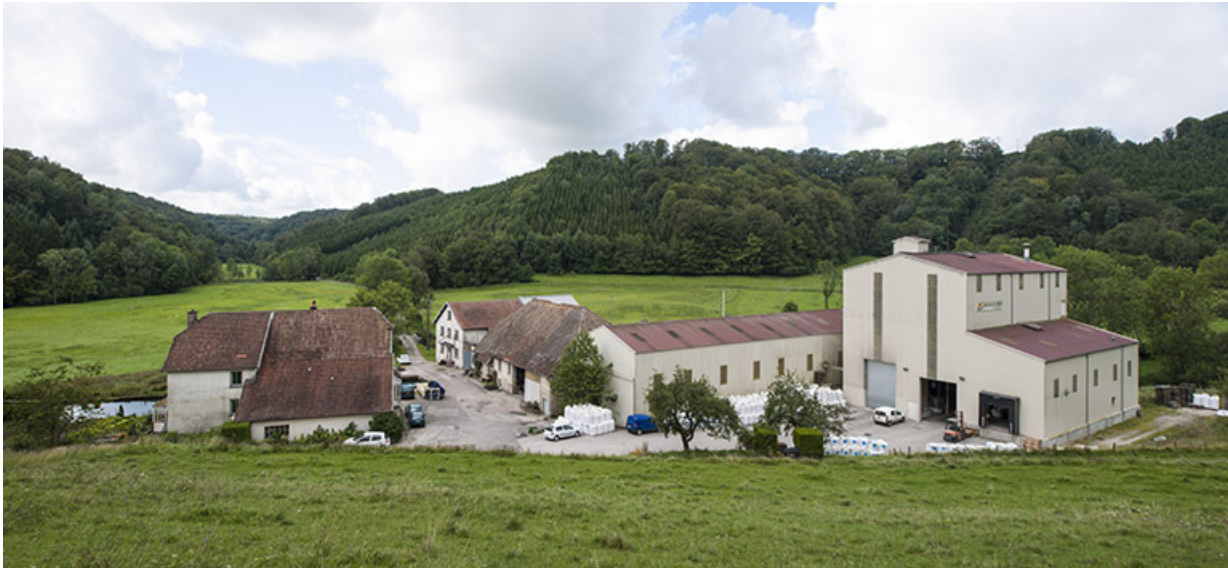
Vue plongeante depuis le nord-est.