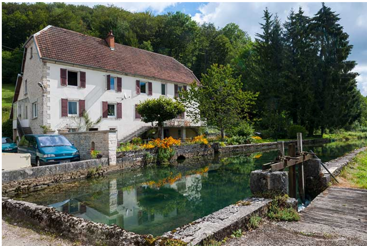
Le logement (moulin primitif) et le bief d'amenée.