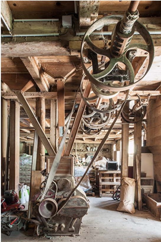
Rez-de-chaussée surélevé. Broyeur à cylindres Lacroix et le système de transmission. 25, Villers-Chief, lieudit : Creuse