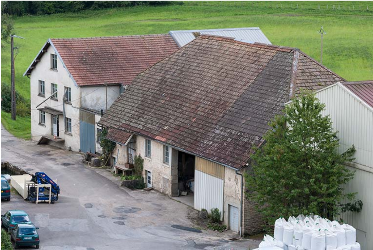
Vue plongeante sur les bâtiments du moulin.