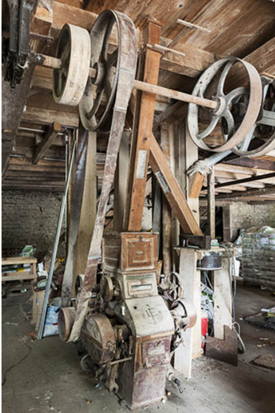
Rez-de-chaussée surélevé. Broyeur à cylindres Lacroix (Dole) et sa transmission par courroie. 25, Villers-Chief, lieudit : Creuse