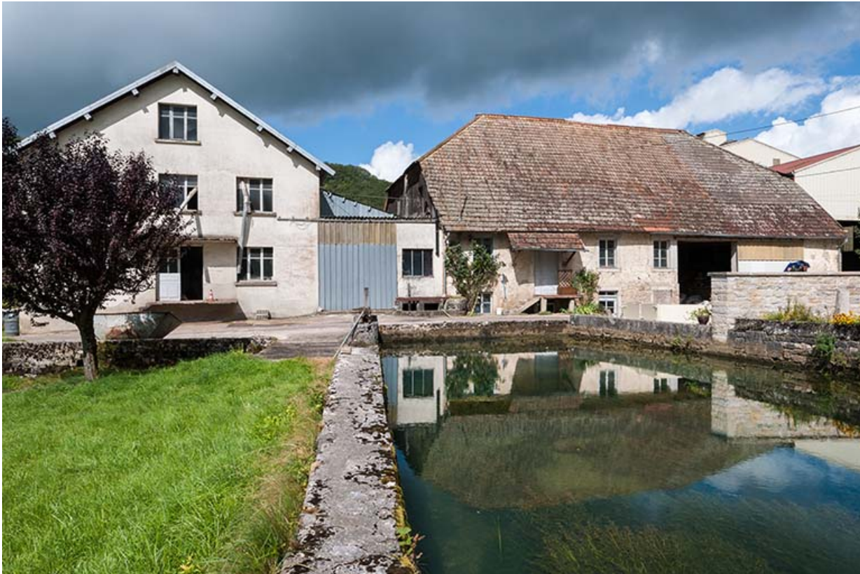
Le moulin depuis le bief d'amenée.