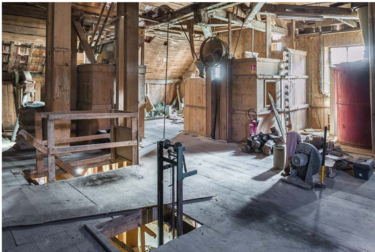
Etage de comble. Vue d'ensemble : monte-sac, chambres à grains.