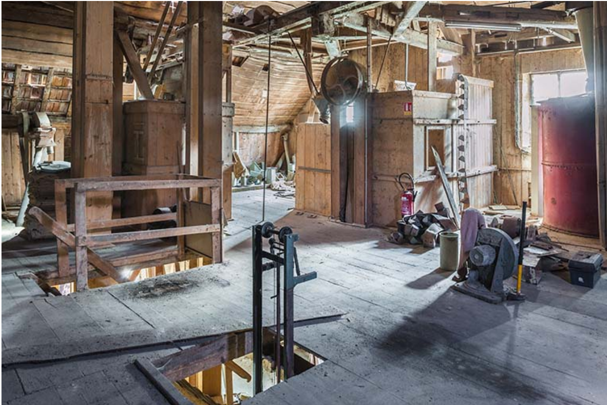
Etage de comble. Vue d'ensemble : monte-sac, chambres à grains. 25, Villers-Chief, lieudit : Creuse