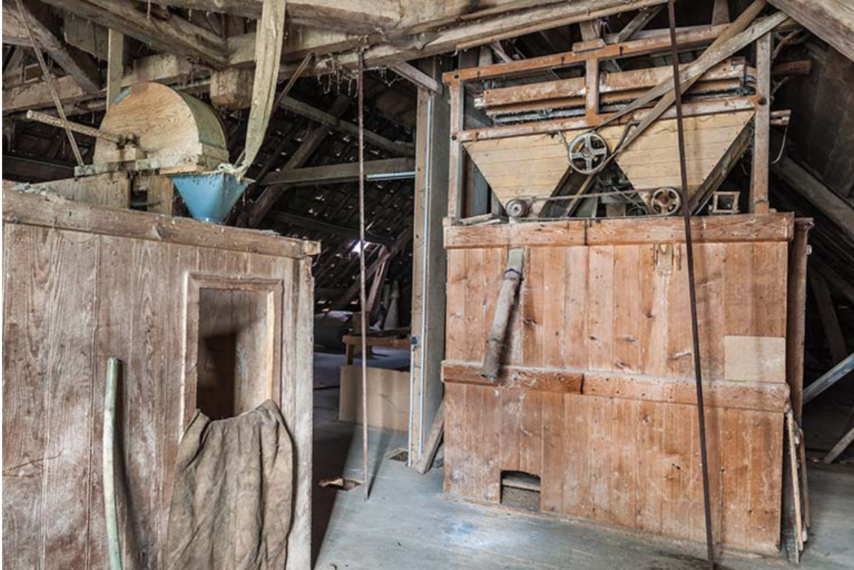
Etage de comble. Chambres à grains.