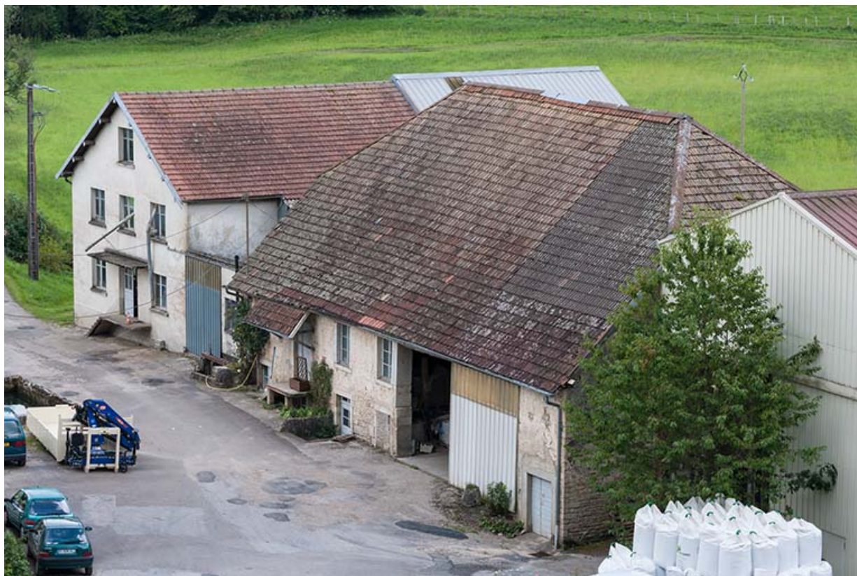
Vue plongeante sur les bâtiments du moulin.