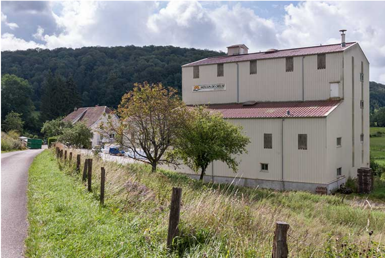
Vue depuis la route d'accès. A droite, le nouvel atelier de fabrication.