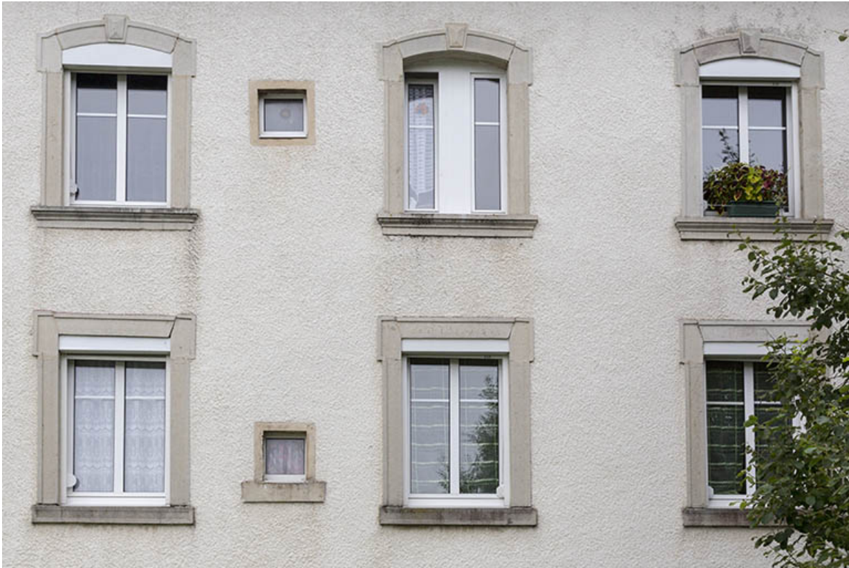
Logement patronal, façade postérieure : fenêtres.