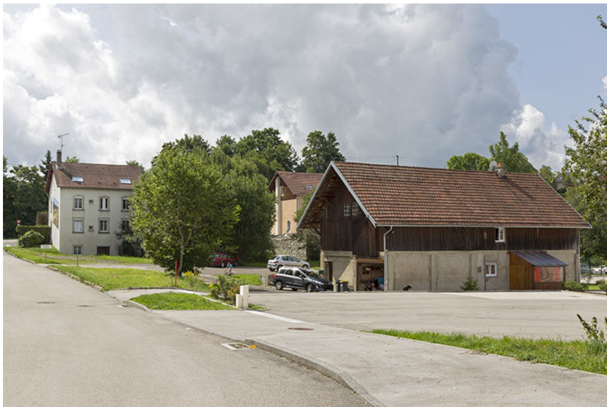
Vue d'ensemble, depuis le nord. Au premier plan à droite, bâtiment ayant servi de logement d'ouvriers, étable et dépôt de sciure ; à l'arrière-plan à gauche, le logement patronal.