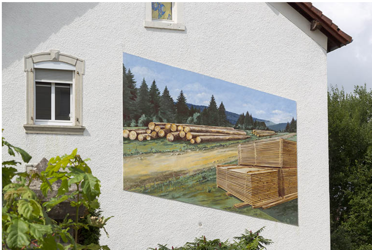
Logement patronal, façade latérale droite : peinture murale.