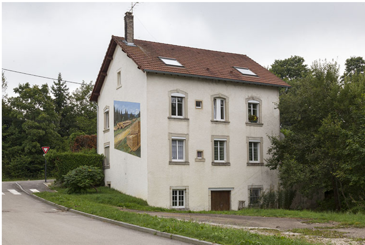
Logement patronal : façades postérieure et latérale droite.