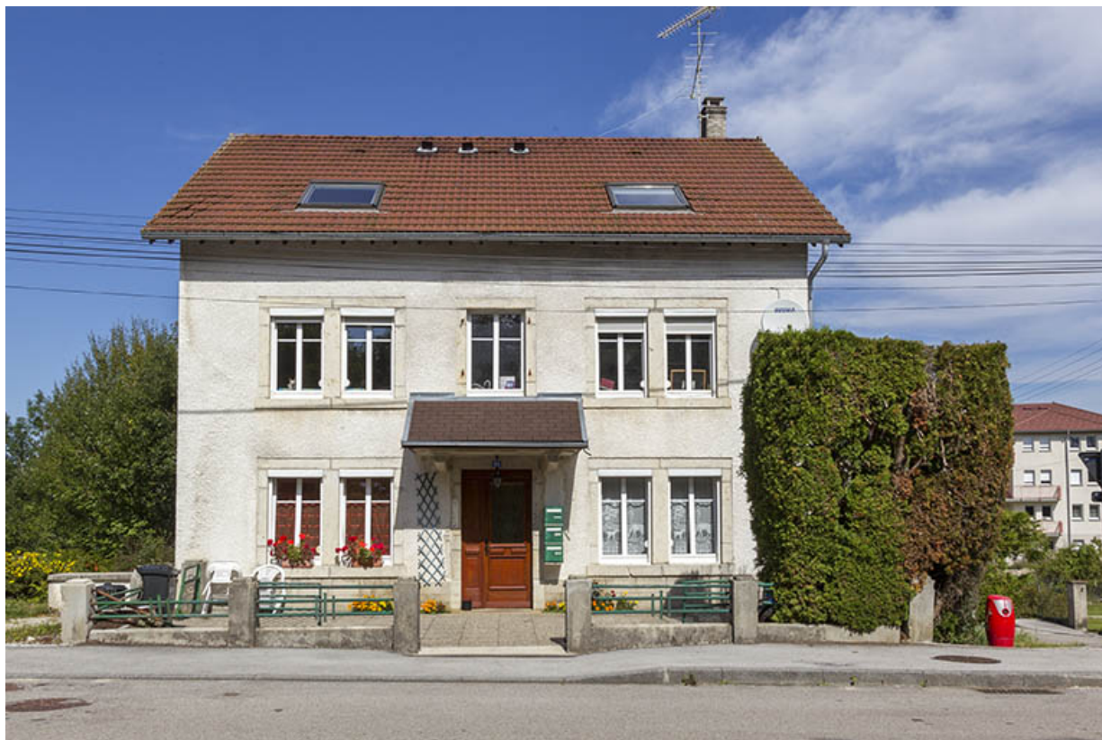
Logement patronal : façade antérieure.