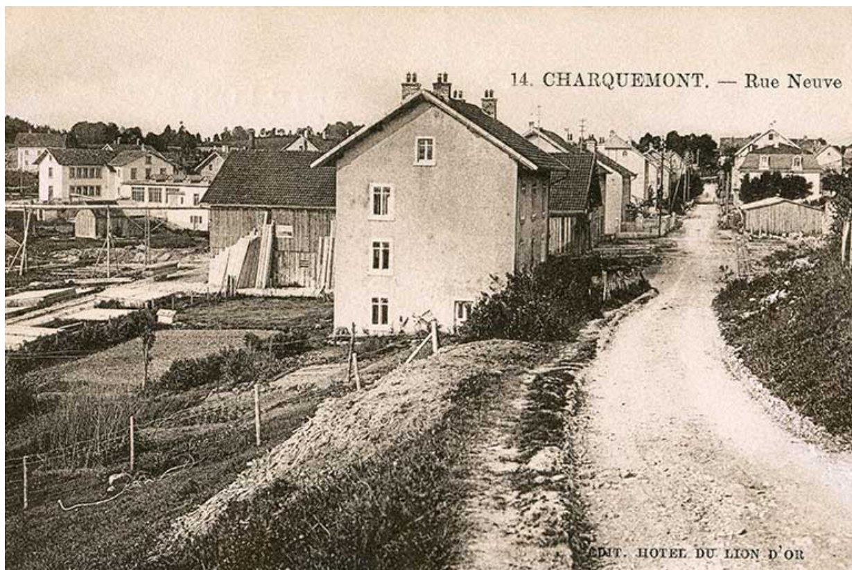
14. Charquemont. - Rue Neuve [vers la scierie], 2e quart 20e siècle 25, Charquemont, 16 Rue Neuve

14. Charquemont. - Rue Neuve [vers la scierie], carte postale, s.n., s.d. [2e quart 20e siècle], éd. Hôtel du Lion d'Or à Charquemont