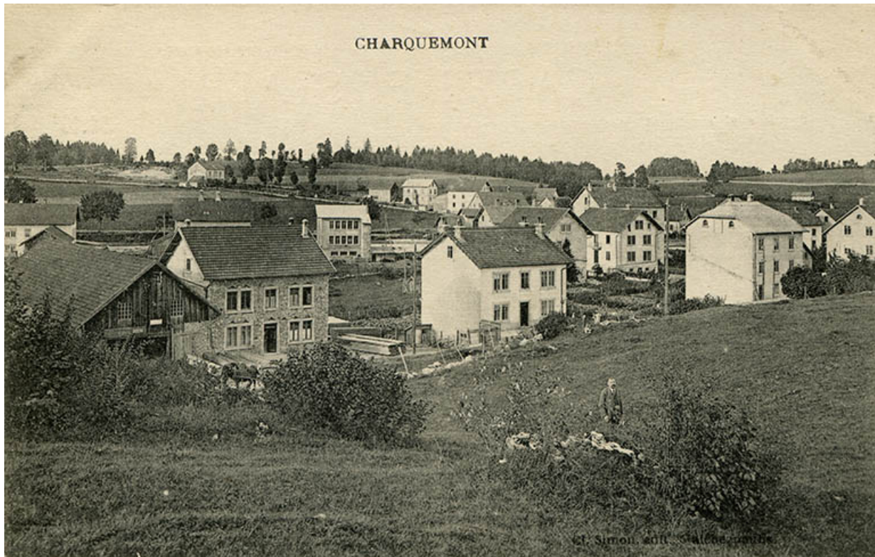
Charquemont [la Rue Neuve et le quartier de la gare, depuis le sud], décennie 1910.