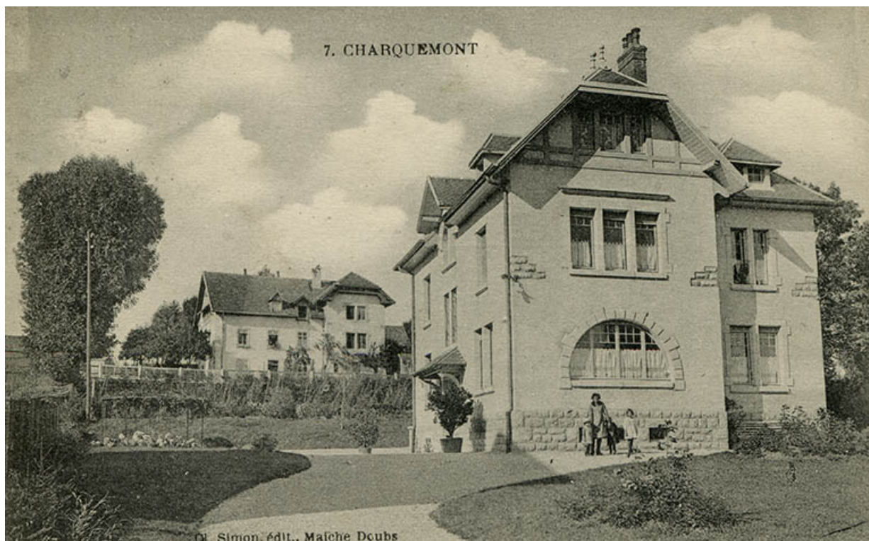
7. Charquemont [la maison de Gaston Maillot avec en arrière-plan celle de Paul Bessot], entre 1913 et 1926. 25, Charquemont, 6 rue Cuvier