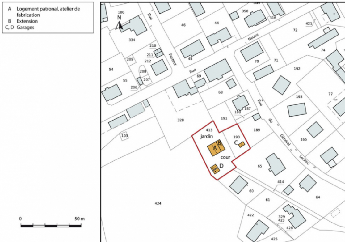
Plan-masse et de situation. Extrait du plan cadastral, 2015, section AI. 25, Charquemont, 15 rue du Général Leclerc