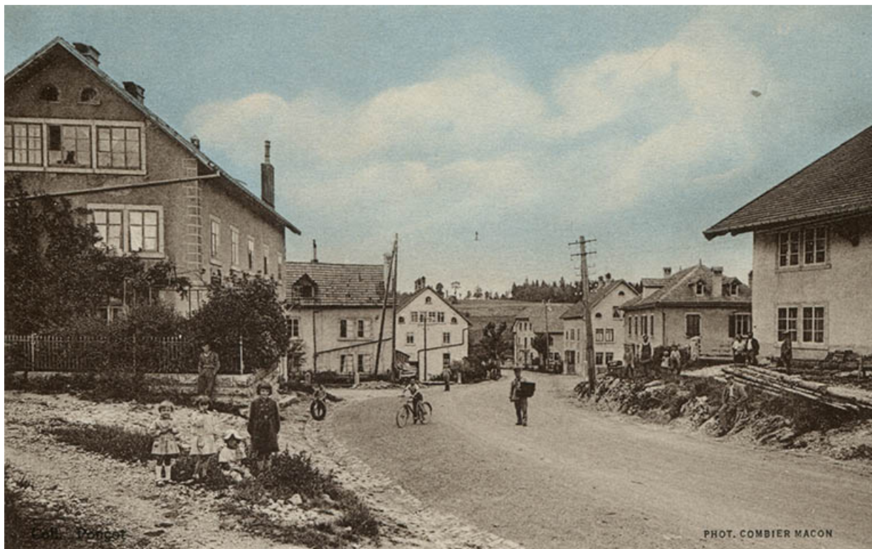
Charquemont (Doubs) - Rue de Maïche [près du carrefour de la Rue Neuve], 2e quart 20e siècle.