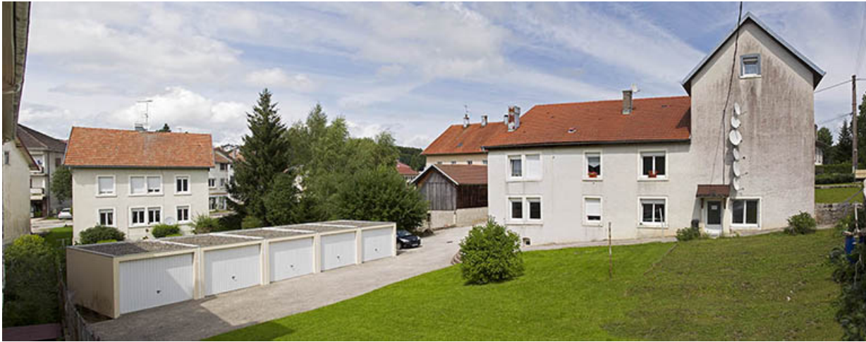
Vue d'ensemble, depuis l'ouest. De gauche à droite : garages, aile en retour et bâtiment principal (mur pignon). 25, Charquemont, 2 Rue Neuve

N° de l'illustration : 20142501873NUC4AQ