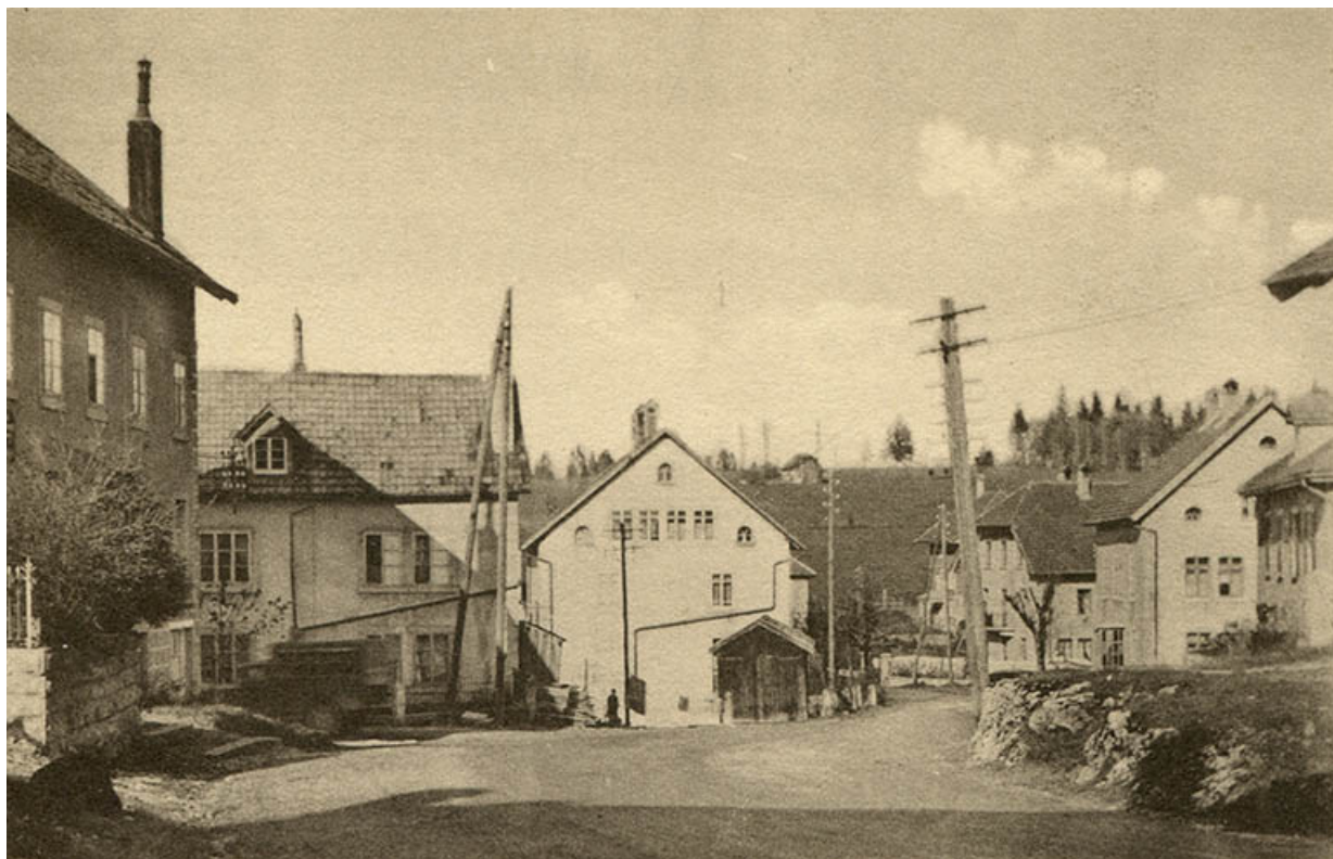
Charquemont (Doubs) - Intérieur du village [la Grande Rue au carrefour de la Rue Neuve], 2e quart 20e siècle.