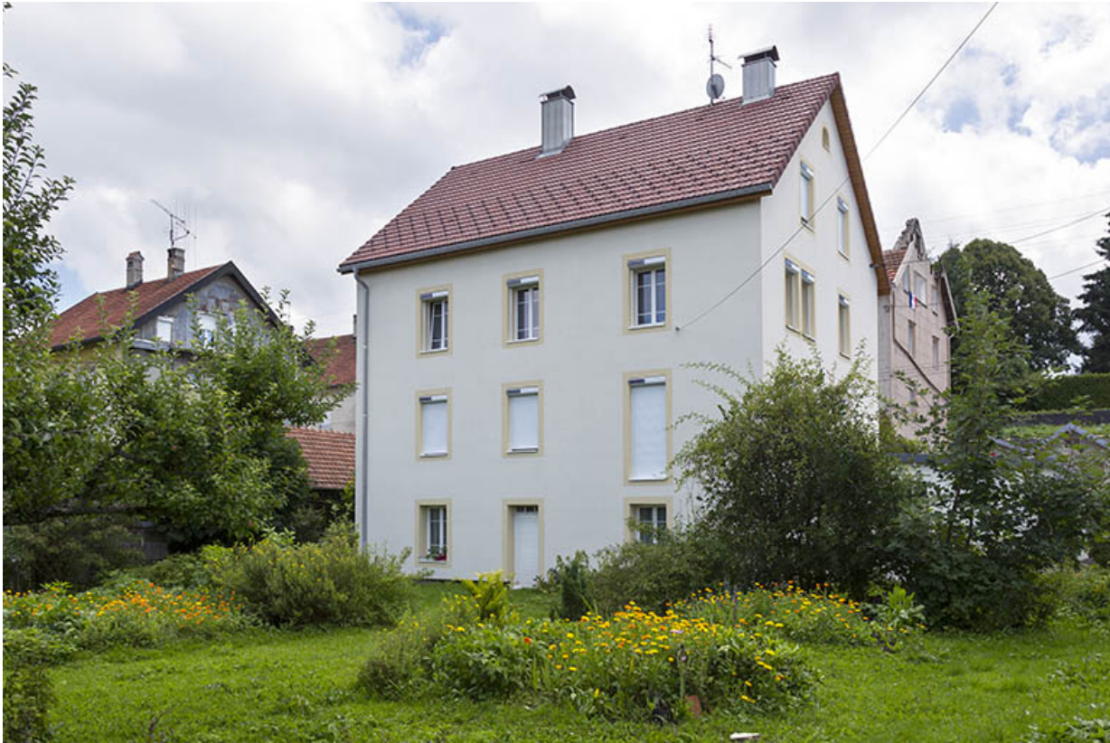
Façades postérieure et latérale gauche.