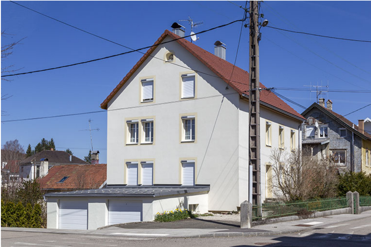
Façades antérieure et latérale gauche.