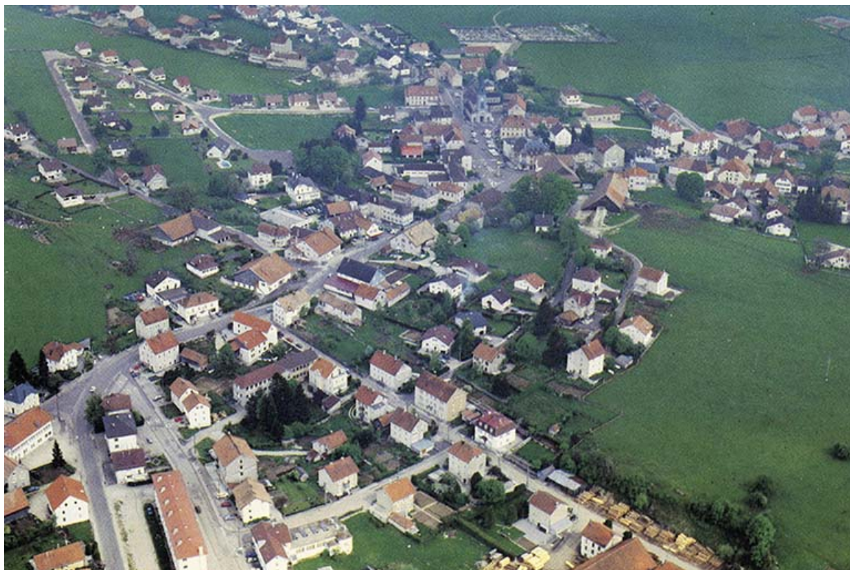
25140 Charquemont [vue aérienne du village depuis l'ouest], 4e quart 20e siècle 25, Charquemont, 3 rue Pasteur