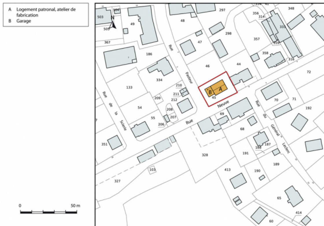
Plan-masse et de situation. Extrait du plan cadastral, 2015, section AI. 25, Charquemont, 10 Rue Neuve