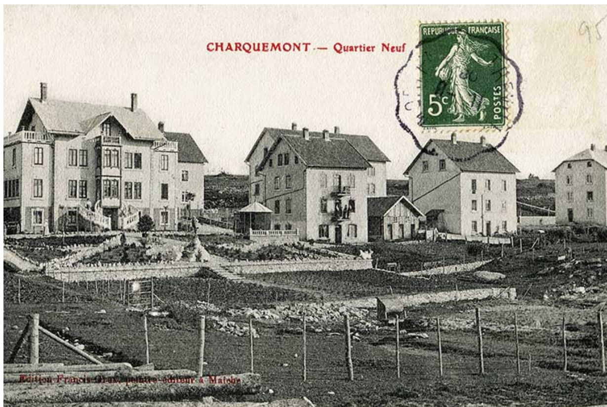
La Rue Neuve (rue des horlogers), avec de gauche à droite les ateliers de l'Union ouvrière (n° 6), Gigandet-Bernard (n° 8), Erard (n° 10) et Donzé (n° 12) : Charquemont - Quartier Neuf, entre 1903 et 1918 ?