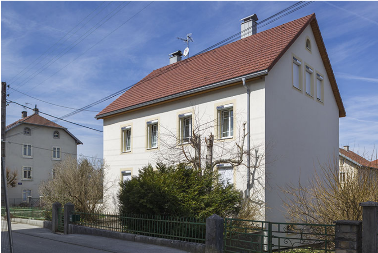
Façades antérieure et latérale droite.