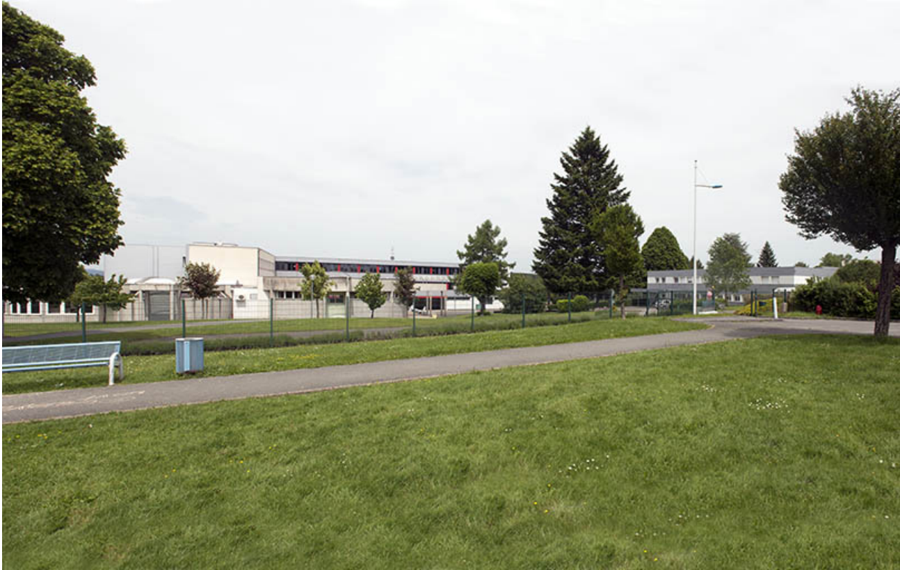
Vue d'ensemble depuis la placette au sud.