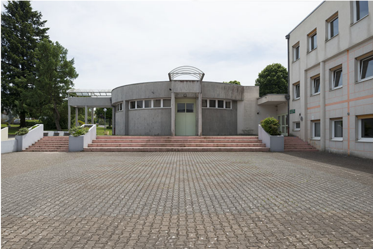
La cour, face à la façade nord de la salle polyvalente.