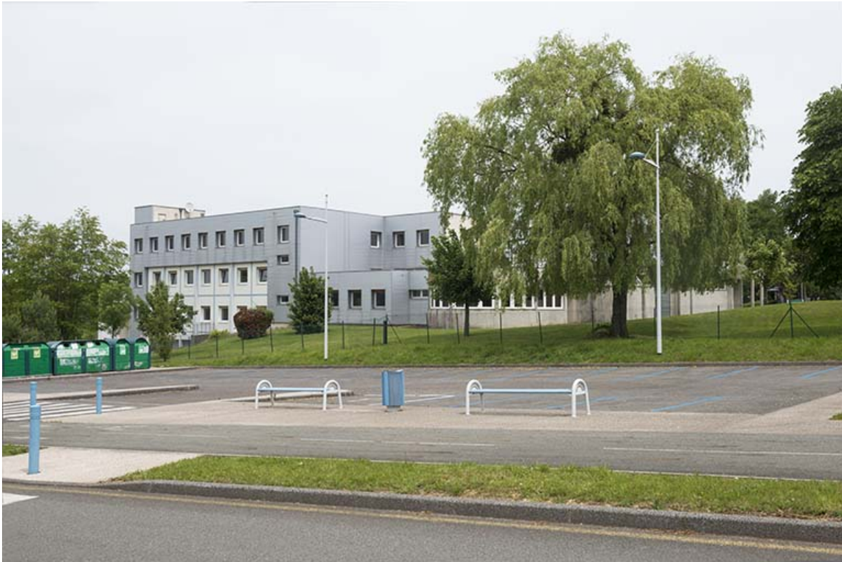
Vues depuis la placette, les façades ouest de l'externat.