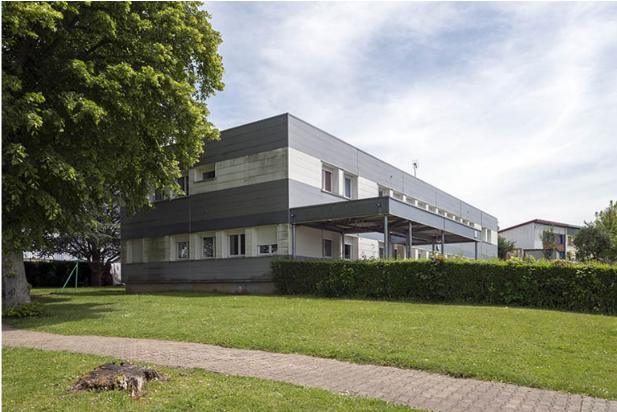
Angle nord-ouest, pignon nord et façade ouest de l'administration. 25, Bethoncourt impasse Camus