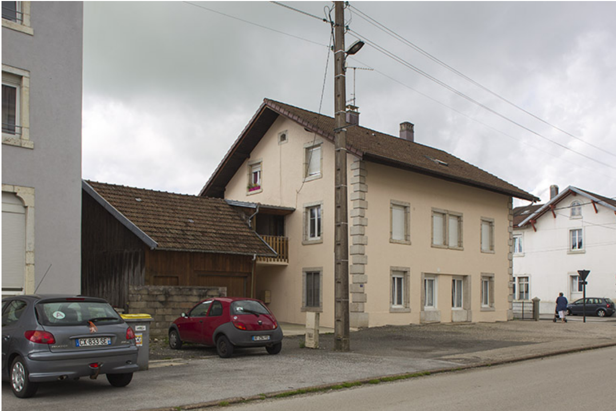
Vue d'ensemble, depuis le nord-ouest.