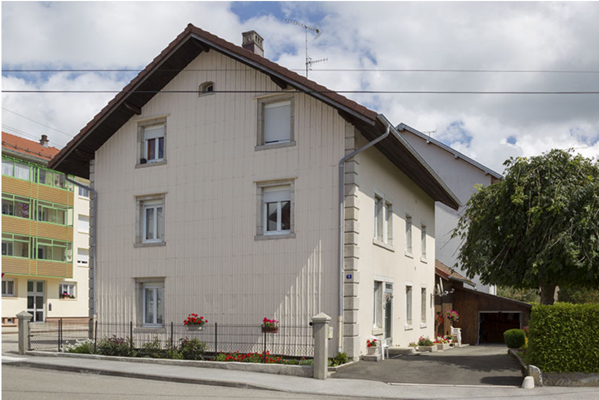
Façades latérale droite et postérieure.