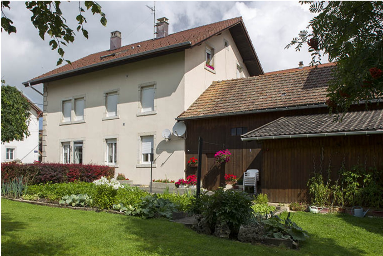
Façade postérieure, de trois quarts droite.