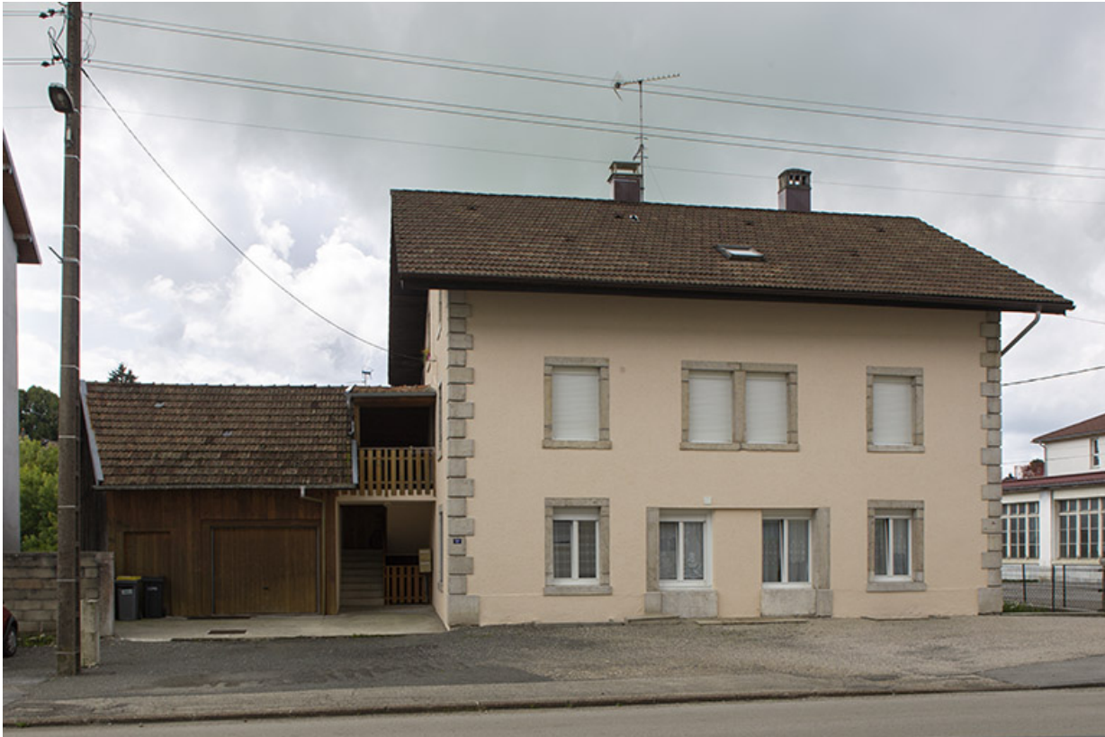
Une maison du quartier de la gare du début du 20e siècle (vers 1907) : Café Parisien et comptoir d'horlogerie Demangelle (11 rue de la Gare).