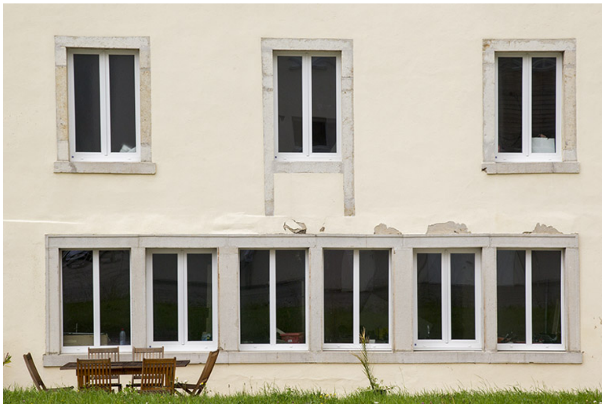
Façade postérieure : fenêtres multiples à l'étage de soubassement.