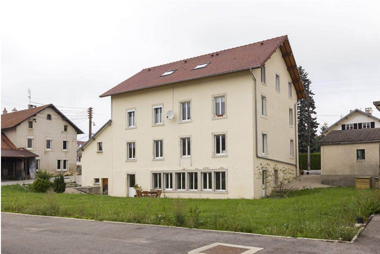
Façades postérieure et latérale droite.