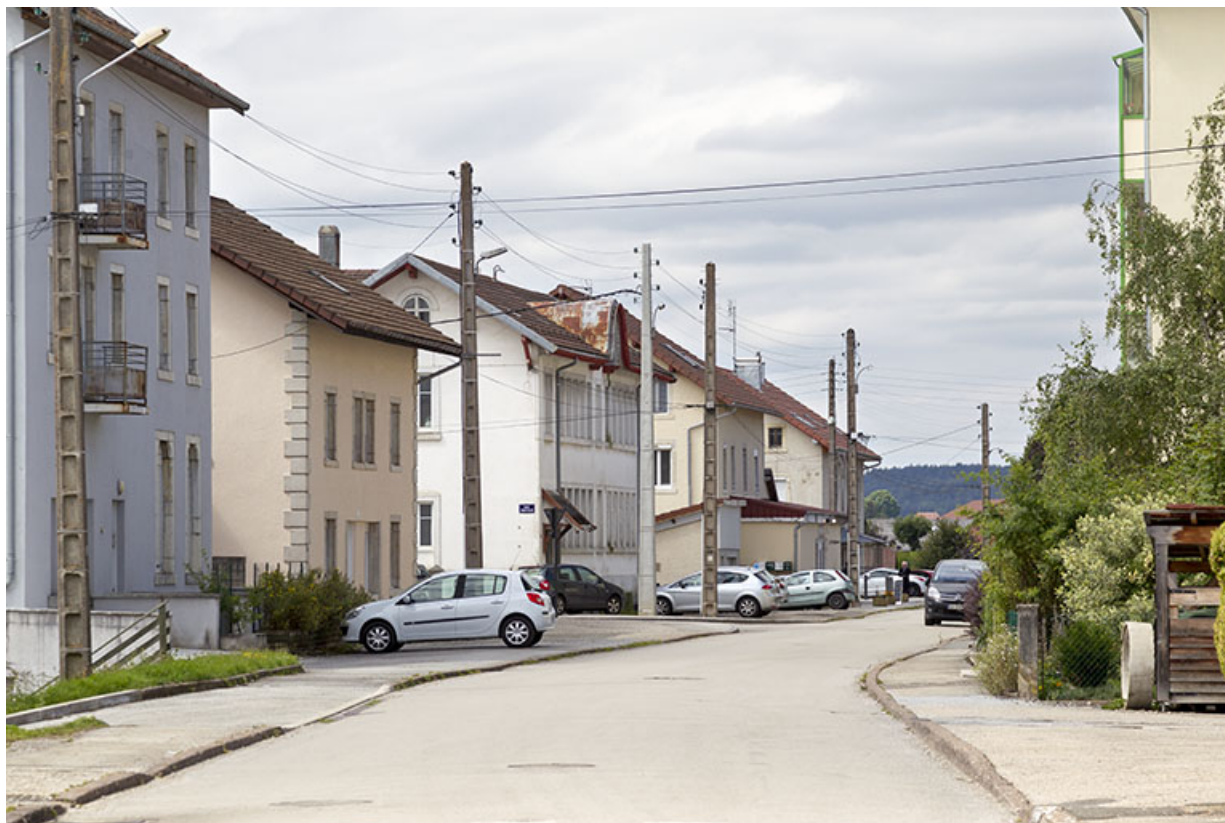
Vue d'ensemble de la rue de la Gare. Les trois bâtiments au centre sont, de gauche à droite, le comptoir d'horlogerie Demangelle (n° 11), l'usine de boîtes de montre puis de décolletage et d'emboutissage Pagès (n° 13), et l'atelier de mécanique Prétot puis d'horlogerie Courtet Frères (n° 15).