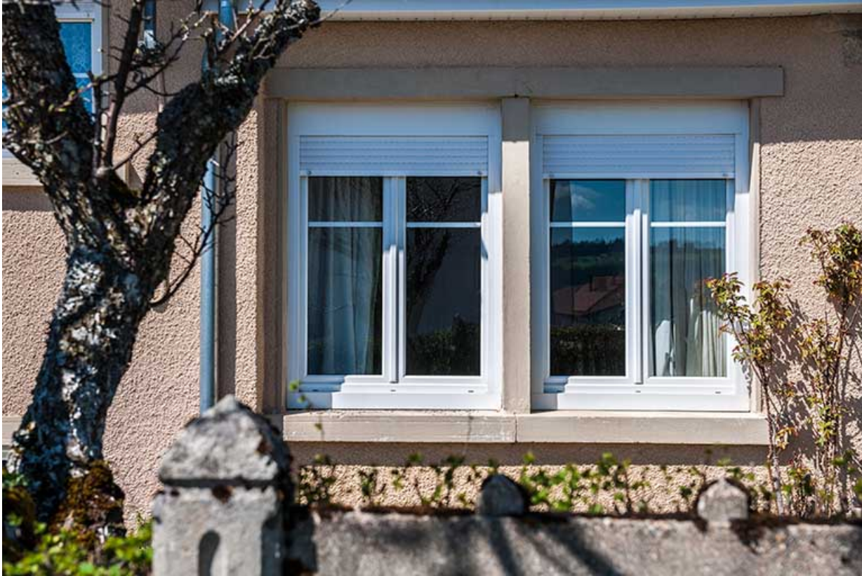
Fenêtres horlogères sur la façade antérieure.