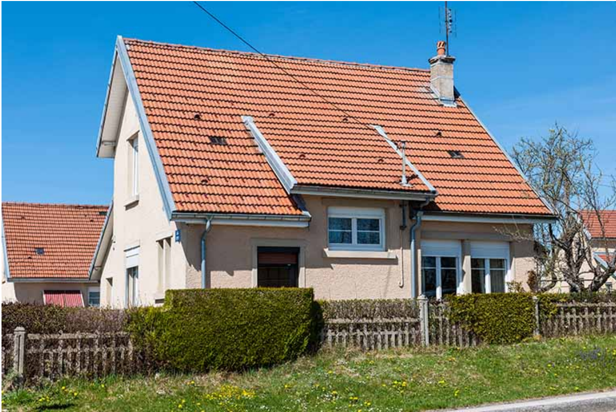
Une maison HBM de 1929 : atelier d'horlogerie Courtet Frères et Cie (2 rue des Cités). 25, Charquemont, 2 rue des Cités