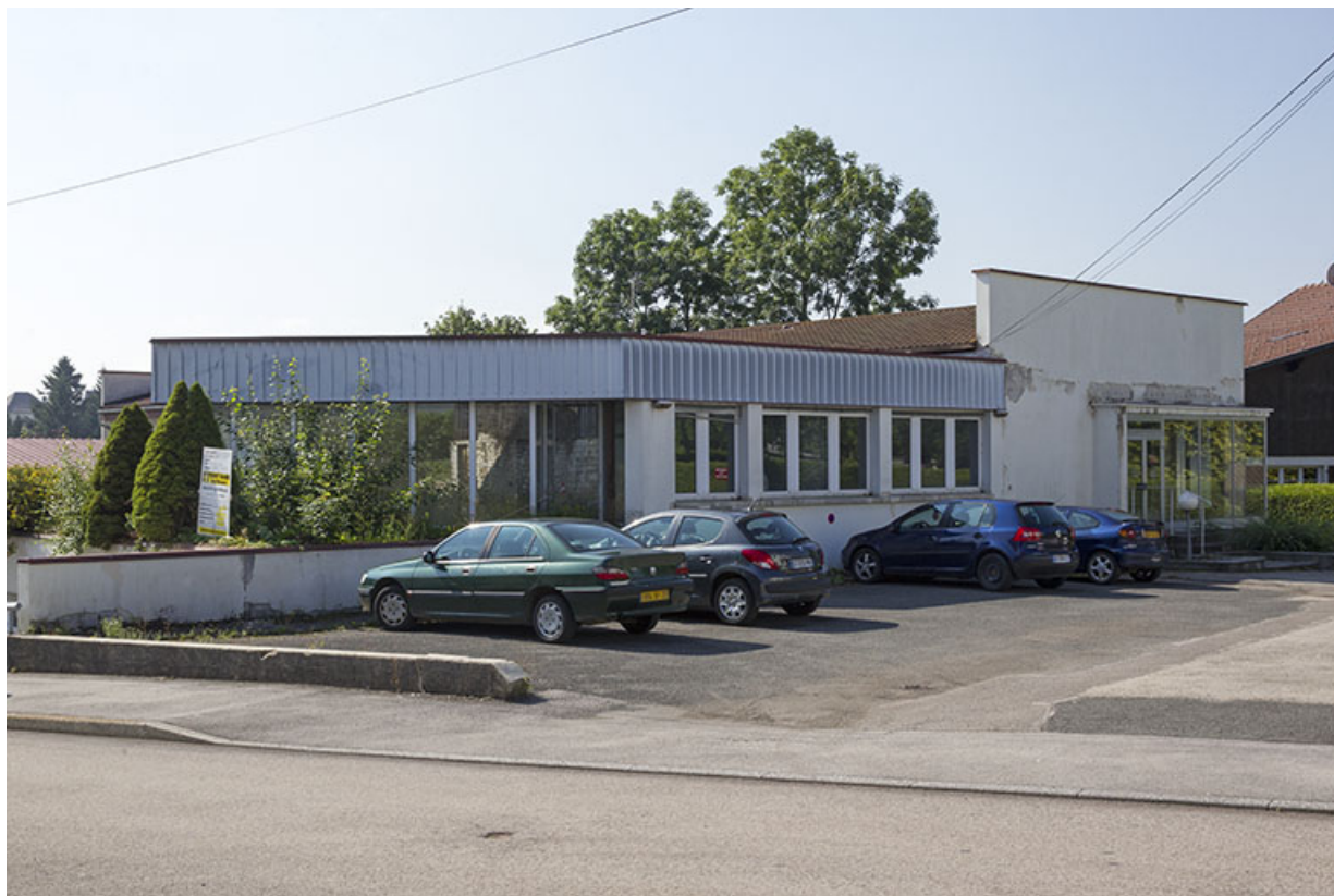
Usine, vue du nord-est : corps de bâtiment récent à gauche, ancien à droite.