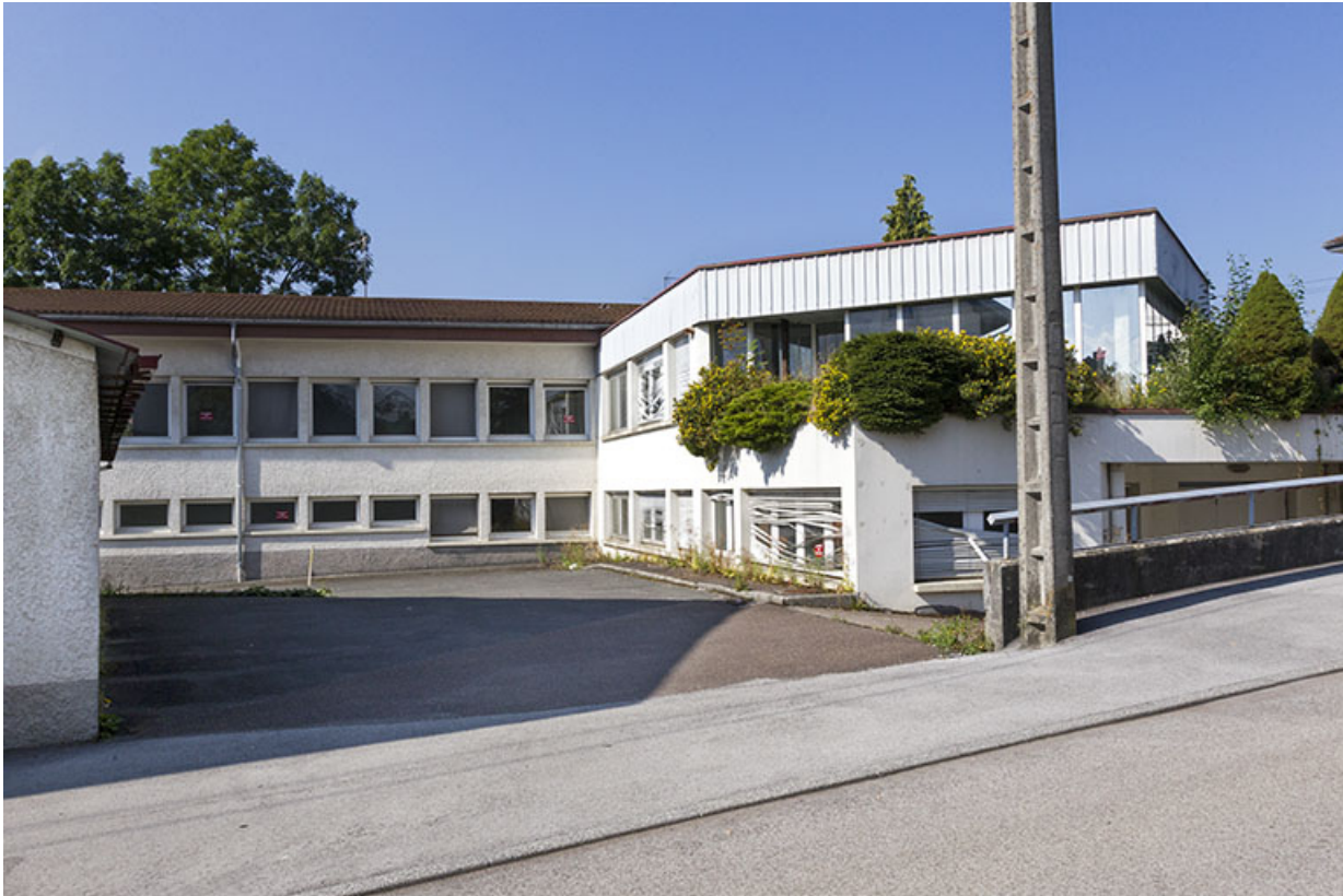
Usine, vue de l'est : corps de bâtiment ancien à gauche, récent à droite.