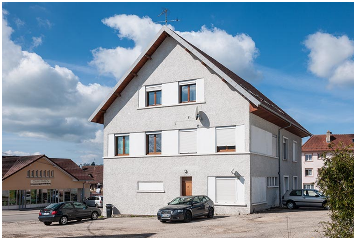
Une usine de 1953 : usine de taille de pierres pour l'horlogerie Macabrey (3 rue du Chalet). 25, Charquemont, 3 rue du Chalet